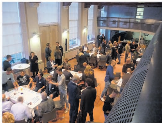
Groepjes buigen zich over ideeën om 'meer bewegen' onder de aandacht te brengen.

Regio - Dat veel mensen, zelfs heel jonge kinderen, kampen met overgewicht door een ongezonde leefstijl is bekend. NL. Vitaal tracht een omslag te bewerkstelligen in dit patroon. Obesitas, diabetes en hart- en vaatziekten zijn vaak terug te leiden naar een ongezonde leefstijl. Naar schatting bedragen medische kosten en werkverzuim in Nederland jaarlijks twee miljard euro. Als we zo doorgaan is 69% van de Nederlanders rond 2040 (te) zwaar. De kracht van NL. Vitaal zit hem in het heel breed gedragen initiatief. NL.Vitaal trekt door het land om aandacht te vragen voor dit probleem. Ministers, wethouder, CEO's van grote ondernemingen en uiteenlopende organisaties hebben zich aangesloten.