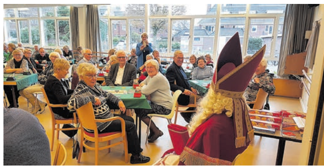
Sint kwam ook op bezoek.