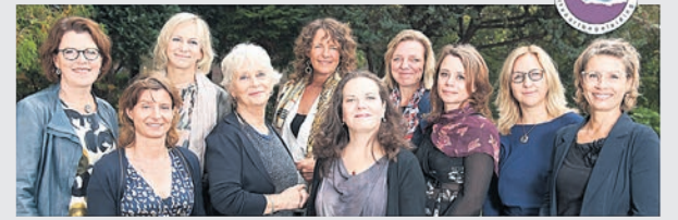
Het team van Brokking & Bokslag Uitvaartbegeleiding in Heemstede

Wij verwelkomen u graag op zondag 9 december vanaf 18.30 uur (start 18.45 uur) in de Oosterkerk Haarlem, Zomerakade 165, 2032 WC Haarlem.