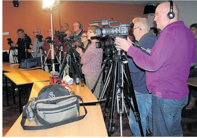
Leden van de club in actie.