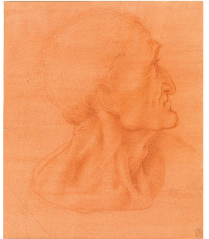
Leonardo da Vinci (1452-1519). Studie voor het hoofd van Judas, ca. 1494-98. Rood krijt op rood geprepareerd papier.

tentoonstelling te zien, alsmede een bijzondere kopieversie van dit werk uit de abdij van het Belgische Tongerlo. In Milaan maakte Leonardo nog talloze tekeningen voor oorlogstuig en voor een reusachtig ruitersstandbeeld. Dat laatste is echter nooit uitgevoerd. In 1500 gaat Leonardo terug naar Florence en begint onder andere aan de Mona Lisa met haar veelbesproken glimlach. Voor deze mysterieuze en unieke glimlach lagen zijn anatomische tekeningen van de mond en lippen ten grondslag. Hij werkt afwisselend in deze periode in Milaan en Rome. In 1516 vertrekt hij naar Amboise in Frankrijk en treedt hij in dienst van de Franse koning Frans I. Hij is dan 64 jaar. Hij overlijdt in 1519 op 67-jarige leeftijd. Zijn grafsteen is te bezoeken op het terrein van het kasteel in Amboise.