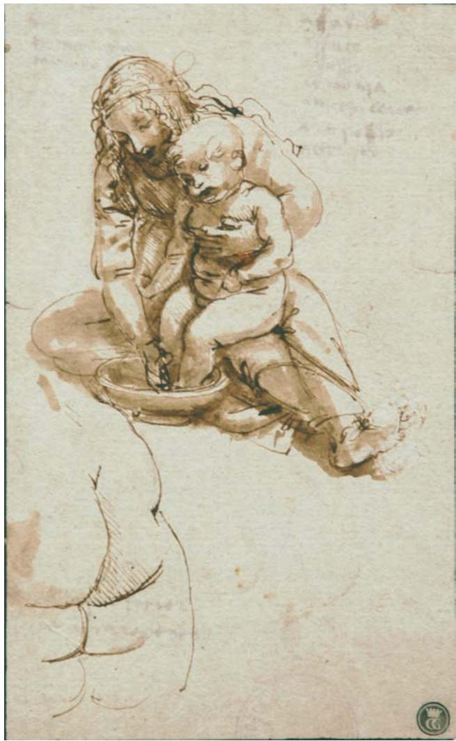
Leonardo da Vinci (1452-1519). Jonge vrouw de voeten wassen van een peuter, ca. 1478-80. Pen en penseel in bruine inkt over resten van zwart krijt. Faculdade de Belas Artes, Universidade do Porto, Porto.

Tot en met 6 januari vindt er een overzichtstentoonstelling over Leonardo da Vinci plaats in het Teylers Museum in Haarlem. Op 2 mei 2019 is het exact 500 jaar geleden dat Leonardo da Vinci overleed. Leonardo da Vinci wordt beschouwd als een veelzijdig genie en is een van de beroemdste kunstenaars uit de renaissance die de wereld gekend heeft. Hij bracht in de kunst een vernieuwend elan als grondlegger van knappe en gedetailleerde anatomische tekeningen, gezien vanuit verschillende perspectieven. Deze anatomie gebruikte hij om zijn kunstwerken een bepaalde uitdrukking te geven. Ook tekende hij vele karikaturen, die een komische, mischien zelfs een ironische inslag hadden. Zo tekende hij bijvoorbeeld een karikatuur van Dante Alighieri, de beroemde Italiaanse dichter, schrijver en grondlegger van de Italiaanse taal uit de 13de en 14de eeuw.