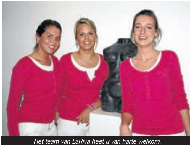
Het team van LaRiva heet u van harte welkom.