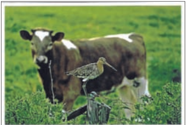
Winnende foto met grutto en koe van de heer F. Wetting uit Haarlem.

Wilt u lid worden van het Cliëntenpanel? Dan kunt u zich aanmelden via het secretariaat van Zorgbelang Noord-Holland: 023 - 530 00 00 of mail naar info@zorgbelang-noordholland.nl. Meer informatie over het Cliëntenpanel staat op website: www.zorgbelang-noordholland.nl.