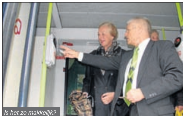
Is het zo makkelijk?

het opladen en de verschillen tussen automatisch opladen en kopen van saldo via internet, het levert veel vragen op. Het doet denken aan de invoering van die moeilijke strippenkaart in 1980, die in 2009 geen enkel probleem meer is. Als alle vragen op zijn, gaat men naar de bus van Connexxion, die op het plein voor het raadhuis al wacht. Hier blijkt dat