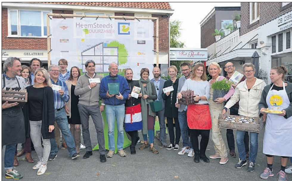
Alle deelnemers MVO op iedere vrijdag in het Raadhuis.