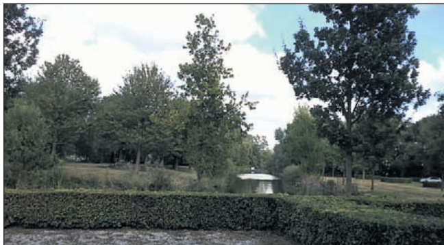
De mooie omgeving van Het Oude Slot Heemstede, waar de kraampjes van de Trotsmarkt zullen worden opgesteld.

De Trotsmarkt kenmerkt zich door laagdrempeligheid, geen zaken zoals suikerspinen, draaimolens of springkussens maar puur, trots passie en bevoegenheid over de producten die de standhouders willen delen met het publiek. Daarnaast zal er een 'Heemstede Trots' zijn op het binnenplein van Het Oude Slot, daar kunnen Heemstede ondernemers zich presenteren aan een geïnte-