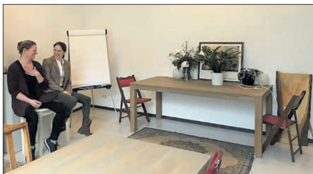
In deze 'kamer' wordt geluncht met de collega's. Tevens is deze ruimte een vergaderlocatie.