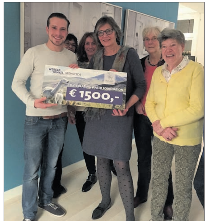
duurzaam. De zeer zachte alpaca's zijn te koop in de Wereldwinkel in Heemstede, Raadhuisstraat 29. Kijk ook op: www.wereldwinkelheemstede.nl .

De producten van Inkari Alpaca zijn een zeer verantwoorde keuze; milieubewust, diervriendelijk, fairtrade en