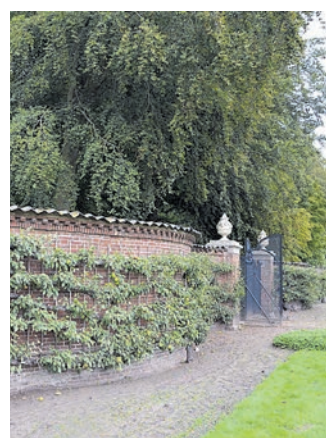
Slangenmuur Huis te Manpad.