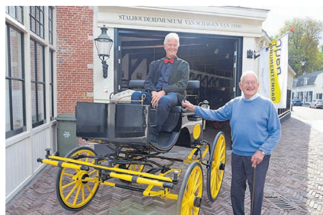
Stalhouderij museum Van Schagen.