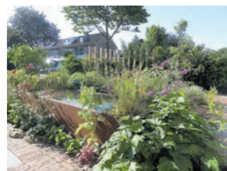
Extra prijs voor de tuin die veel vlinders en bijen aantrekt.