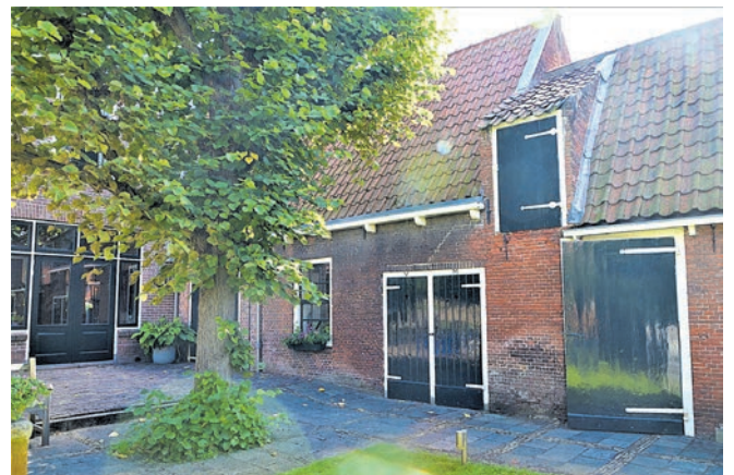
300 jaar oude linde bij Bakkershuisje.