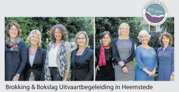
Brokking & Bokslag Uitvaartbegeleiding in Heemstede

Iedere eerste maandag van de maand van 16.00 tot 18.00 uur staat de deur voor u open aan de Herenweg 92 in Heemstede. Een afspraak maken is niet nodig. U kunt vrijblijvend binnen lopen om kennis met ons te maken, de sfeer te proeven, ons Afscheidshuis te bekijken en al uw vragen te stellen. Voor meer informatie: www.brokkingsbokslog.nl.