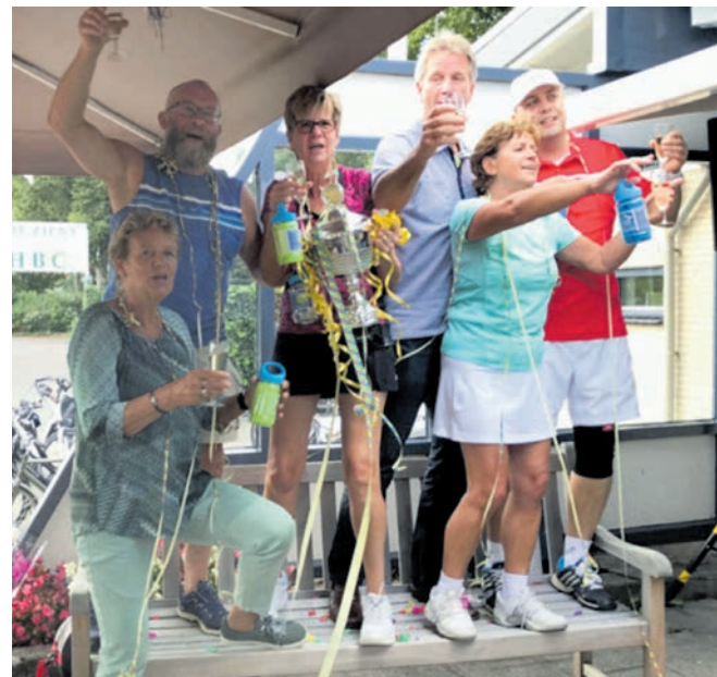
De Park4you winnaars 2018 "De Hardhitters".

De hapjes tafel werd verrassend veel bezocht na de gespeelde wedstrijden net zoals de tapasavond een succes was en zeker voor herhaling vatbaar is. Op de laatste dag van het toernooi werd onder grote belangstelling om de belangrijkste punten