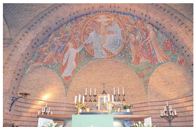
Wandschildering Han bijvoet in OLV Hemelvaart.