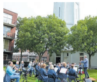
Harmonie St. Michael speelt bij het Pomphuis.