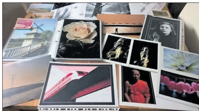
Diverse objecten en personen die Marenka fotografeerde. Van strakke lijnen naar romantische portretten.

Ik kocht een Zenit (Russisch) camera, mijn eerst semi professionele toestel, er volgde nog een Praktica-BC1 en later ging ik mij specialiseren met volledig professionele camera's en bij behorende