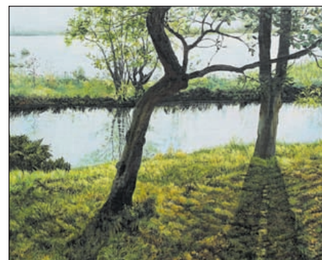
Werk van de Heemstedse An Luthart.

De tentoonstelling is vanaf donderdag 17 augustus t/m zondag 3 september in de Waag aan het Spaarne te Haarlem 30 te bezichtigen. Op zondag 20 augustus om 16.00 uur vindt de officiële opening plaats. Info: www.kzod.nl en Facebook.