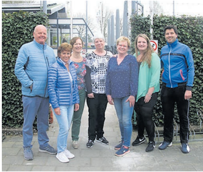
De Open Toernooicommissie 2018

Op de website www.tvhbc.nl vind je nog meer informatie over dit toernooi. De Open Toernooi Commissie van tennisvereniging HBC heeft er weer heel veel zin in en hoopt velen van u op het park te mogen begroeten tijdens dit prachtige toernooi.