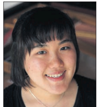
Sun A Park

en via TIHMS: 072-2202310 (maandag tot en met vrijdag van 10 tot 16 uur).