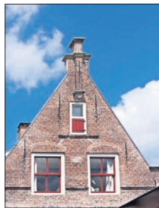
17de-eeuwse tuitgevel aan de achterzijde van het Wapen van Heemstede.

len hoe ze opgroeiden tussen priesters, nonnen en studenten. Een bijzonder verhaal van een bijzondere jeugd. In Bennebroek stond in de jaren vijftig aan de Bennebroekelaan Huize Marjo, enkele jaren lang een contractpension voor Indische Nederlanders. Een oud-bewoner deed naspereuring naar waar het precies gestaan heeft en onthult een voor velen onbekend stukje geschiedenis. Verder onder meer een inter-