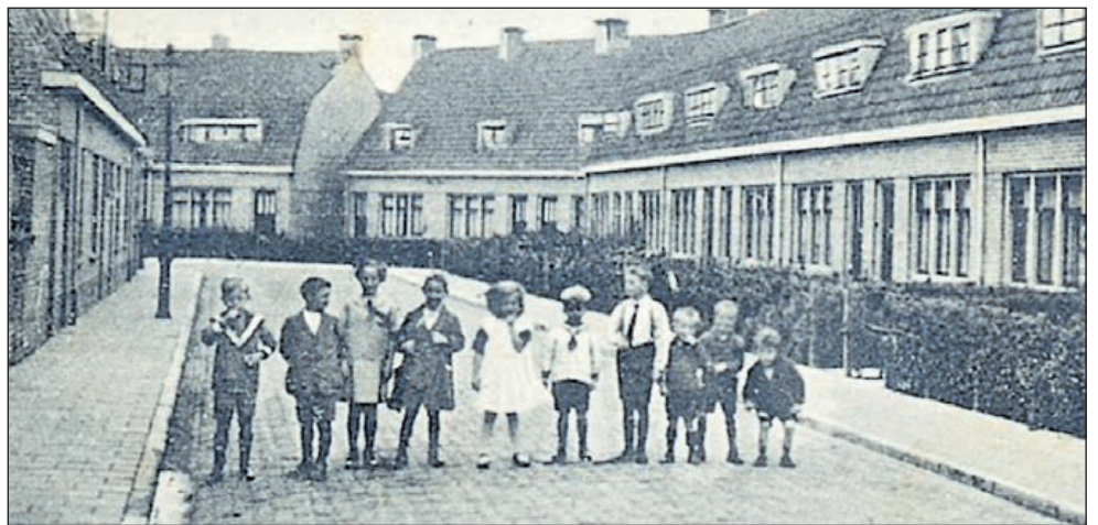
Kindertjes op de foto in de Balistraat, rond 1930.

Vrijdag 4 t/m zondag 6 augustus regiokampioenschappen paardensport in Haarlemmermeerse Bos. V.a. 9-17u dagelijks. Toegang: gratis. Info: www.haarlemmermeerruiters.nl