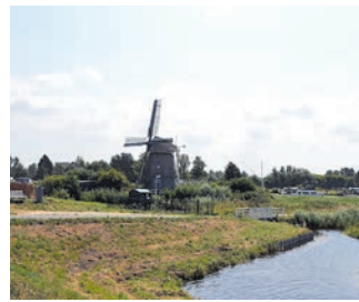
Molen de Hommel.