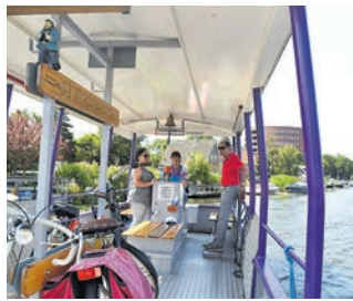
Pontje de Stroomboot.