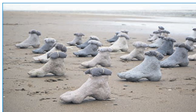
‘Voetreis’ van beeldend kunstenaar Hieke Meppelink.

telijk: die bundeltjes zitten boordevol talenten, levensverhalen, ervaringen. Maar ook vol oorlogstrauma's, frustraties, verdriet en pijn. Wat torsen mensen met zich mee? En hoe gaan wij Neder-