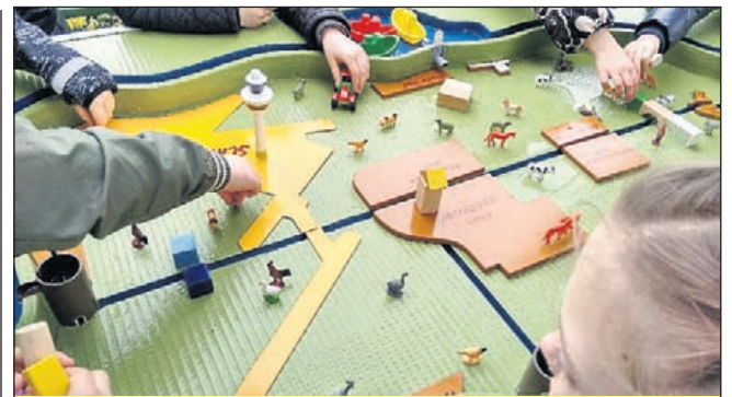
De watertafel (foto Janneke Oldenbeuving).

ciële cursus voor mensen met de ziekte van Parkinson. Het accent zal liggen op een