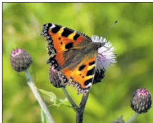
Kleine vos (Foto: Henk van Bruggen).

In deze tijd van het jaar vliegen er veel vlinders over de bloemrijke graslanden van de buitenplaats. Een deel van dit gebied heet de Linnaeustuin. De beheerder maait die pas laat in het jaar. Dat zorgt ervoor dat er nu enorm veel