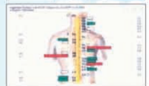
Voorbeeld van een gemaakte scan

Nieuw: decompressie therapie voor behandeling hernia