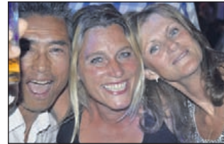
Genieten tijdens het 30up strandfeest van Swingsteesjun.

Of op de voorverkoopadressen: Readshop (Marktplaan 33), Haarlem: Muys Kantoor & Kado (Gedempte Oude Gracht 108) en Van der Geest Optiek (Generaal Cronjéstraat 15). In Heemstede bij Ajewe-Sport (Raadhuisstraat 95). De deuroprijs bedraagt 16 euro.