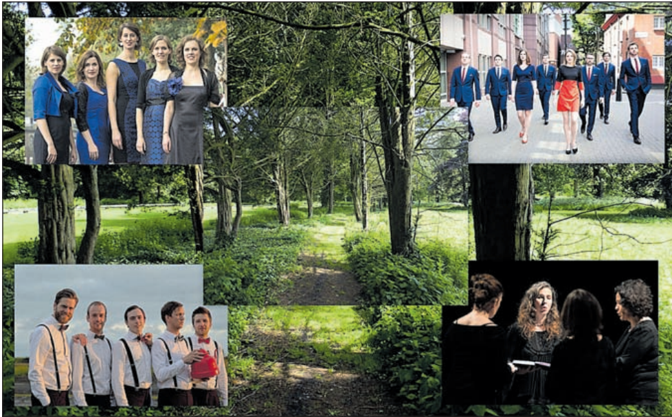
Linksboven: Wishful Singing. Rechtsboven: Voces 8. Linksonder: Olga Vocal Ensemble. Rechtsonder: Ensemble Dialogos.