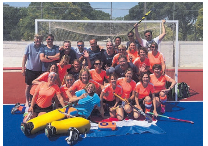
Dames veteranen B en heren veteranen C van Alliance Heemstede.

Heemstede - Afgelopen weekend traden zowel dames veteranen B als de heren veteranen C van hockeyclub Alliance aan tijdens een internationaal toernooi in Castelldefels, nabij Barcelona. Er werd gespeeld tegen diverse teams uit Spanje, het Verenigd Koninkrijk en Nederland. En met resultaat: de dames werden overtuigend eerste, en de heren sloten het toernooi af met een gelijkspel waarmee ze in hun poule de tweede plaats bezetten. Een topprestatie dus, ook gezien de hitte waarin de Alliances moesten hockeyen. Vanwege dit mooie resultaat, de fantastische sfeer en de perfecte organisatie wordt nu al gedacht aan een reprise in 2019.