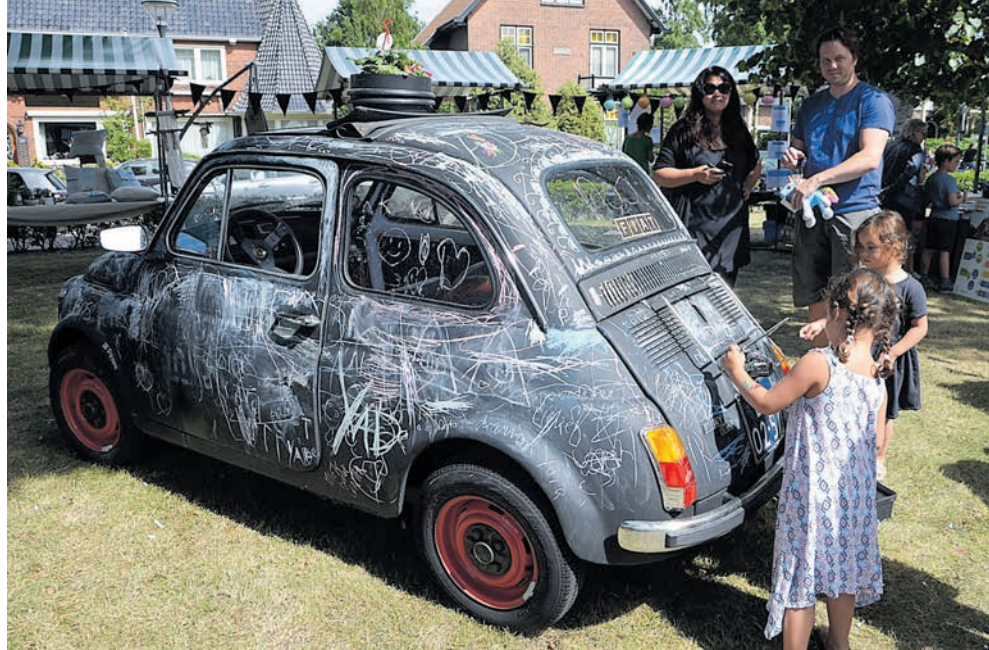
Oei, de Fiat van de burgemeester wordt ondergekalkt.