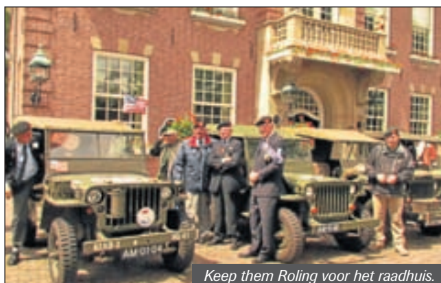
Keep them Rolling voor het raadhuis.