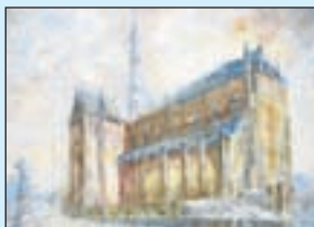
'De Grote Bavo' van Saskia Minoli, acryl op doek, 1.00x70 cm.