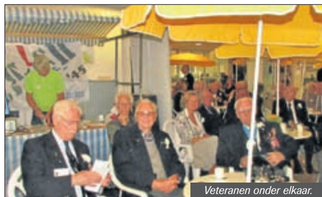
Veteranen onder elkaar.