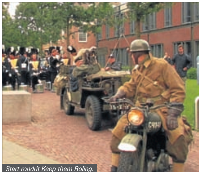
Start rondrit Keep them Rolling.