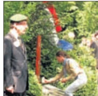
Scouting plaatst een kaars bij de gedenksteen.