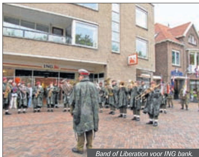
Band of Liberation voor ING bank.