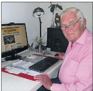
Bekend terrein: achter de computer.

voor de vuist weg kan schrijven is 'goud waard' voor de lokale krant.