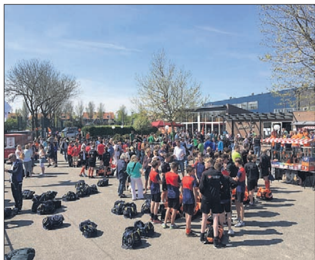
Aankomst van de spelers.

Voor meer informatie of reserveringen kunt u bellen naar: organisatieburo MIKKI, 0229-24 47 39/24 46 49. Of kijk op: www.mikki.nl .