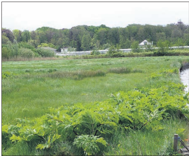
Het gebied met op de achtergrond de kassen die verdwijnen.

de rest als natuur in te richten. De 13 huizen werden er plots 20 op stukken grond van 1.000 m 2 . Een groep belanghebbenden, bewoners van de laan en de omgeving als ook de grondeigenaren gingen in gesprek. Deze groep wordt nu links en rechts ingehaald door het college. De historische vereniging zegde deelnam op. Bewoners uit De Linge verenigen zich in een actiegroep. Dit ondanks dat zij vertegenwoor-