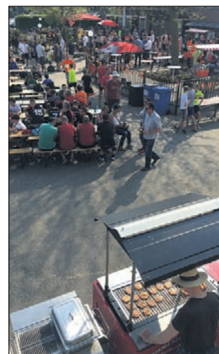
Afsluitende barbecue verzorgd door slagerij v/d Werff.

waarna de hele middag op zowel HBC als RCH gevoetbald werd. Op zaterdag 7 mei werd de rest van de 147 wedstrijden afgewerkt waarna de teams gehuldigd werden. Het toernooi werd afgesloten met een barbecue voor alle deelnemers en meer dan 100 vrijwilligers. Nogmaals dank aan alle vrijwilligers, want zonder hun had een toernooi van deze magnitude niet mogelijk geweest. Door de vele lovende woorden van de teams kan HBC als gastheer terugkijken op een geslaagd toernooi. Over twee jaar is er weer een IJT toernooi dat dan in Oost-Nederland zal plaatsvinden.