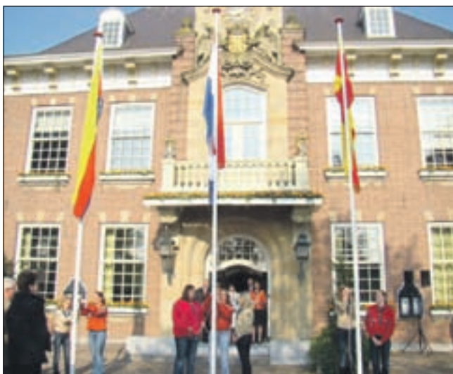
De dag begon zo mooi met de Wabo-scouts die de vlag hesen...

WWW.FIJNERWONEN.NL vandervlucht Tel. 023 538 22 77 SELECTWINDOWS