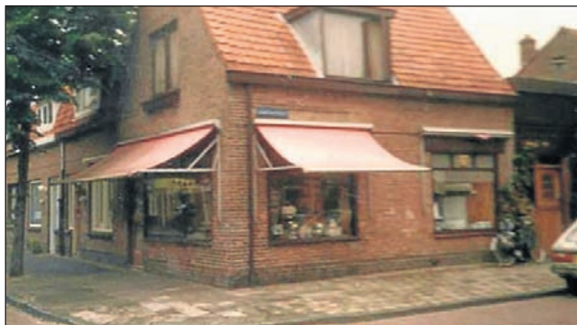
Borneostraat 23. Foto boven toen, foto beneden nu.

af 1928 was het een grammofoonhandel, in die tijd een 'boom- ing business'. In het jaar 1931