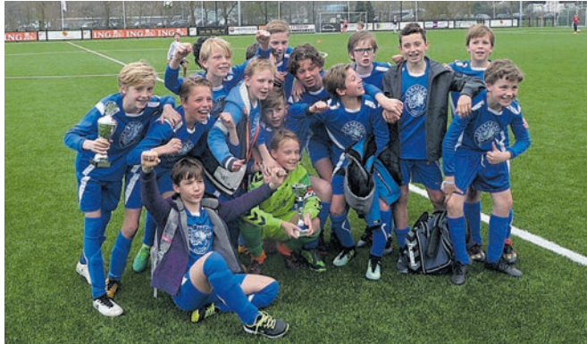
De jongens van de Jacobaschool werden eerste.

Heemstede - Dinsdag 10 april was het de finaledag van het jaarlijkse schoolvoetbaltoernooi in Heemstede. Vanaf een uur of vijf streden de jongens en de meisjes in eerste instantie in de halve finales om een plaats in de finale. Vooraf was de Bosch en Hoven school bij de jongens getipt als de grote favoriet. Het mocht niet zo zijn, want in de halve finale werd de ploeg met 1-0 aan de kant gezet door de grote concurrent, de Crayenster. De Jacobaschool bleek te sterk voor het tweede team van de Nicolaas Beetsschool.