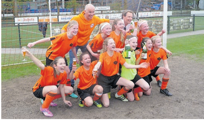
Winnaars bij de meisjes: Beatrixschool.