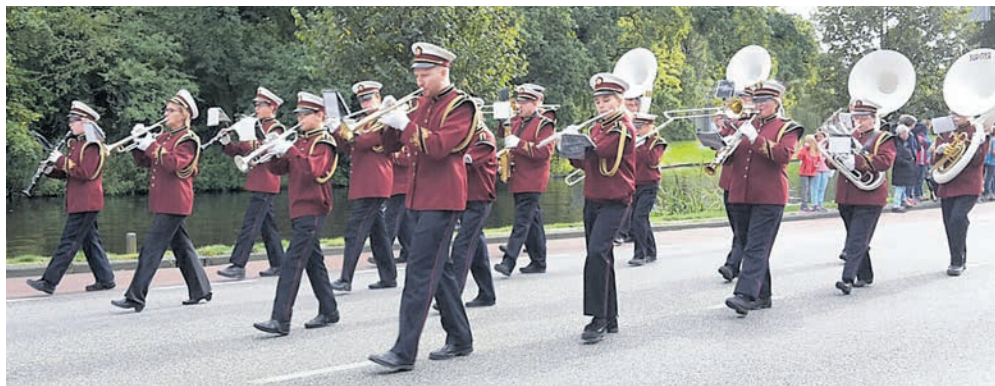
FSH en KNA in het traditionele uniform in 2016.