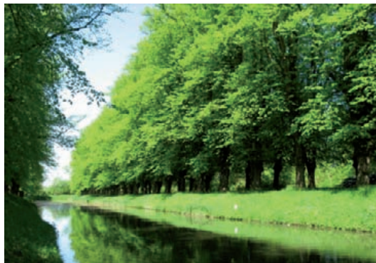
Optie 1: Alle (vier) rijen beplanten met bomen van één soort (beuk of linde).