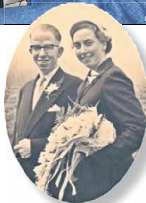
29 maart 1956

Zij maakte de foto en die toont dat de burgemeester het heel leuk vond om het diamanten bruidspaar een bezoek te brengen. Ze luisterde graag naar de verhalen. Leo