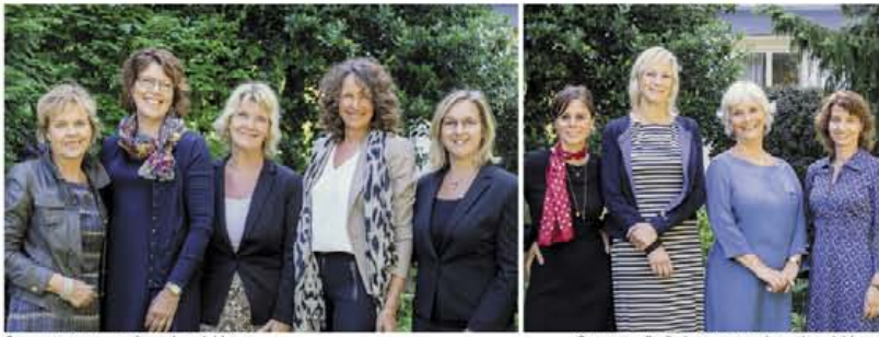
Ons vaste team van uitvaartbegeleiders

samen met u, luisterend, betrokken, stijlvol, voor iedereen, al dan niet verzekerd