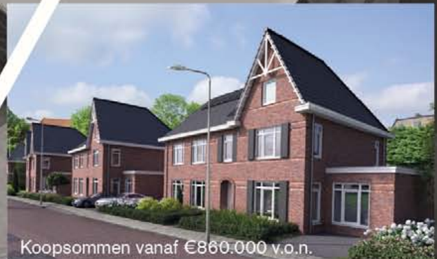
Koopsommen vanaf €860.000 v.o.n.

Op de bouwlocatie Lanckhorstlaan / Reinier van Holylaan te Heemstede