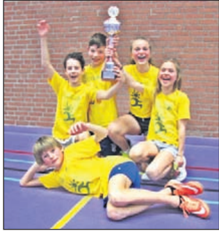
Winnaars van CMV-niveau 4 - De Flubberbananen van de Icarusschool.

len. Voor de leerlingen van groep 4-5 op CMV-niveau 2. Basis van dit niveau is het vangen en gooien van de bal over het net, waarbij de bal aan iedere kant maar 1x gespeeld mag worden. Wie een fout maakt moet uit het veld. Je krijgt pas een punt als alle spelers van de andere partij uit het veld zijn.