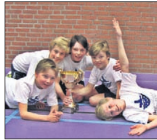
Winnaars van CMV-niveau 3 - Crayenster 1.

Zin om eens een keertje mee te doen, kom langs. De GSV CMV-jeugd traint iedere dinsdag van 15:45 - 17 uur in Sporthal Groenendaal.