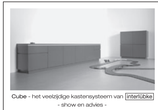
Cube - het veelzijdige kastensysteem van interlúbke