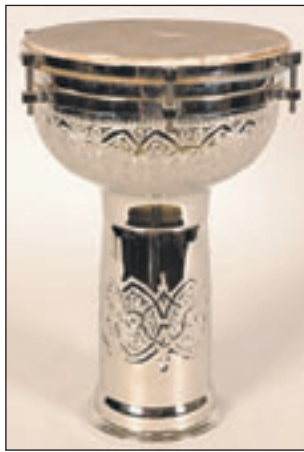
Deze mooi bewerkte darbuka is een vaastrommel die in het Andalusisch orkest de maat aangeeft. Verzilverd, geitenvel, 1970, Fès.

is voor kinderen vanaf 8 jaar en hun ouders. Kennis van de Arabische taal is niet nodig. Tijdens de workshop Arabische percussie maken de kinderen op een actieve manier kennis met Arabische ritmes. In deze workshop bespeelt elke deelnemer een darbuka. De darbuka (vaastrommel) wordt gebruikt in klassieke oriëntaalse muziek en in popmuziek. De workshop is voor kinderen vanaf 8 jaar. Een mu-