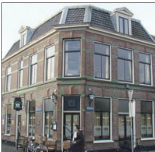
Raadhuisstraat 103 Het gebouw is van 1894. Het was eerst een slijterij en werd in 1912 verbouwd tot café en woonhuis. De naam: De Eerste Aanleg, verwijst naar de ligging nabij de Zandvaart en de Blekersvaart waar de schippers van de Zandvaart het eerst konden 'aanleggen'.

Op het Haemstedeplein zijn als monumenten aangemerkt: Haemstedeplein 2-42 en 1-43. Haemstedelaan 8-12 en 7-11, Eikenlaan 1-8 en Zandvaartkade 1-15 Het woning complex De Haemstede bestaat uit een aantal woonblokken met aaneengebouwde eengezinswoningen, geïnspireerd op de Engelse Tuinstad. Woningwetwoningen gebouwd in 1920-1921 met een ambachtelijke expressionistische baksteenarchitectuur die bekend staat als Amsterdamse School.