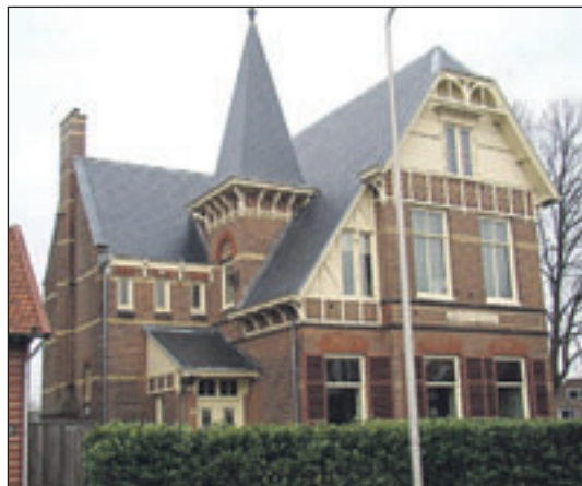
Herenweg 143 Villa 'Stella Duce' met dezelfde kenmerken als Herenweg 135.

Herenweg 141 De kerk is gebouwd in 1930 in opdracht van de Vergadering van Gelovigen op de luifelrand staat met koperen letters: 's Herenweg.