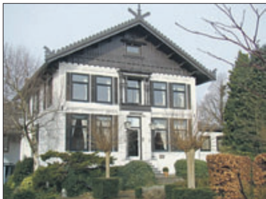
Bronsteeweg 49 Rond 1870 gebouwd in chaletstijl. Later bekend geworden als 'Gramophone House'.

Blekersvaartweg 23 De gebouwtjes dateren uit de 17de en 18de eeuw. Een deel deed rond 1650 dienst als bakkerij voor de blekerijen in de omgeving. Een bakkersoven en rijkskast zijn nog gedeeltelijk intact.