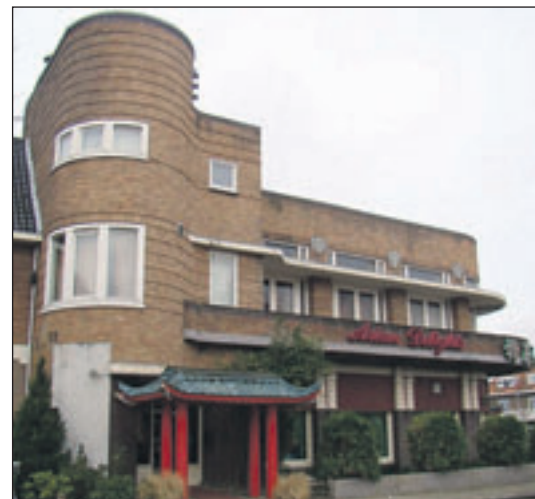
Roemer Visscherplein 25 Oorspronkelijk Hotel Boekenrode, gebouwd in 1928 met stijlmerken van de Amsterdamse School. Nu Chinees-Indisch Restaurant Asian Delight.

Voorweg 24 De Voorwegschool dateert in zijn huidige vorm uit 1882 maar heeft een kern uit 1630. De oudste nog bestaande basisschool op dezelfde plaats in Nederland.