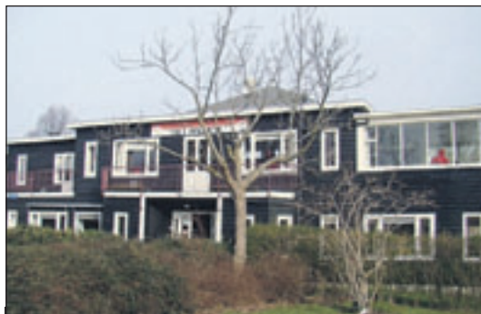
Marisplein 5 Een houten botenhuis uit 1926, gebouwd in opdracht van de Koninklijke Roei- en zeilvereniging 'Het Spaarne'.

Julianaplein 1 De voormalige Dreefschool in 1930 gebouwd in de Amsterdamse School verwante bouwstijl. Let eens op de entree met een sculptuur van een kind met bal en boek en aan de voet een uil en vogel met het gemeentewapen van Heemstede.