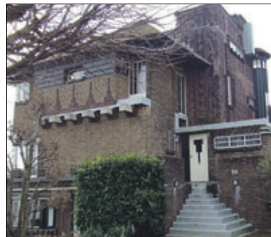
Tooropkade 1 Villa aan het Spaarne, gebouwd in 1930, heeft vanwege de torenachtige opbouwen, hoge trappen, veel versieringen en ornamenten een geheimzinnige uitstraling.

Sportparklaan 6 Het clubhuis van RCH uit 1932-1933. Een strakke, elementaire opbouw met forse overstekken.