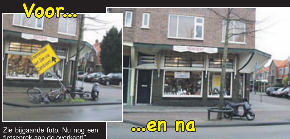
Zie bijgaande foto. Nu nog een fietsenrek aan de overkant!"

"Veel dank voor het plaatsen van onze foto en ons verhaal-tje erbij. Het had meteen resultaat: dezelfde dag nog was het bord weg, en een week later waren ook de fietsen verdwenen!