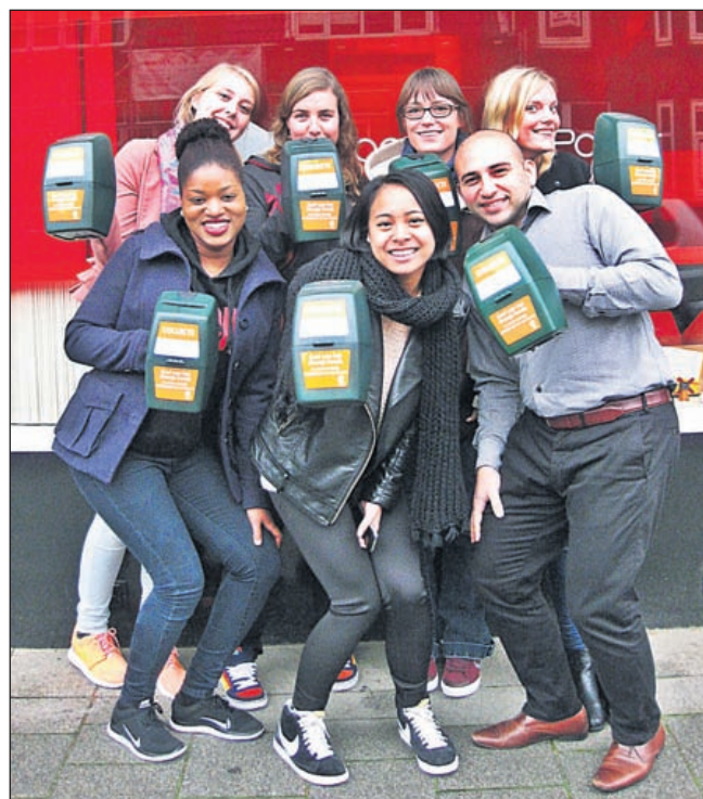
Oranje Fonds / Hoedje van Papier.

Het Oranje Fonds steunt sociale initiatieven in Nederland. Het gaat om initiatieven die ervoor zorgen dat mensen elkaar ontmoeten, minder eenzaam zijn, begrip krijgen voor elkaar en zich inzetten voor een ander. Koning Willem-Alexander en Koningin Máxima zijn als bescherm-paar nauw betrokken bij het Fonds.