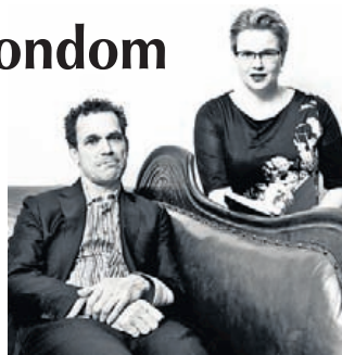
De Luifel, Herenweg 96, Heemstede, Aanvang: 20.15 uur. Kaartverkoop: 023 - 548 38 38.