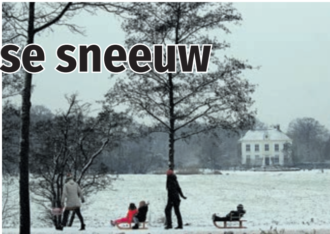
Het kon weer: op de slee van school naar huis. En met Ipenrode (Herenweg) op de achtergrond, levert dat een mooie winterfoto op. (Marianne Wever).