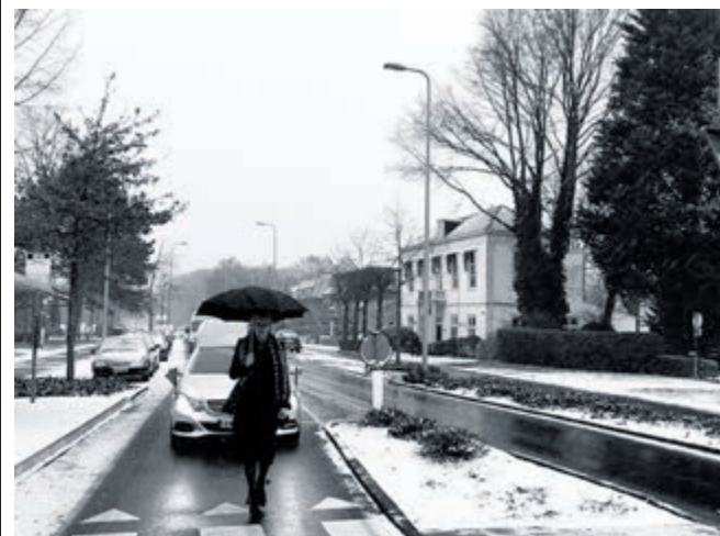
Stemmig: Begrafenisstoet in de sneeuw (Eveline Trossèl).