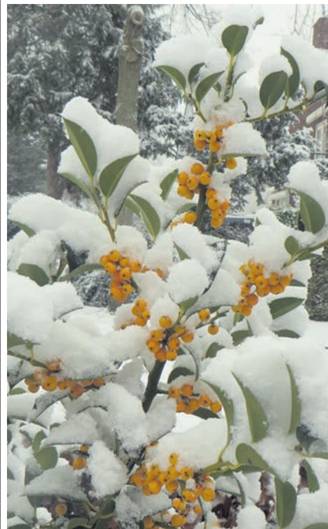
Een kerstkaart, deze besjes, beter gezegd: Ilex Bacciflora (Jeanine van Ooijen)