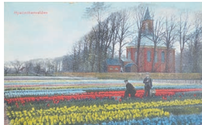
Bollenvelden op het voormalige terrein van hofstede Middendorp aan de Binnenweg in Bennebroek. Op de achtergrond de Nederlands-hervormde kerk.

Info: Organisatieburo Mikki, 0229-244739/244649, www.mikki.nl .