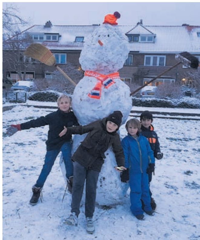
Op het Rhododendronplein stond vorige week deze hele grote, vrolijke sneeuwpop, gebouwd door kinderen (en volwassenen) uit de buurt.