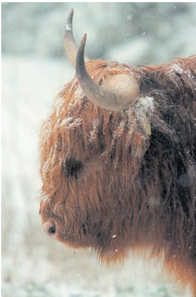
Als fervent natuurfotograaf kon Klaas de Vries afgelopen dinsdag zijn hart ophalen bij de hooglanders in het weiland bij de Vrijheidsdreef. Samen met de sneeuw een prachtig (oer)beeld.