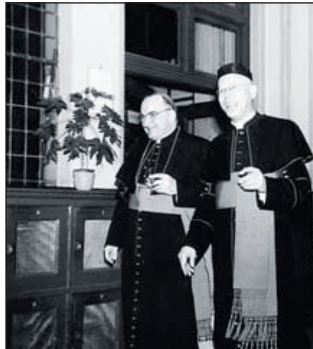
Aandacht voor jubilea dit jaar zoals 200 jaar Hageveld.