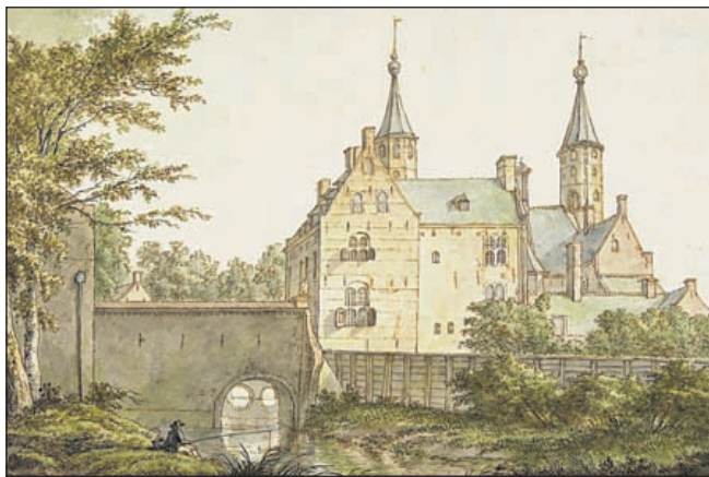
Niet op alle kunstwerken uit vervlogen tijd klopte het beeld met de werkelijkheid.

Meer info op www.hv-hb.nl . Losse nummers van HeerlijkHeden kosten 4,95 euro, verkrijgbaar bij de boekhandels.