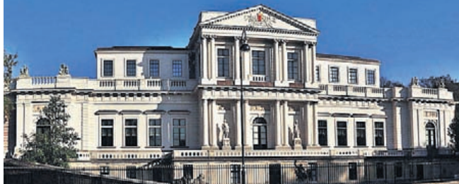
Paviljoen in Haarlem.

Op vrijdag 29 januari is de tentoonstelling 'The girl next door' geopend in Paviljoen Welgelegen in Haarlem. Onder invloed van de media, reclame, sociale media, blogs en vlogs lijken we te leven in een wereld waarin alles draait om uiterlijk, schoonheid en perfectie. De nieuwe Dreefexpositie 'The Girl next door' gaat daarentegen over het meisje dat mooi is, maar niet kunstmatig of onbereikbaar. Het gaat om 'buurmeisjes' die aantrekkelijk, gewoon en natuurlijk zijn. Waarbij het vooral gaat om de uitstraling en 'power' in plaats van de uiterlijke schoonheid.