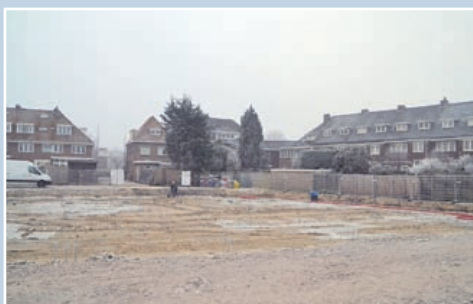
De haven vroom voor het eerst deze winter dicht. Desondanks wordt hard gewerkt aan het plaatsen van de bekisting voor de fundering op de Havendreef.