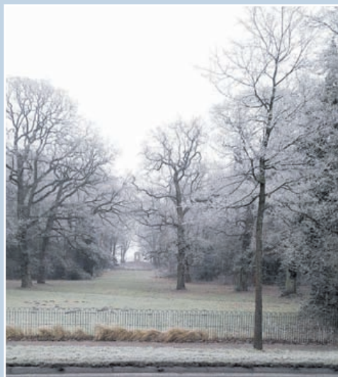
Winterse Overplaats.