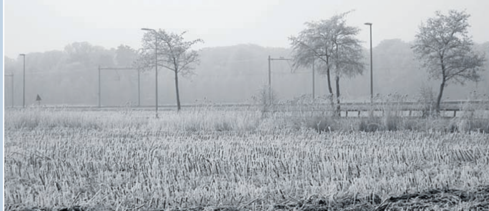
Marenka Groenhuijzen richtte haar lens op het spoor aan de Leidsevaart. Prachtig winterse aanblik.

Heemstede - Omdat de rijp van vorige week zoveel mooie plaatjes opleverde drukt de Heemsteder er meerdere af. Deze keer dus niet één winterfoto van Marenka Groenhuijzen maar meerdere inzendingen. Geniet!