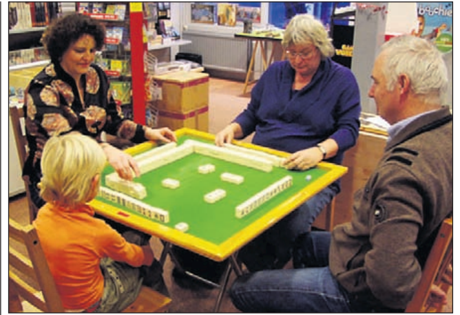
Mahjong, boeiend voor jong en ouder.

Heemstede - Vrijdag 22 januari kun je een superplexat-avond beleven! Leuke casinospellen voor iedereen vanaf 10 jaar! Neem al je vrienden mee! Het is van 20.00 tot 22.00 uur aan de Herenweg 96, Heemstede. Entree: 2,- euro.