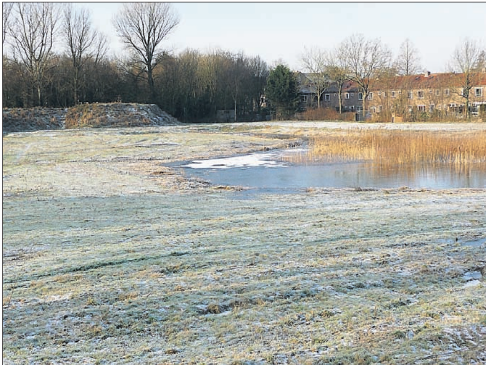
Verrijst hier een grote supermarkt?