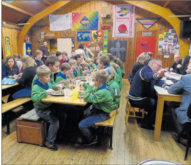
Scouting Graaf Bernadotte.