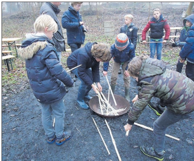
Scouting St. Paschalis Baylon.