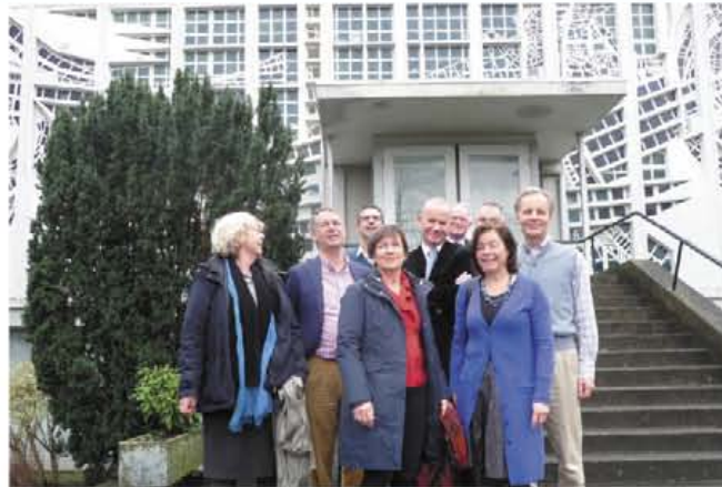
De leden van de Heemstedse kerkenraad wensen iedereen in Heemstede een goed 2016.

een druk bezochte bijeenkomst in het Raadhuis afgelopen september. In samenwerking met de gemeente en hulporganisaties zorgen betrok-