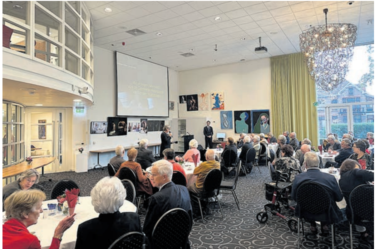
De 50-jarige bruidsparen in de Burgerzaal.

De middag werd afgesloten met een drankje en geanimeerde gesprekken, maar niet voordat de hele groep op