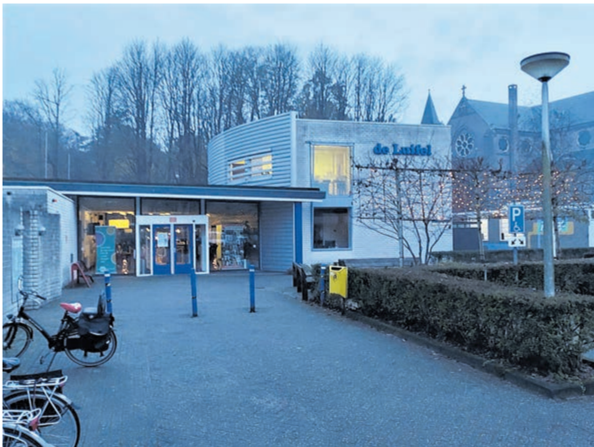
Het huidige pand van de Luifel aan de Herenweg.

Opmerkelijk, omdat er nog steeds een proces gaande is tussen de ontwikkelaar en de gemeente over de monumentenstatus. Boeder CDA vroeg hoe het stond met het advies van de bezwaarschriftencommissie. Het oordeel van de commissie is al op 27 oktober uitgebracht en nu in het bezit van het college en de belanghebbenden. Wethouder Stam kon Boeder niet aan een verhelderend antwoord helpen. Het college moet eerst een standpunt bepalen. Dit om tot een afweging te komen wat het college verder aan moet met deze kwestie en zijn er externe juristen ingeschakeld. Als de bezwaarschriftencommissie had besloten de gemeente in het gelijk te stellen, was het advies al naar buiten gekomen. Dan was het aan de ontwikkelaar om vervolgstappen te nemen. Men mag dus aannemen dat het college in het ongelijk is gesteld.