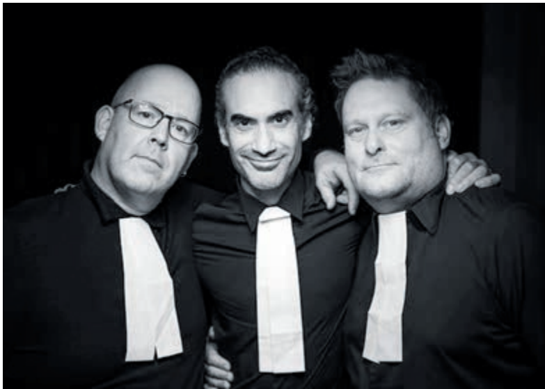
The Preacher Men.

Informatie en kaarten: www.podiaheemstede.nl .