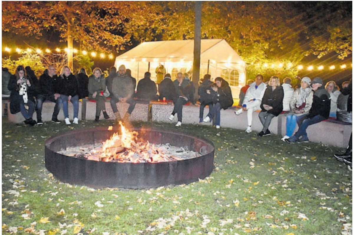
Sfeervol ontstoken vuur op Lichtjesavond.

*Noot: De tekst van dominee Terpstra is vrij geïnterpreteerd door de correspondent. (Redactie)