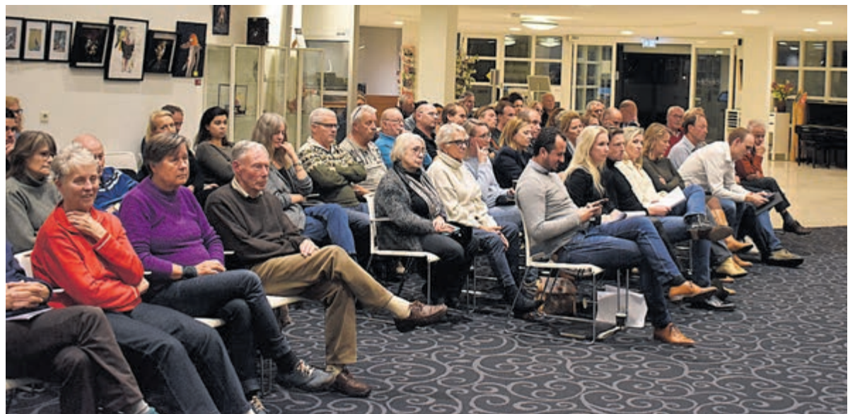
Een volle burgerzaal met boze burgers.