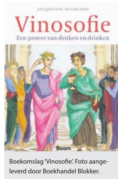
Boekomslag 'Vinosofie'.