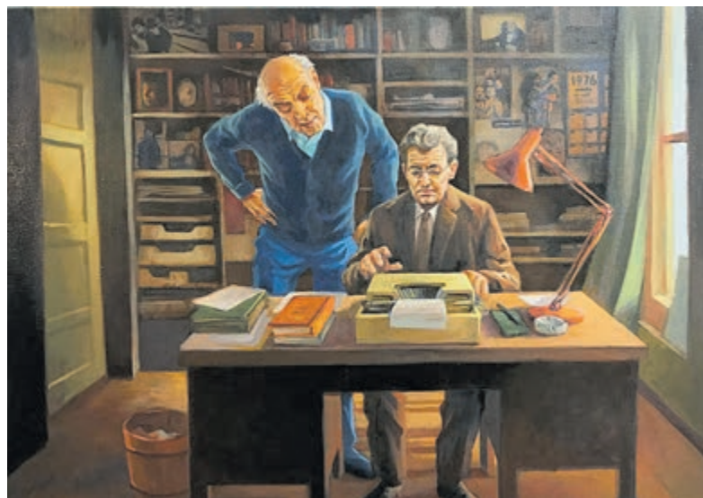
Schilderij met Carmiggelt achter de schrijfmachine.

Informatie en kaarten à €18,50 via www.podiaheemstede.nl . De geldende RIVM/coronamaatregelen worden in acht genomen.