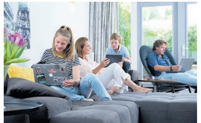
Sneller internet door glasvezelaansluiting.

Meer informatie op de website gavooglasvezel.nl , waar eveneens een postcodecheck gedaan worden om te zien of het adres in aanmerking komt voor het aanbod.