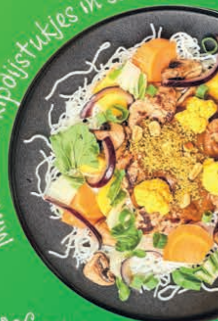
Milhoen met kipdijstukjes in satésaus