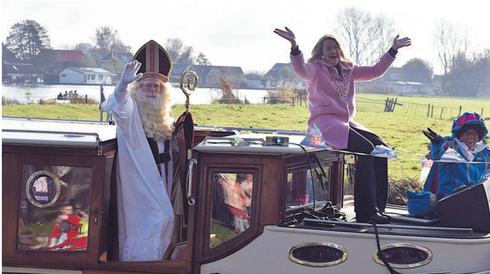
Sint komt aan in Heemstede aan.