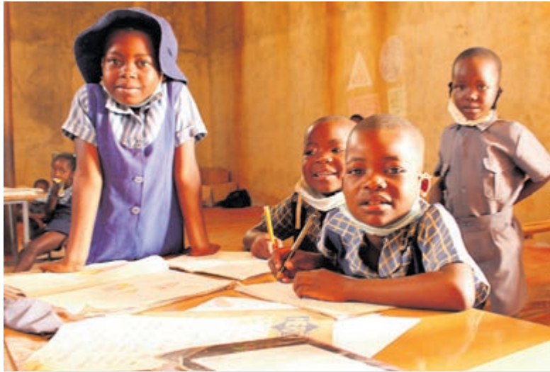
Leerlingen van de school die Tuincentrum De Oosteinde ondersteunt in Zimbabwe.

Met hulp van goede doelen is ook een waterput bij het schooltje gerealiseerd. Binnenkort wordt er ook een moestuin aangelegd. Ook heeft De Oosteinde een bijdrage gegeven voor schoentjes voor de kinderen. Er zijn namelijk kinderen die kilometers op blote voetjes moeten lopen om bij de school te komen. De schoen-