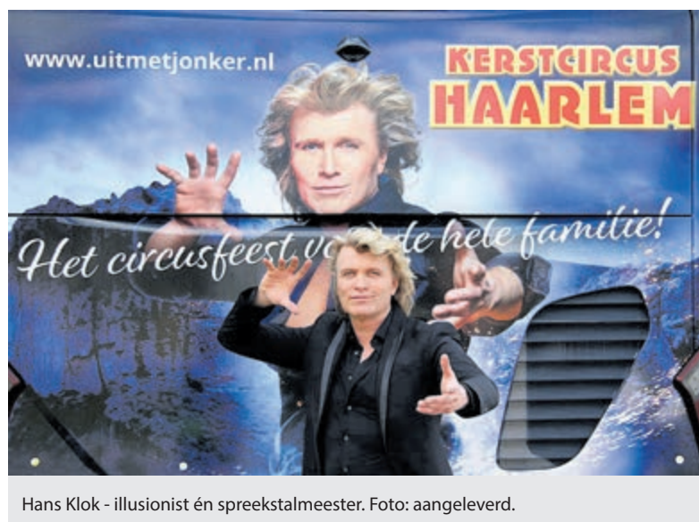
Hans Klok - illusionist én spreekstalmeester.

Tussen een keur aan internationale circusartiesten zal Hans met behulp van zijn knappe assistentes verbluffend verdwijnen en verschijnen: "Met publiek rondom is circus altijd weer het meest uitdagende podium", vertelt de winnaar van de Zilveren