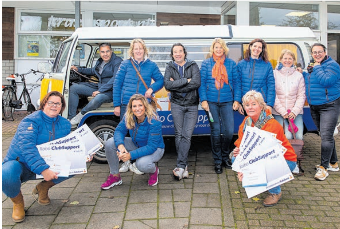
Rabo ClubSupport.