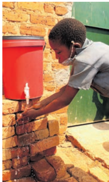
De waterput.

Op zondag 21 november staat het ondersteuningsteam voor Zimbabwe in Tuincentrum De Oosteinde aan de Zandlaan 22 in Hillegom en worden leuke sleutelhangers en "Happy Stones" verkocht voor een klein bedrag. Leuk cadeautje voor Sinterklaas of de Kerst. De opbrengst van de verkoop gaat uiteraard volledig naar het schooltje in Zimbabwe.