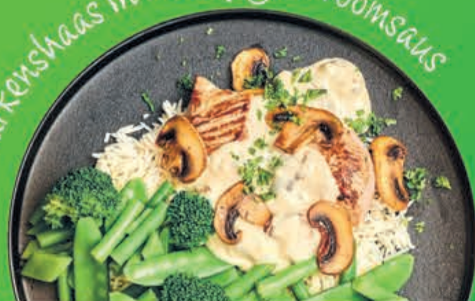
Varkenshaas in champignonroomsaus