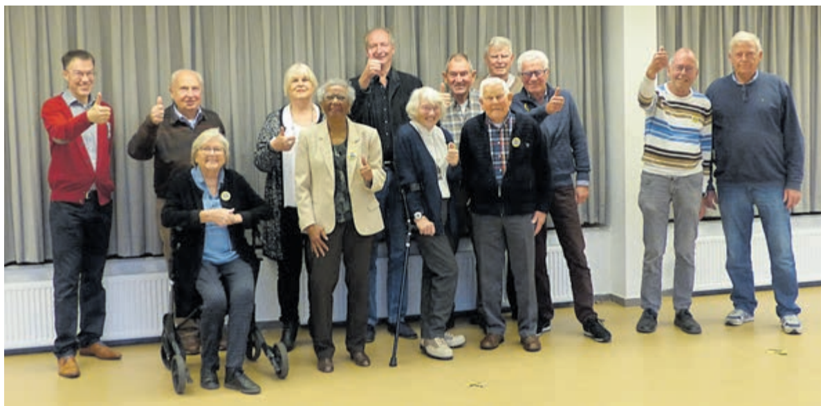
De jubilarissen van GSV.

Gezien over de volle 90 minuten had de score nog veel hoger kunnen uitvallen als alle kansen waren benut. HBC uiteraard heel tevreden met deze uitslag. Voor Schoten is er nog voldoende werk aan de winkel. Met een tiende plaats komt de staart van de ranglijst dichterbij. HBC staat op plek twee met evenveel verliespunten als SV DIOS dat echter een wedstrijd meer heeft gespeeld. Zondag 21 november speelt HBC uit tegen ditzelfde SV DIOS het duel om de koppositie en zicht op een mogelijk kampioenschap.