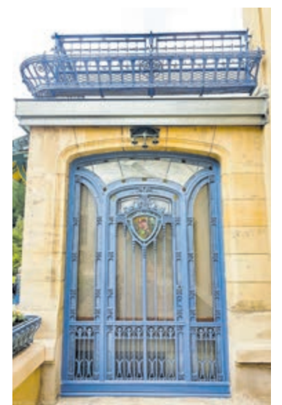
L'École de Nancy.

Barbara vertelt over L'Art Nouveau in het algemeen, over L'École de Nancy en haar kunstenaar, en maakt met u een virtuele wandeling door de