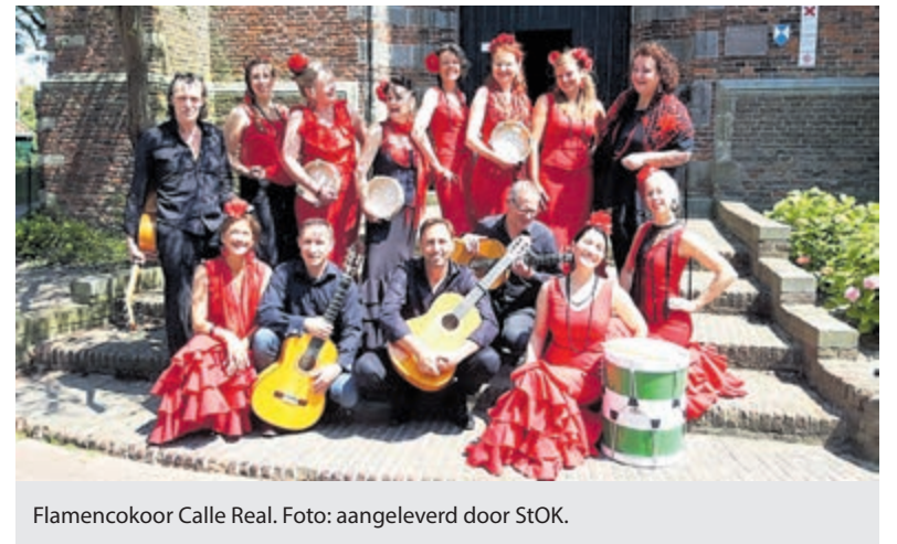
Flamencokoor Calle Real.

ressen en wordt begeleid door drie gitaristen. Hun repertoire bestaat uit fandangos, een stijl uit de streek rond Huelva (Zuid-West Spanje) en sevillanas, een zang- en dansvorm uit Sevilla en omgeving. Bij enkele sevillanas zal ook gedanst worden. En met het oog op de naderende Kersttijd zal het koor ook enkele villancicos (kerstliederen) laten horen. De kosten zijn €15,- pp, Meer mag natuurlijk ook. U kunt zich aanmelden door uw bijdrage over te maken op rekeningnummer: NL 81 ABNA 0563240563 ten name van Stichting Vrienden Oude Kerk te Heemstede o.v.v. concert Calle Real. U kunt ook aan de zaal betalen (pinnen of gepast contant), maar meld u dan wel van tevoren aan bij secretaris@oudekerkheemstede.nl . Neem uw QR-code of testbewijs en mondkapje mee en houd afstand. Het aantal zitplaatsen is door de coronaregels beperkt.