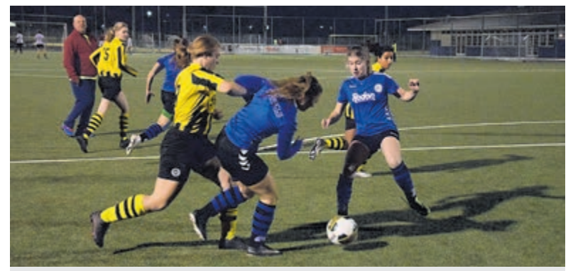
Het damesteam van RCH gaat voortvarend te werk.

De laatste wedstrijd was tegen DSS, deze avond al tweemaal winst en in de eerdere rondes ook alle wedstrijden gewonnen. Ze konden met deze wedstrijd dus ongeslagen kampioen worden. Onze dames hadden wel ontzag voor hun goed voetballende tegenstanders, maar ook nu kwam RCH op voorsprong. Met een schot van 10 meter wist DSS weer gelijk te trekken, maar daarna hielden beide ploegen elkaar goed in bedwang en eindigde het in een 1-1, min of meer een overwinning van de RCH dames.