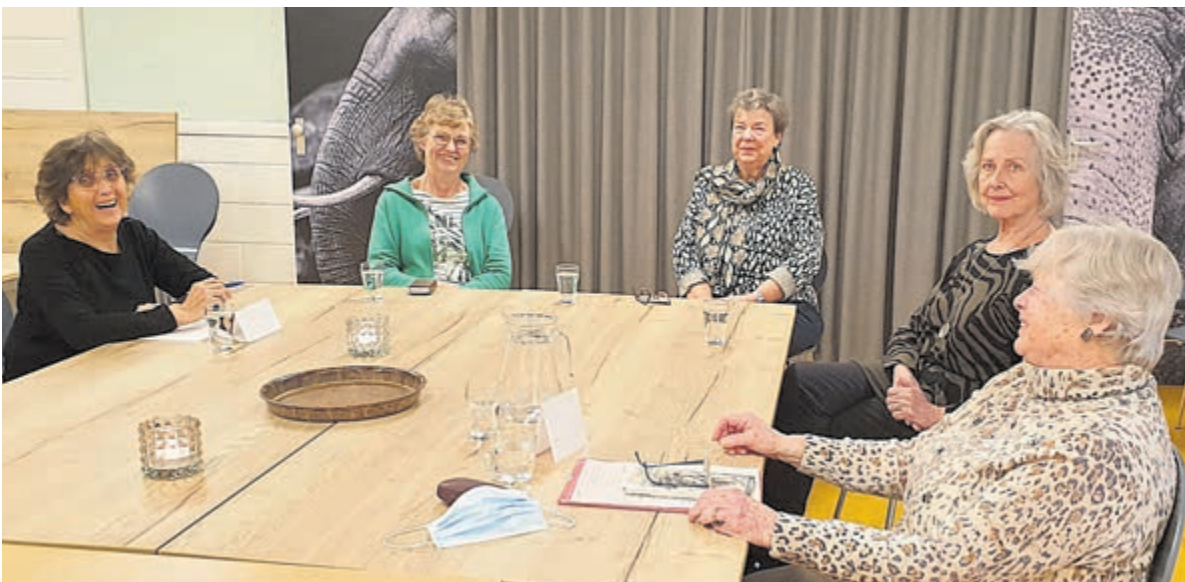
Een bijeenkomst van de Vriendinnenclub in de Luifel.