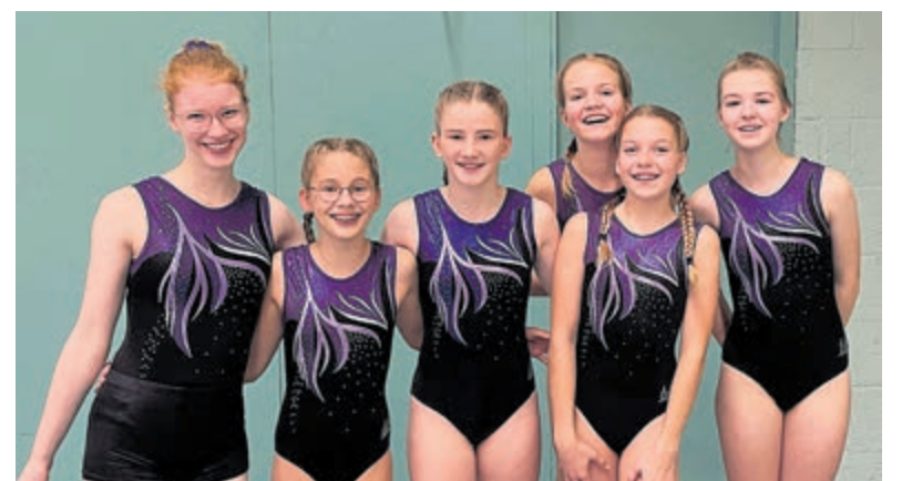
De wedstrijdturnsters van HBC Gymnastics.

Over twee weken zijn de jongere turnsters van HBC aan de beurt voor hun eerste teamwedstrijd met individuele prijsuitslagen.