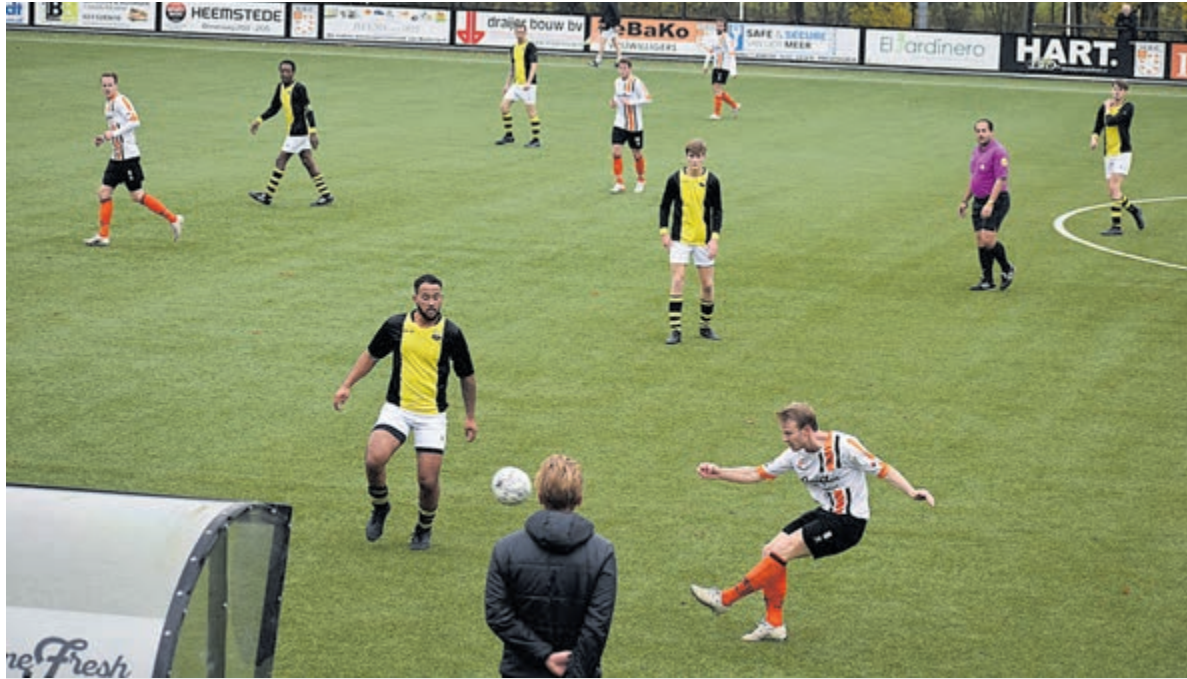
De wedstrijd HBC versus VV Schoten. Foto: Eric van Westerloo.