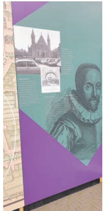
Het renovatiebord op het Binnenhof.