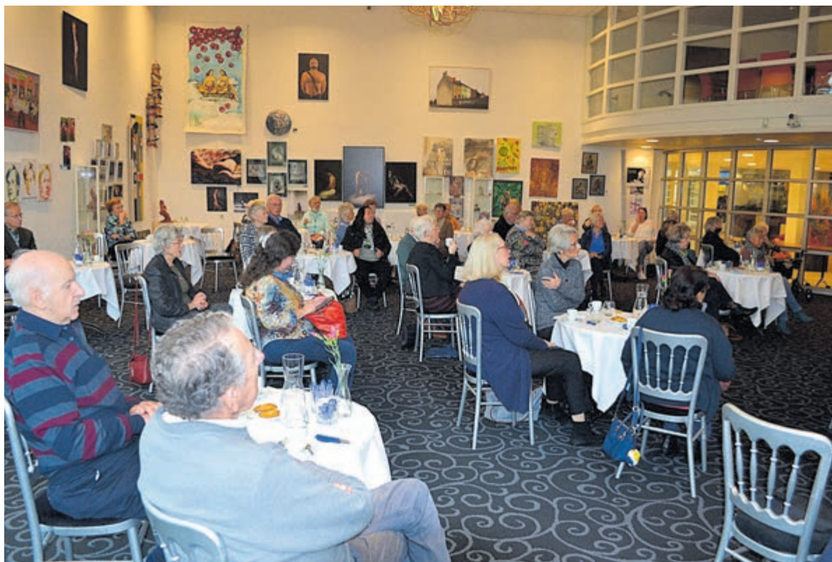
De mantelzorgers genieten geboeid van het programma in de Burgerzaal.