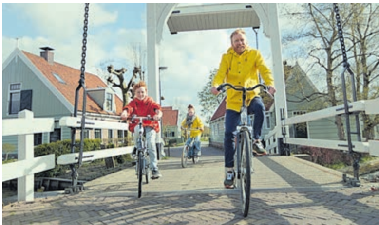
Fietsen is ook een goede manier van bewegen om je weerstand te versterken.

Regelmatig wandelen is goed voor je. Dus hup: strek die benen! Lastig?