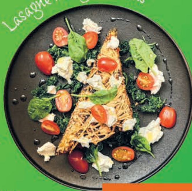
Lasagne met geitenkaas