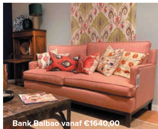
Bank Balbao vanaf €1640,00