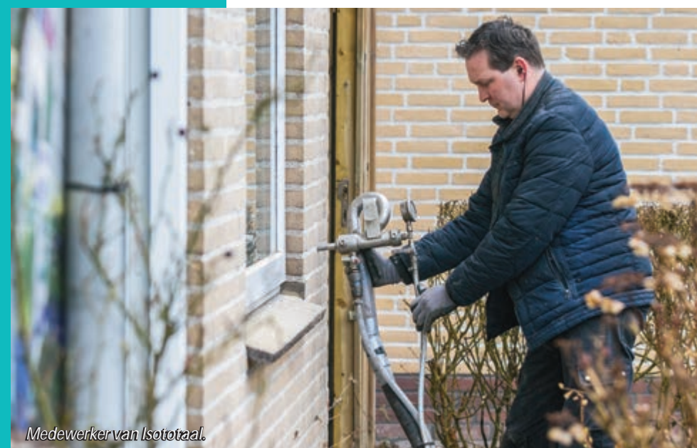
Medewerker van Isototaal.

De subsidieregeling geldt tot en met 31 december 2020, maar eindigt eerder wanneer het totaal beschikbare bedrag benut is. Voor verenigingen van eigenaren geldt een aparte regeling, die doorloopt tot eind 2022.