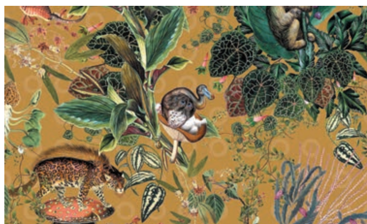
Een voorbeeld van een bijzondere muurbekleding is Extinct Animals van Moooi via Arte. Deze muurbekledingen zijn geïnspireerd door Moooi's Museum of Extinct Animals.

De tijd dat behang oubollig is, is helemaal voorbij. Steeds meer zien we de meest uiteenlopende patronen en dessins voorbij komen. In veel horeca gelegenheden en (boutique) hotels kun je genieten van mooie, retro, stoere, luxe sferen en dat alles door het grootste meubelstuk in je interieur: de wanden. Maar waarom zou je zo'n uitgesproken wand ook niet gewoon toepassen in je eigen woning? Wat te denken van bijvoorbeeld een te gekke print op de wand achter je bed of gewoon een statement maken in de living? De keuze is tegenwoordig enorm.