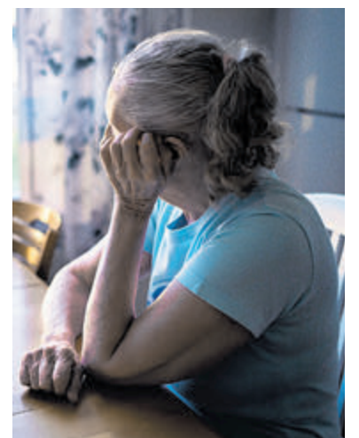
Overwin uw eenzaamheid.

Aansluitend bij de landelijke actie 'Eén tegen eenzaamheid' heeft de gemeente Bloemendaal een werkgroep die actief probeert de eenzaamheid onder ouderen in de vijf dorpen te verminderen. De training Heft in Eigen Handen is voor het