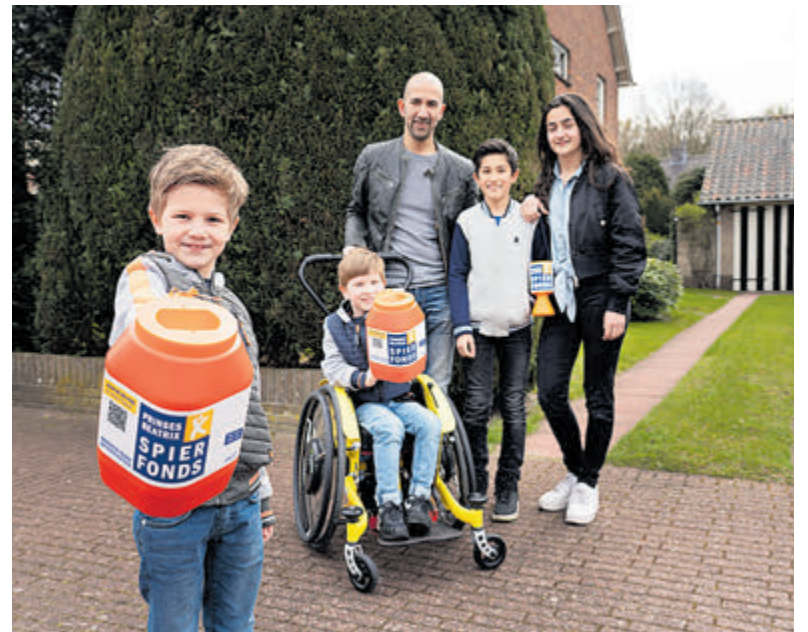
De familie Kuijs collecteert met het hele gezin.

kelen van behandelingen en medicijnen om spierziekten te stoppen. Er is afgelopen jaren veel geïnvesteerd in wetenschappelijk onderzoek - hoe ziet een spierziekte eruit, hoe kun je deze herkennen, waar zit het foutje? Na tientallen jaren van samenwerken met briljante onderzoekers in Nederland en wereldwijd, is te zien dat de stromen samenkomen. Want wat jarenlang onmogelijk leek, wordt nu steeds concreter. Gentherapie, één van de speerpunten van het Spierfonds, is in ontwikkeling en voor verschillende spierziekten komen medicijnen beschikbaar. In 2025 wil het Spierfonds de eerste gentherapie bij patiënten testen. Samen kunnen we het verschil maken in de levens van mensen met een spierziekte.