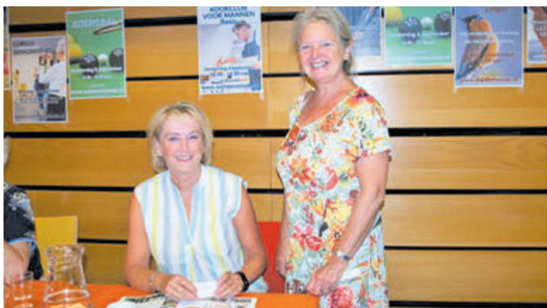
Open Dag WIJ Heemstede in 2022.

alles wat zij doen. Er zijn korte gratis workshops waar u aan mee kunt doen, de docenten van veel cursussen zijn aanwezig om al uw vragen te beantwoorden. Naast het organiseren van cursussen en ontmoetingsactiviteiten is er een maandelijks programma van lezingen, workshops en films, u kunt de nieuwe nieuwsbrief meteen mee nemen! En natuurlijk is er koffie of thee met iets lekkers. Komt u ook op 8 september? Voor meer informatie over WIJ Heemstede kunt u ook kijken op www.wijheemstede.nl .