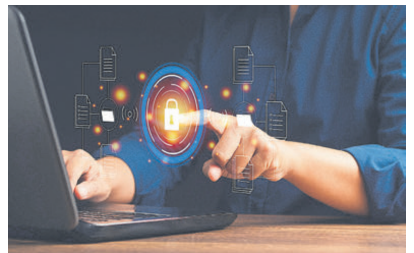
Dunweg, uw digitale kluis.