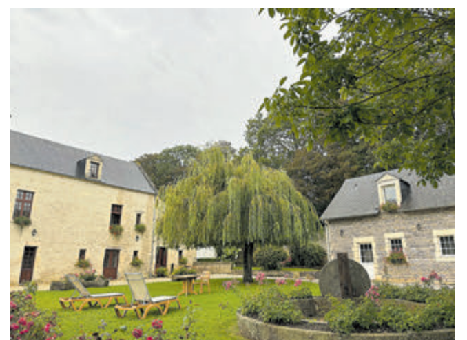
Tot rust komen in een monhoir, hoeve/boerderij, omgebouwd tot hotel.