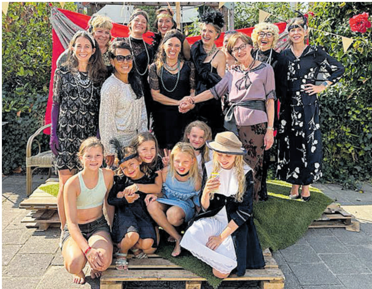
Vrolijke Roaring Twentiestaferelen in Laan van Bloemenhove.