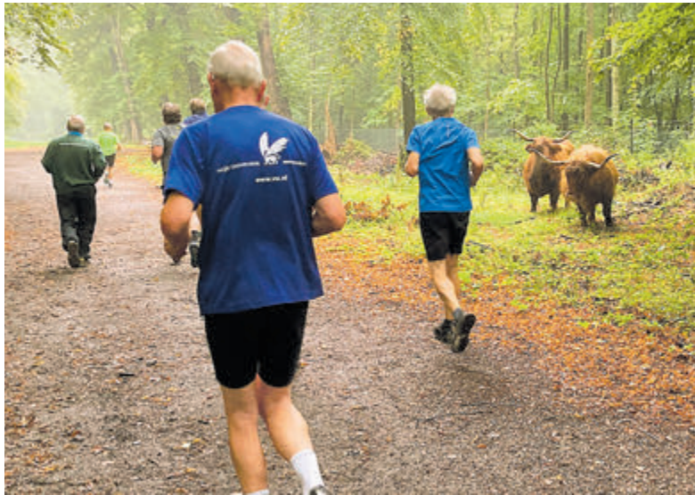
Schotse Hooglanders volgens de trimmers met verbazing.

Wellicht komt het door het vroege uur, van 8 tot 9 uur op de zaterdagochtend in het wandelbos Groenendaal, maar dames, en ook heren, het is dan erg rustig in het bos. Geen last van tegenliggers en u kunt al vroeg genieten van de fraaie natuur om u heen. De tegenliggers afgelopen zaterdag waren een paar rustig grazende Schotse Hooglanders.