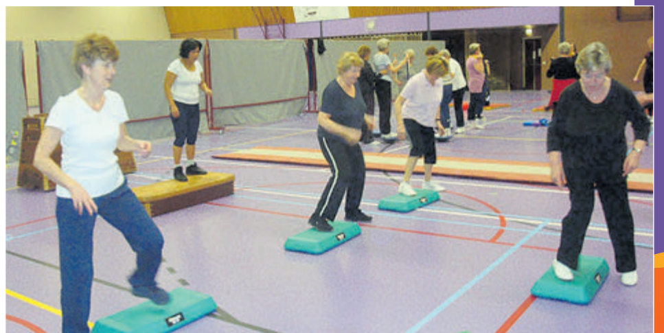
Lekker bewegen met HBC Gymnastics.

Kijk voor alle lessen met het volledige lesrooster op de site: hbcgymnastics.nl en kom in beweging!