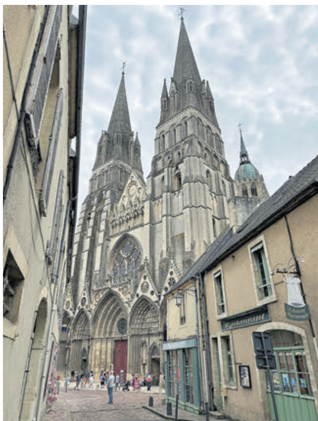
De kathedraal van Bayeux.