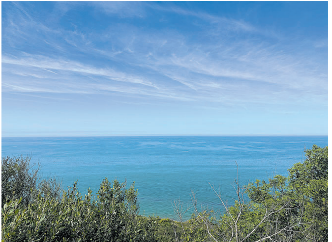
Uitzicht op zee verveelt nooit.

Het bekendste invasiestrand is Omaha Beach maar wie verder rijdt helemaal naar het noorden (Étretat) komt de mooiste rotskusten van de regio tegen, de krijtotsen die al eeuwen in trek zijn bij kunstenaars. Een andere noemenswaardige plaats is Honfleur. Wie gezelligheid – het is een trekpleister voor dagjesmensen – graag combineert met schilderachtige oude architectuur is hier op zijn plek. Handig gevonden is de ruime parkeerplaatsen net buiten het dorp, zodat je te voet verder kunt. Honfleur heeft een keur aan bistrotjes en andere knusse restau-