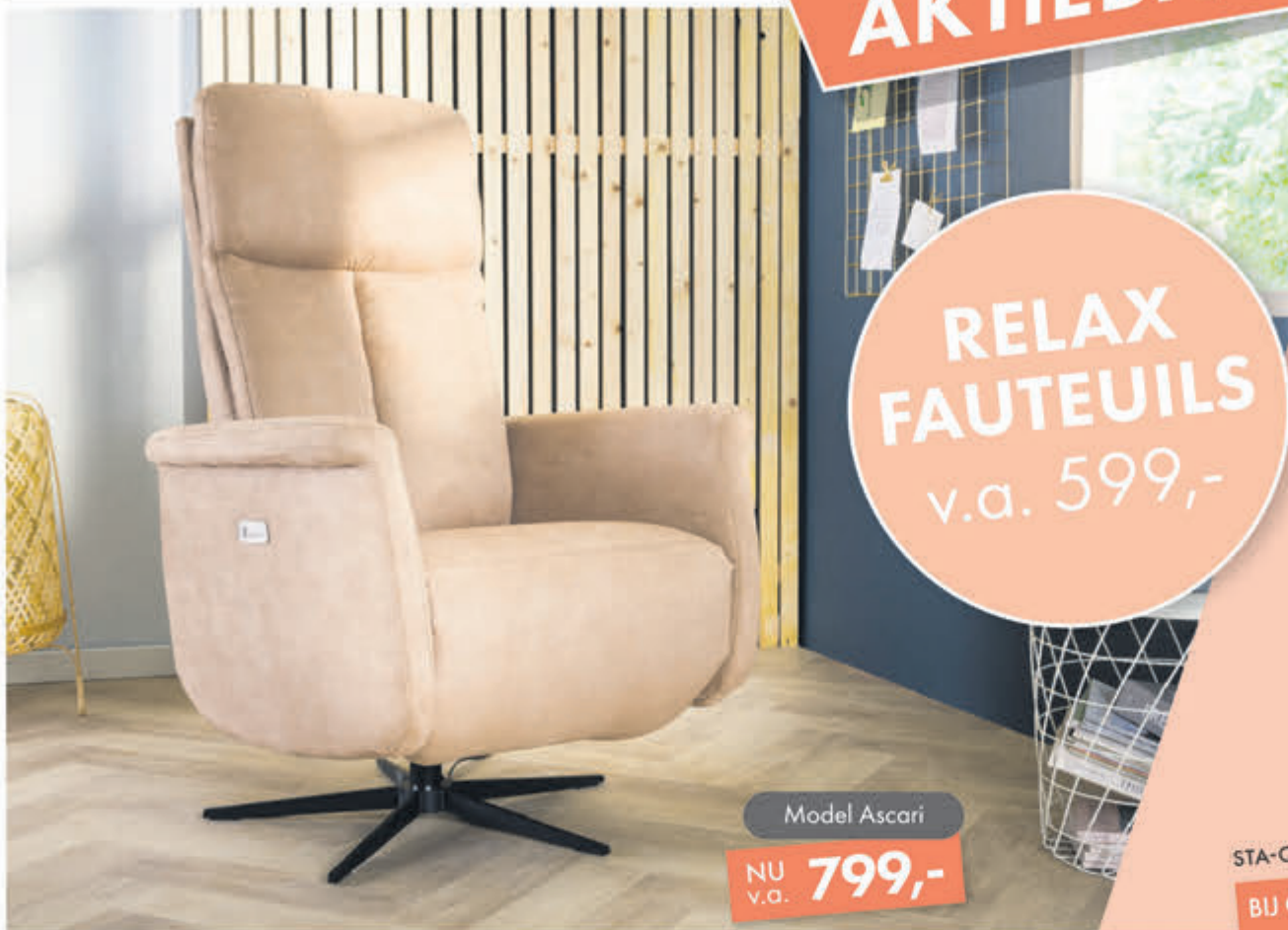
Model Ascari NU v.o. 799,-