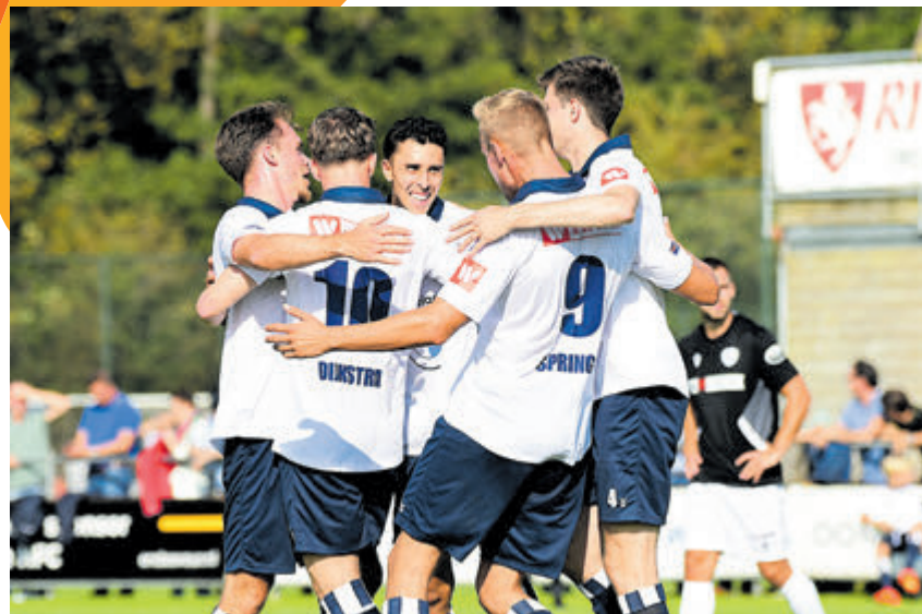
HFC wint van Spakenburg.