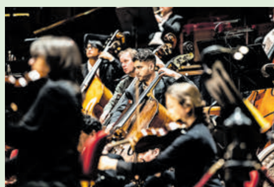
Nederlands Philharmonisch Orkest.

De winnaar wordt in de krant van woensdag 13 september bekendgemaakt. Over de uitslag wordt niet gecorrespondeerd. Succes! Meer informatie over het slotcon-