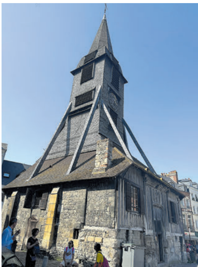
De grootste houten kerk van Frankrijk met losstaande kerktoren.