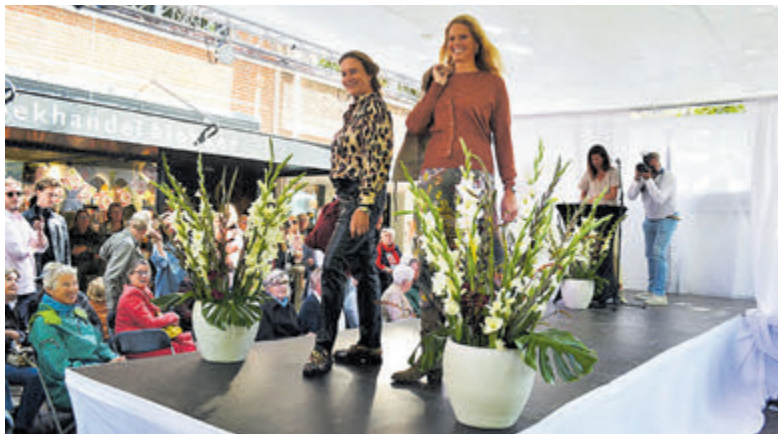
Fashion & Bites in 2022.

Heeft u belangstelling voor mode en de laatste trends? Unieke Heem-