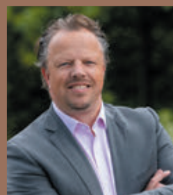
Alexander van der Pijl Dunweg Uitvaartzorg