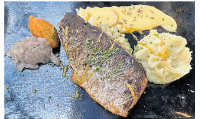
Lokale specialiteiten uit zee, hier zeebaars.

Een andere leuke bezigheid in dit gebied is het uitproberen van de typische lekkernijen. Te beginnen bij Calvados, een van de kuststreken van Normandië. Cider is een belangrijke basis voor deze digestieve met een alcoholpercentage van 40 tot 45%. Het wordt ook wel met vanille-ijs gecombineerd in een dessert. Andere specialiteiten zijn oesters, mosselen dus en diverse kazen als camembert, waarvan je niet gek op moet kijken als ze op de ontbijt tafel liggen. Kaasliefhebbers kunnen hun lol op, naast vislekkerbekken maar ook de vleeseters komen aan hun gerief. Eend en konijn, varken of rund maar bijvoorbeeld ook 'andouillette d'Alençon' (warm worstje van ingewandsvlees). Het is een leuk onderdeel van de vakantie: proeven van de streekgerechten, bijna nét zo leuk als het landschap en de dorpjes ontdekken. Alleen zo ontdek je de historie die Normandië prijsgeeft en die omvat veel meer dan de invasiestranden alleen.