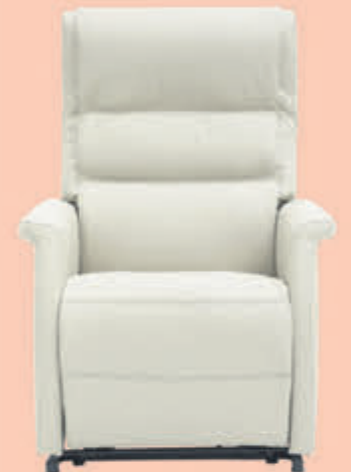
BIJ ONS v.o. 1399,-