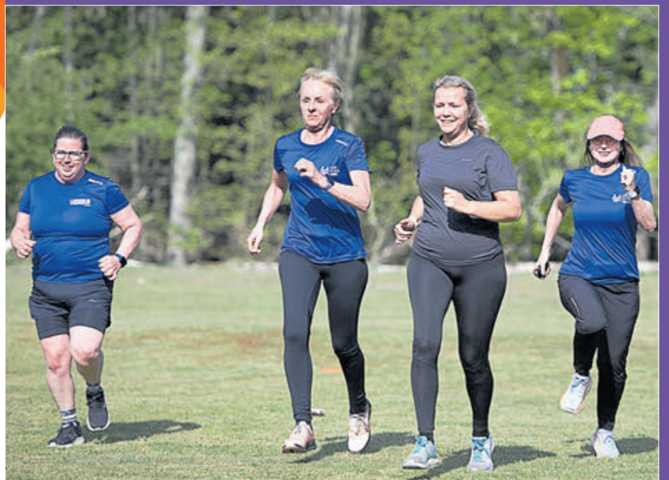
Lekker bewegen met HBC Gymnastics.