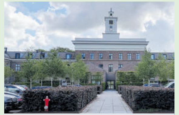
Carré van Bloemendaal.