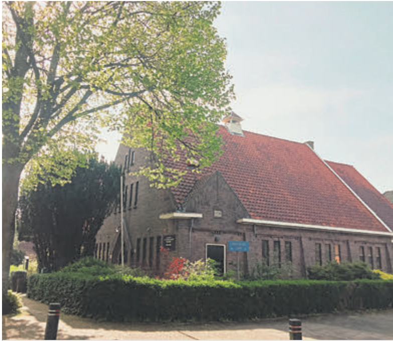
Doopsgezinde kerk.