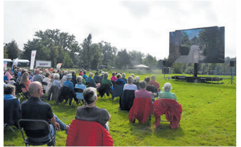
In een heerlijk zonnetje wordt er genoten van de film op de Vrijheidsdreef.