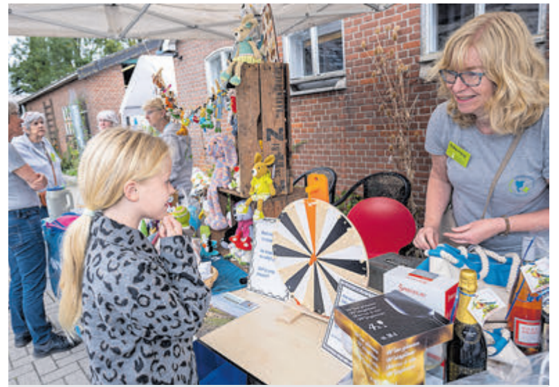
Gezelligheid is troef bij de open dag.

Haarlem - Zoals vanouds wordt het een gezellige boel op de open dag op zaterdag 9 september van 10-16 uur bij het Vogelhospitaal aan de Vergierdeweg 292 in Haarlem-Noord. Corona en de vogelgriep goieden afgelopen jaren de hekken dicht, maar nu is beperkte openstelling aan de voorzijde mogelijk. Natuurlijk neemt het hospitaal geen enkel risico en daarom is vrij rondlopen bij haar patiëntjes vanwege vogelgriep niet mogelijk. Wel is er een rondleiding door vrijwilligers zodat bezoekers toch delen van de professioneel ingerichte faciliteit kunnen zien. Ook zijn er interessante presentaties. Om de inwendige mens van een hapje of drankje te voorzien, is er een gezellige cateringhoek. Bij het rad van fortuin zijn leuke prijsjes te winnen, ter bezichtiging staat er een Dierenambulance, er zijn informatiekraampjes en diverse kinderactiviteiten. Vrijwilligers, bestuursleden en medewerkers vertellen met passie over hun werkzaamheden. Wie zich geroe-