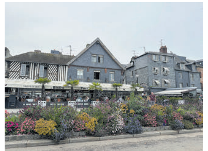
Honfleur, een keur aan bistrotjes maar ook veel oudheid in deze plaats waar de Seine uitmondt in het Kanaal.