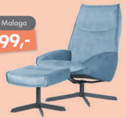
Model Malaga NU v.o. 599,-