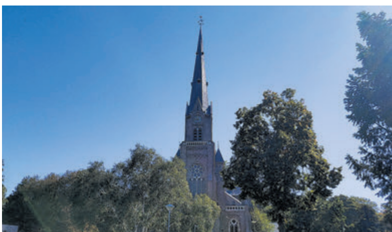
De Heilige Bavo in Heemstede.

De Open Monumentendagen bieden u de gelegenheid om onder orgelklanken, ook het interieur van de kerk en de fraaie glas-in-lood ramen te bekijken. Vele van deze ramen zijn van de hand van Han Bijvoet. Zeer de moeite waard om te komen bekijken! U bent van harte welkom.