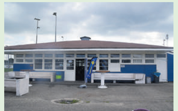
RCH clubhuis Heemstede.