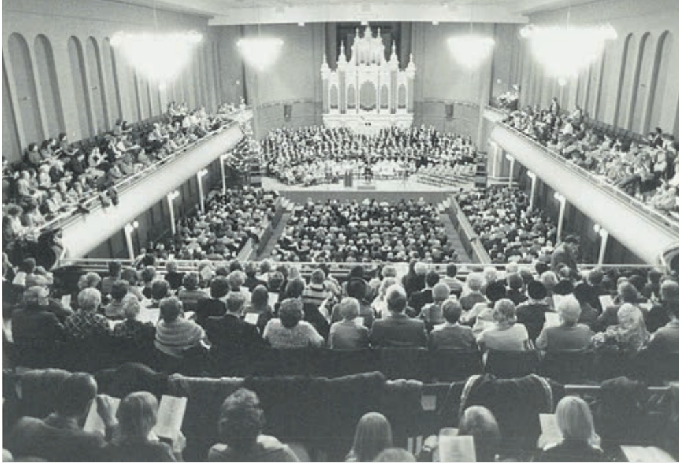
PHIL 150 jaar nostalgie: Grote Zaal.