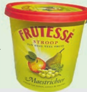
Luikse of Maastrichtse stroop.