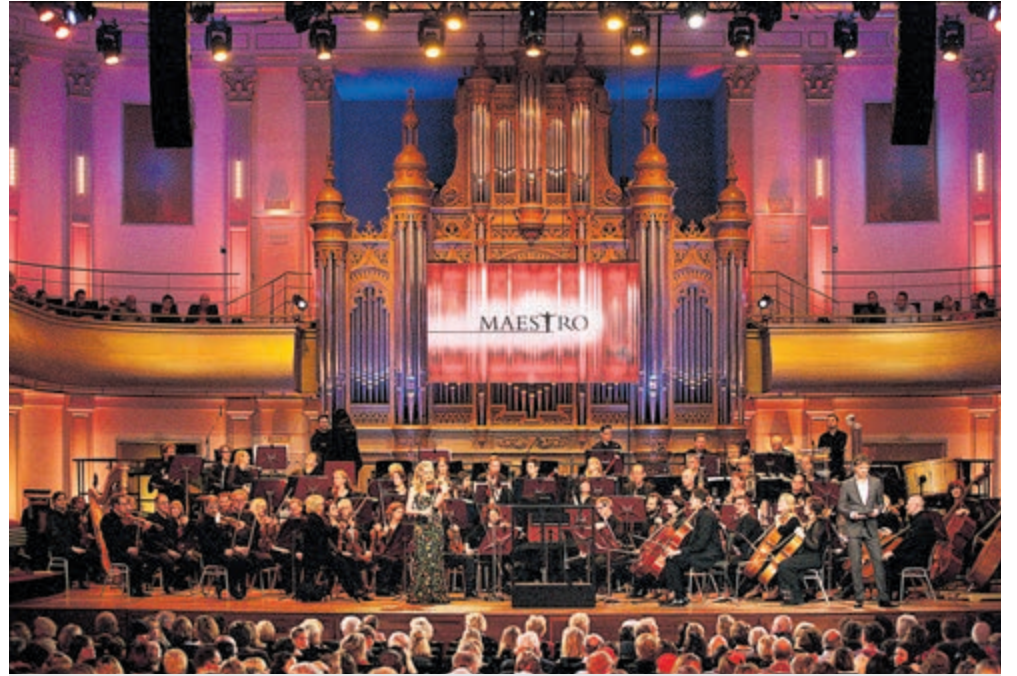
PHIL NPO Maestro-orkest.