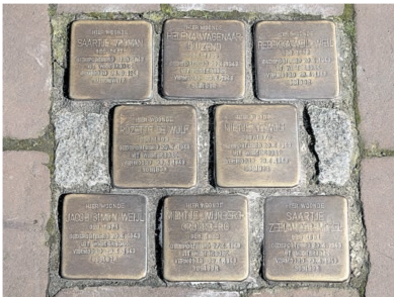
Struikelstenen met namen van gedeporteerde en vermoorde joodse slachtoffers.

Op de website struikelstenen-haarlem.nl zijn de namen te vinden van de mensen waarvoor in november de struikelstenen gelegd worden en is er meer informatie te vinden.