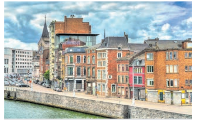
Gezicht op Luik oftewel Liège.