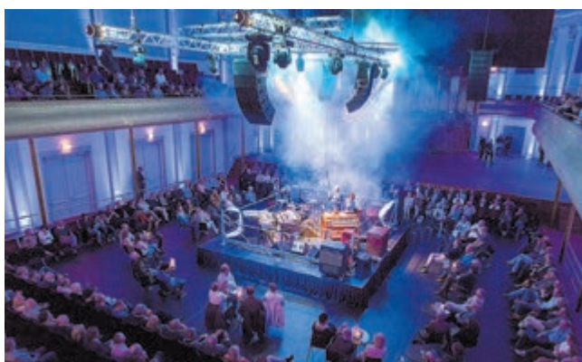
PHIL Haarlem grote zaal flexibele opstelling boxing.