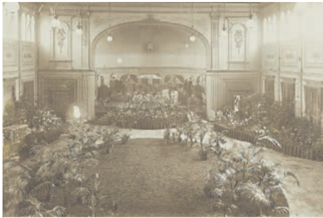
Philharmonie Grote Zaal Orchideeëntentoonstelling.

In de Gemeentelijke concertzaal zijn concerten te zien van onder meer de Haarlemsche Orkest Vereniging (de voorloper van het Noordhollands Philharmonisch Orkest, later Holland Symfonia), de Bachvereniging en muziekschool Toonkunst. Zij weten in al die jaren nogal wat klassieke toppers naar Haarlem te halen. Denk aan de Franse componist Maurice Ravel, die zelfs twee keer komt spelen, in 1923 en in 1932. Of de Russische componist Igor Stravinsky, die in 1926 zijn eigen muziek dirigeert met het