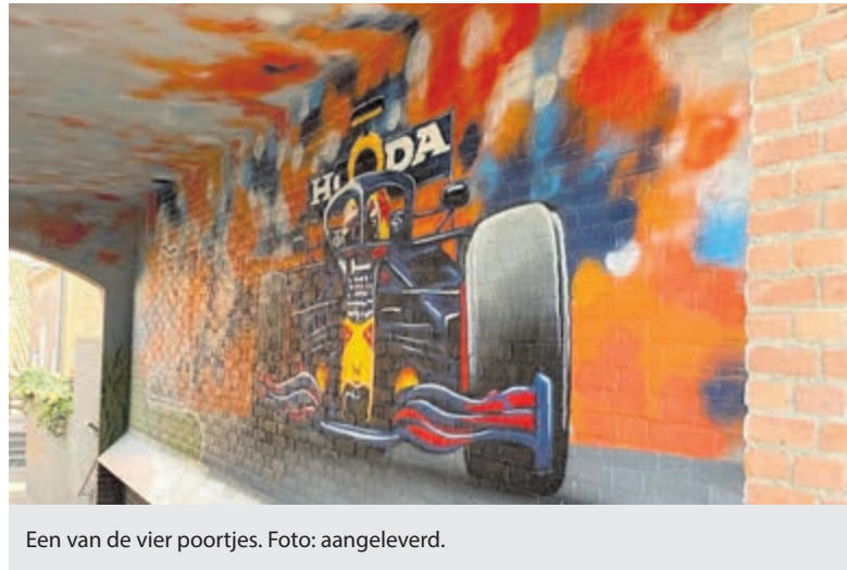
Een van de vier poortjes.