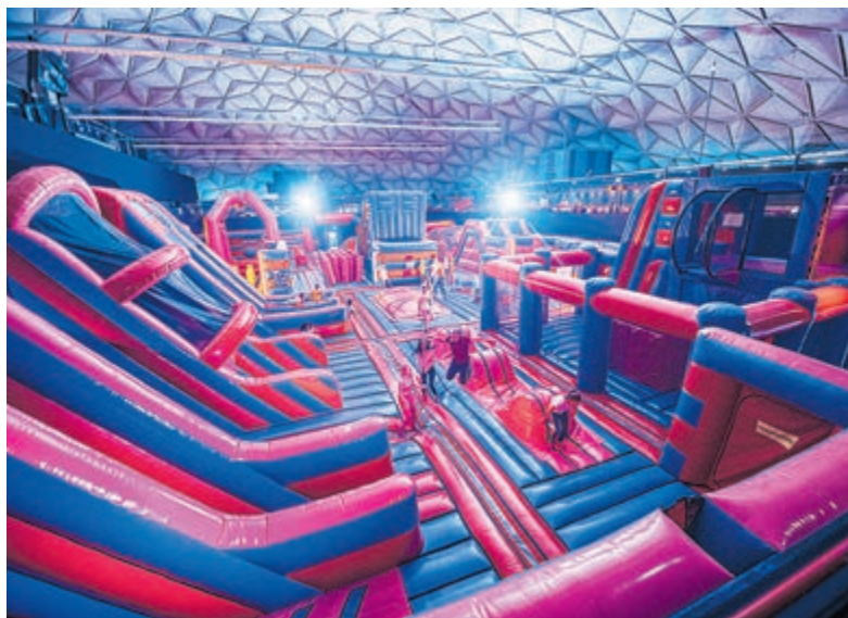
Luchtkussenpark FunMania. Foto aangeleverd.

boeken? Ga naar www.lariva.nl of kom langs LaRiva Raadhuisstraat 27 in Heemstede, tel. 023 547 4419.