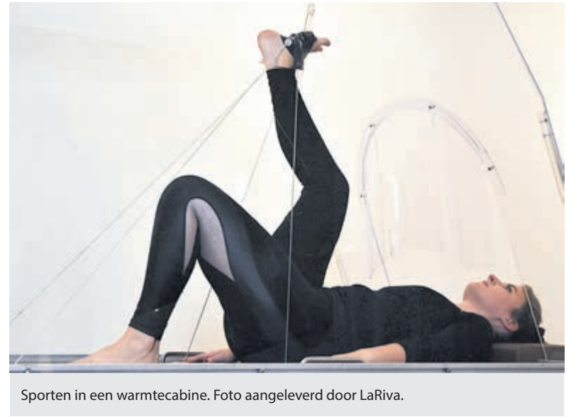
Sporten in een warmtecabine.

Een belangrijk verschil met bijvoorbeeld de sportschool is efficiënt en doelgericht sporten (met alle voordelen van de warmte) en altijd onder