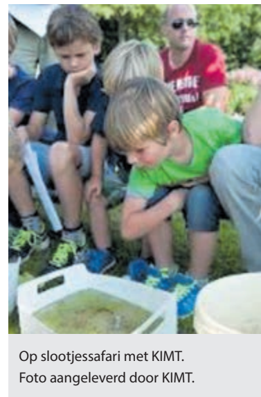
Op slootjessafari met KIMT.

Aanmelden via: info@kominmijntuin.com of telefonisch: 023-5282651 (Mik van der Bor).