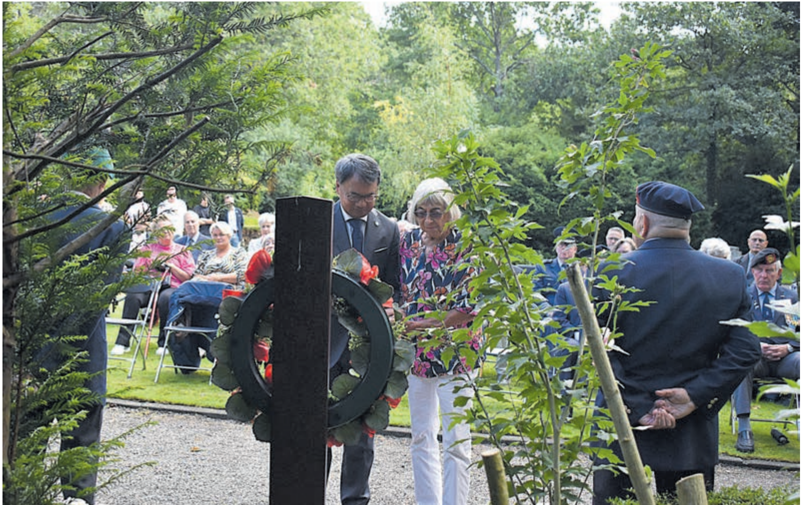
Kranslegging op de Herfstlaan.

De taptoe werd geblazen. Na het daartoe gegeven commando ston-