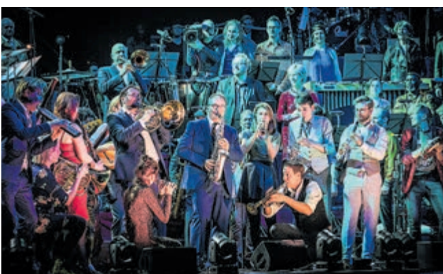
Nederlands Blazers Ensemble.

PHIL bestaat 150 jaar en dat wordt gevierd van 8 tot en met 17 september a.s. Er is dan een keur aan optredens van onder meer Maan, het Nederlands Blazers Ensemble, 2 Meter Sessies en Arthur en Lucas Jussen. En er is er een bijzondere versie van 'Canto Ostinato' te horen waarbij ook het orgel bespeeld wordt. Het hele programma staat op philhaarlem.nl/150jaar .