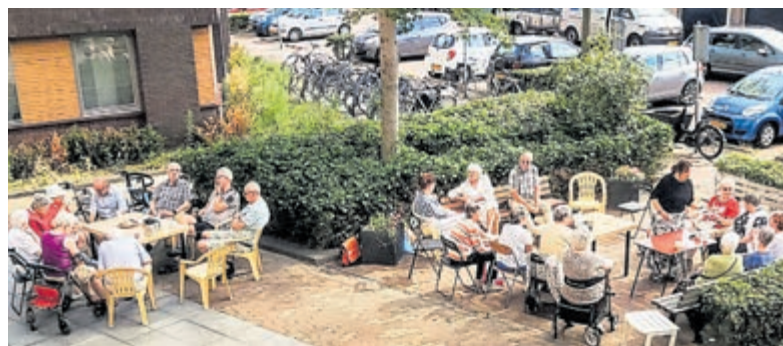
Gezelligheid in de Provinciënwijk.

WIJ Heemstede ondersteunt bij wijkinitiatieven. Meer info op: www.WIJHeemstede.nl .