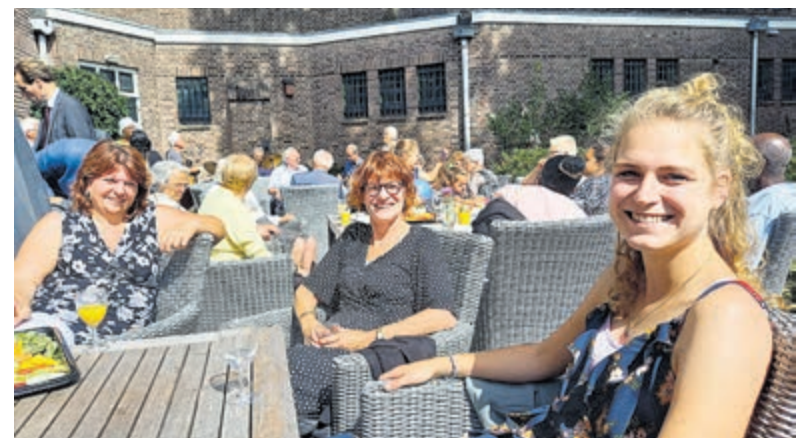
95-jarig Jubileum groots gevierd door parochie Hemelvaartkerk.

even de jubileumwijn die inmiddels onderweg is naar de Paus en hij sprak de geestige hoop uit dat het Vaticaan vaste klant wordt bij de Hemelvaartkerk. Na de Mis was er in de gemeenschapsruimte een uitgebreide koffietafel met veel taart, cake, koek en gebak. Alles door parochia-nen gemaakt. Vervolgens ging men massaal naar de geheel opgeknapt pastorietuin voor een feestelijke borrel met prosecco, frisdrank en een grote variatie aan hartige hapjes. Veel indische snacks, Zuid-Amerikaanse pasteitjes en allerhande quiches en dip- en knabbelingen. Vanda dos Santos had het Trio Bossa Nova