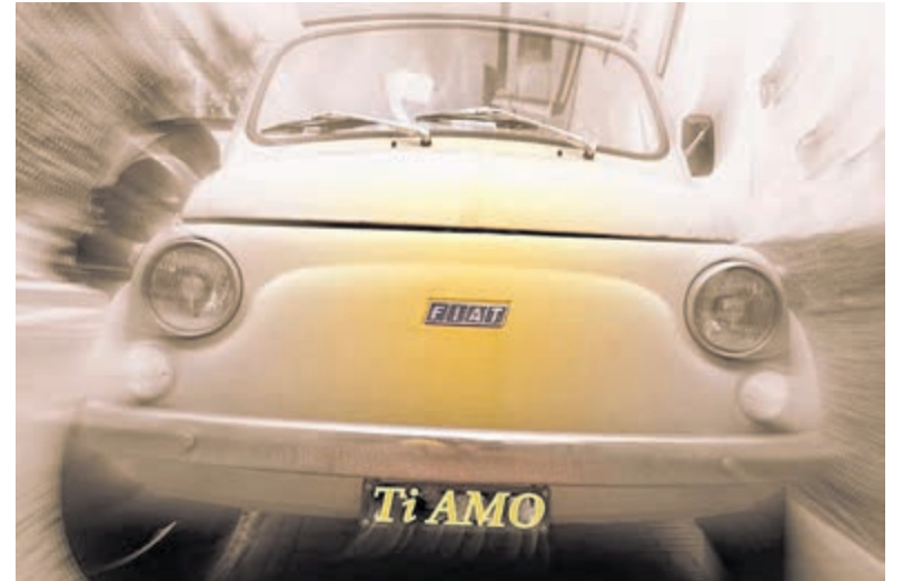
Symbool voor Italië: de iconische Fiat 500.