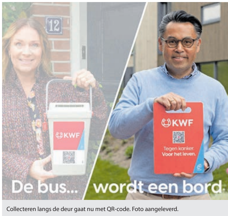
Collecteren langs de deur gaat nu met QR-code. Foto aangeleverd.

Meer informatie over de diverse activiteiten kunt u vinden op de website www.wijheemstede.nl . U kunt natuurlijk ook altijd even bellen om informatie te vragen op tel. 023 – 528 60 22.