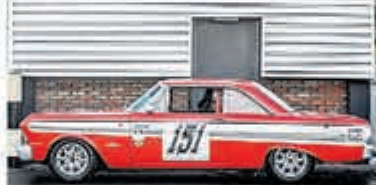
Ford Usa Falcon FUTURA SPRINT € 79.000,-