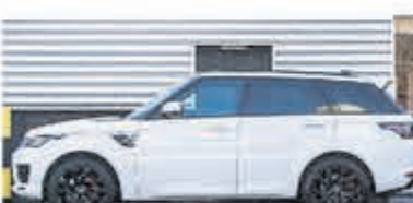
Land Rover Range Rover Sport P400e HSE € 102.950,-