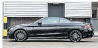
Mercedes-benz C-klasse 220 d Cabrio Premium Pack € 47.900,-