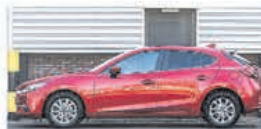
Mazda 3 2.0 S.A. 120 TS € 22.900,-