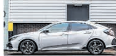
Honda Civic 1.5 i-VTEC Sport + € 24.950,-