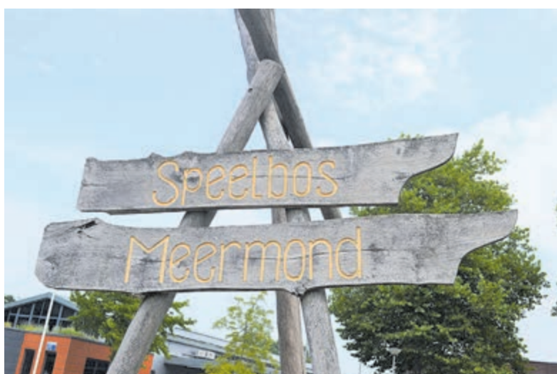
Speelbos Meermond.

Heemstede – Op zaterdag 20 augustus wordt van 14-17 uur een picknick gehouden op Speelbos Meermond, gelegen aan de Cruquiusweg 47 in Heemstede. De picknick is voor kinderen en volwassenen. Neem je eigen eten mee. Drinkjes en lekkers worden daar verstrekt. Wel van tevoren aanmelden als je aan deze picknick wilt deelnemen via e-mail: marlies@marliesvanheese.com . Bij deze picknick draait het om gezamenlijk spelen, eten en plezier. Deze picknick is georganiseerd door Stichting Taalcoaches Zuid-Kennemerland en Stichting Haarlem Mozaïek.