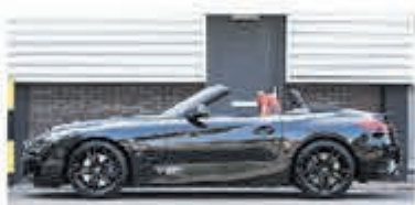
BMW Z4 Roadster sDrive30i Hi. Ex. Ed € 54.950,-