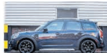
Mini Countryman 1.5 Cooper Salt € 24.950,-