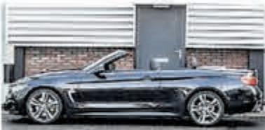
BMW 4 Serie 430i Cabrio € 49.950,-