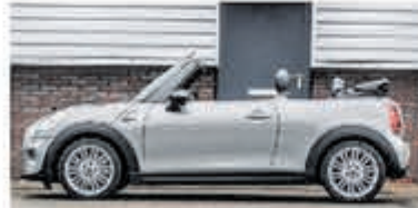
Mini Cooper Cabrio 1.5 C. Chili S. Bns € 25.950,-