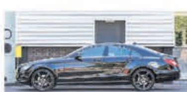
Mercedes-benz CLS-klasse 350 € 22.750,-