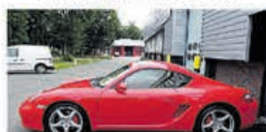
Porsche Cayman S Tiptronic Uniek 76.000 km € 29.950,-