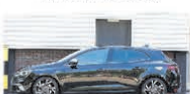
Renault Megane 1.6 TCe GT € 21.950,-