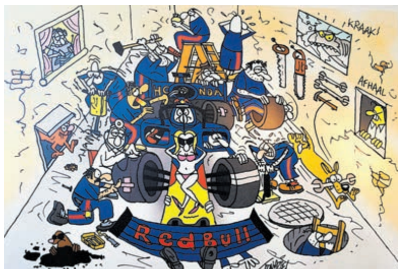
De afbeelding van Toon van Driel.

Zandvoort Beyond is het Side Events programma waarmee de 'Formula 1 Heineken Dutch Grand Prix' niet alleen gevierd wordt op het Circuit, maar ook in Zandvoort én in de regio. Zandvoort Beyond biedt een breed programma voor iedereen. Ook deze expositie is onderdeel van het veelzijdige side events programma. Meer informatie: www.zandvoortsmuseum.nl .