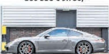
Porsche 911 3.8 Carrera S € 84.900,-