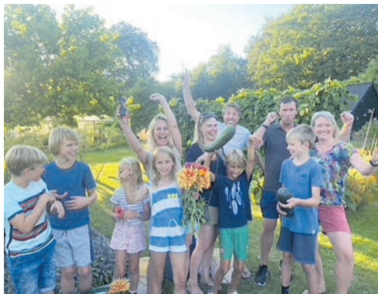
Wie zaait, oogst op KIMT.

Meer informatie op: www.kominmijntuin.com .