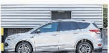
Ford Kuga 1.6 Titanium Pl. 4WD € 18.450,-