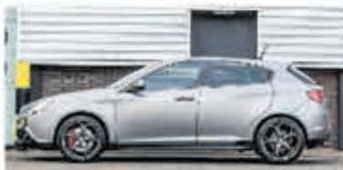
Alfa Romeo Giulietta 1.7 TBI Quad. V. € 23.950,-