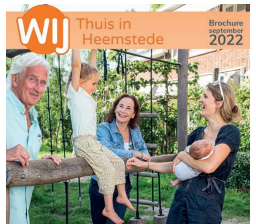
Voorzijde nieuwe brochure WIJ Heemstede.

mooier Heemstede. De activiteiten van WIJ Heemstede zijn erop gericht dat mensen elkaar kennen en er voor elkaar zijn. En dat mensen die ondersteuning nodig hebben dit ook krijgen. Bij WIJ Heemstede werken naast de vaste medewerkers, veel vrijwilligers. Voor mensen die graag iets willen betekenen voor een ander biedt WIJ Heemstede de mogelijkheid om vrijwilligerswerk te doen. Samen organiseert WIJ veel activiteiten en bieden WIJ hulp waar dat nodig is. Meer informatie over alles wat WIJ Heemstede doet leest u in de nieuwe brochure en op: www.wijheemstede.nl .