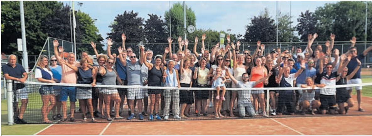
Winnaars TV HBC Open 2022.