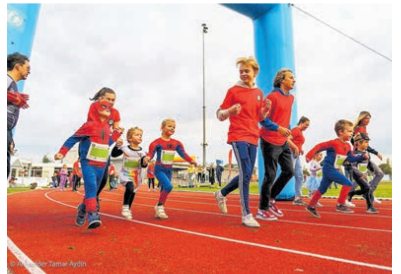
SuperHero Kidsrun.

Het evenement wordt georganiseerd door een kernteam van vrijwilligers vanuit CityShapers, in samenwerking met vele mooie organisaties uit Haarlem. Ze zijn nog op zoek naar vrijwilligers die op de dag zelf een handje willen helpen. Aanmelden daarvoor kan ook op de eerdergenoemde website. Meer informatie over de organisatie is te vinden op www.cityshapers.nl .