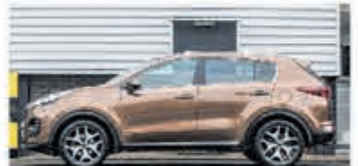
Kia Sportage 1.6 T-GDI 4WD GT-L. € 25.750,-