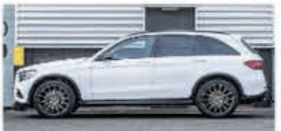
Mercedes-benz GLC-klasse 250 d 4MATIC Luchtvering € 44.900,-