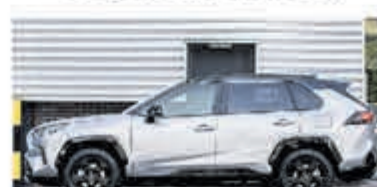
Toyota RAV4 2.5 Hybrid Bi-Tone € 38.750,-