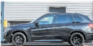
BMW X5 xDrive40e M Sp. Ed. € 59.900,-