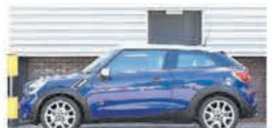
Mini Paceman 1.6 Cpr S ALL4 Chili € 12.950,-