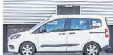
Ford Tourneo Courier 1.0 Titanium € 14.950,-