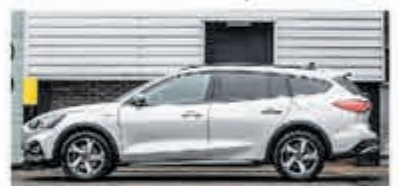
Ford Focus Wagon 1.0 EcoB. Tit. Bns € 27.900,-