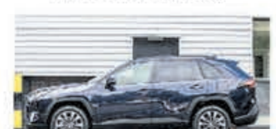
Toyota RAV4 2.5 Hybrid Dynamic € 41.900,-

Turenhout de occasiondealer van Heemstede en al meer dan 40 jaar uw vertrouwde onderhoudsadres.