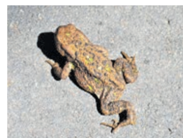
Gewone pad op de Manpadslaan.