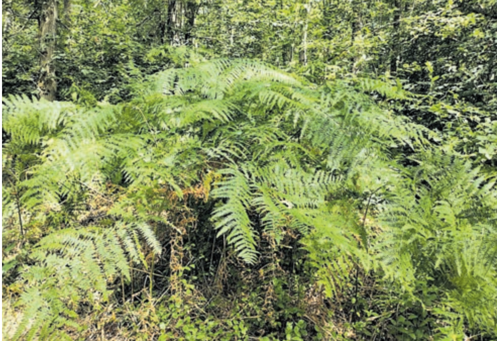
Adelaarsvaren op Leyduin.

Bloemendaal/Heemstede – De omgeving waarin we wonen is gezegend met veel groen en dat maakt het juist zo prettig wonen. Binnen een kort tijdsbestek bent u aan het wandelen in bossen als Middenduin, Koningsduin, de Waterleidingduinen, Leyduin of Wandelbos Groenedaal. Wie zijn ogen goed de kost geeft ontdekt veel en leert over het leven in het bos. Enkele zaken die u tegen kunt komen tijdens het wandelen worden hieronder uitgelicht. Sommige flora en fauna zijn eveneens in de tuin waar te nemen.