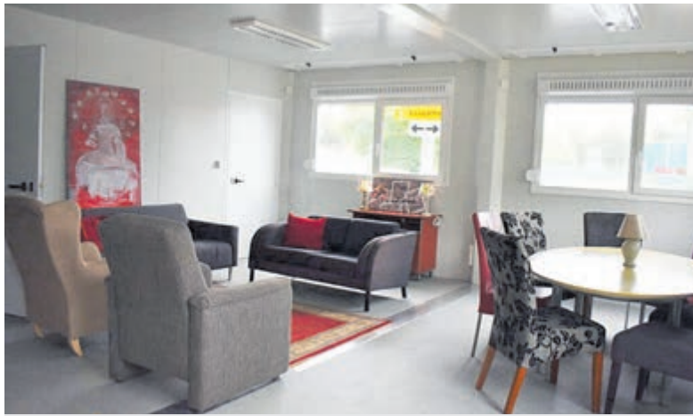
Ingerichte Containerwoning.

Heemstede – Op donderdag 28 juli heette wethouder Sam Meerhoff de eerste statushouders die hun intrek nemen in de noodwoningen op de Sportlaan, een warm welkom. Er zijn 15 units gereserveerd voor statushouders. Zij blijven hier maximaal 9 maanden wonen en krijgen begeleiding van o.a. Vluchtelingenwerk. Heemstede levert hiermee een bijdrage aan de versnelling van de opvang van alleenstaande statushouders die vaak lang moeten wachten in het Azc.