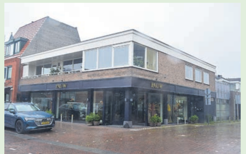
Pauw zit op Binnenweg 57. Op de bovenverdieping zit nummer 59. De nu-foto van Harry Opheikens is van 31 juli 2022.

Mocht u informatie of oude foto's van de panden van de Binnenweg, hebben dan kunt u terecht via heemstede@hvhb.nl (H. Opheikens). Tips en opmerkingen? Bel 023-8200170 (kantoor Heemstede).