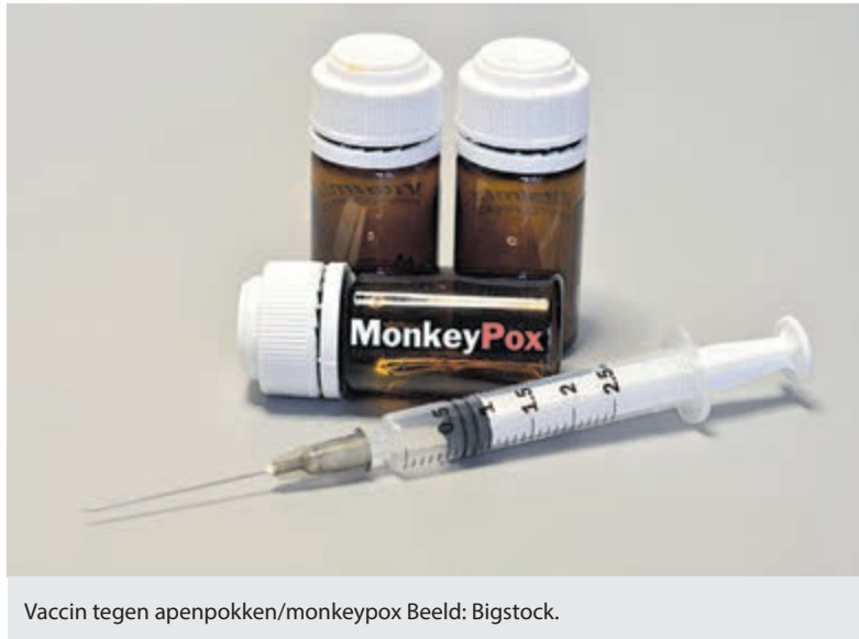
Vaccin tegen apenpokken/monkeypox

komen mensen op dit moment niet in aanmerking voor een vaccinatie. Vaccinatiecampagne