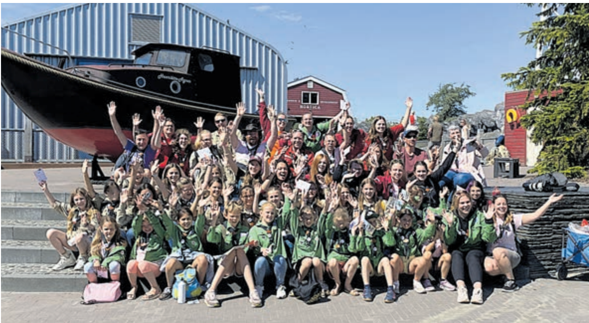
Groepsfoto Scouting WABO.

“In mijn tuin alleen maar begonia’s van Tuincentrum De Oosteinde te zien”, vertelt C. Sollman. “Waarom? Omdat het leger aan huisjes- en naaktslakken alle andere eenjarige en bloemvormige planten met huid en haar verslonden hebben. Behalve de begonia’s. Tip: Heemstedse slakken lusten geen begonia’s, dus aanplanten die kleurenpracht!”