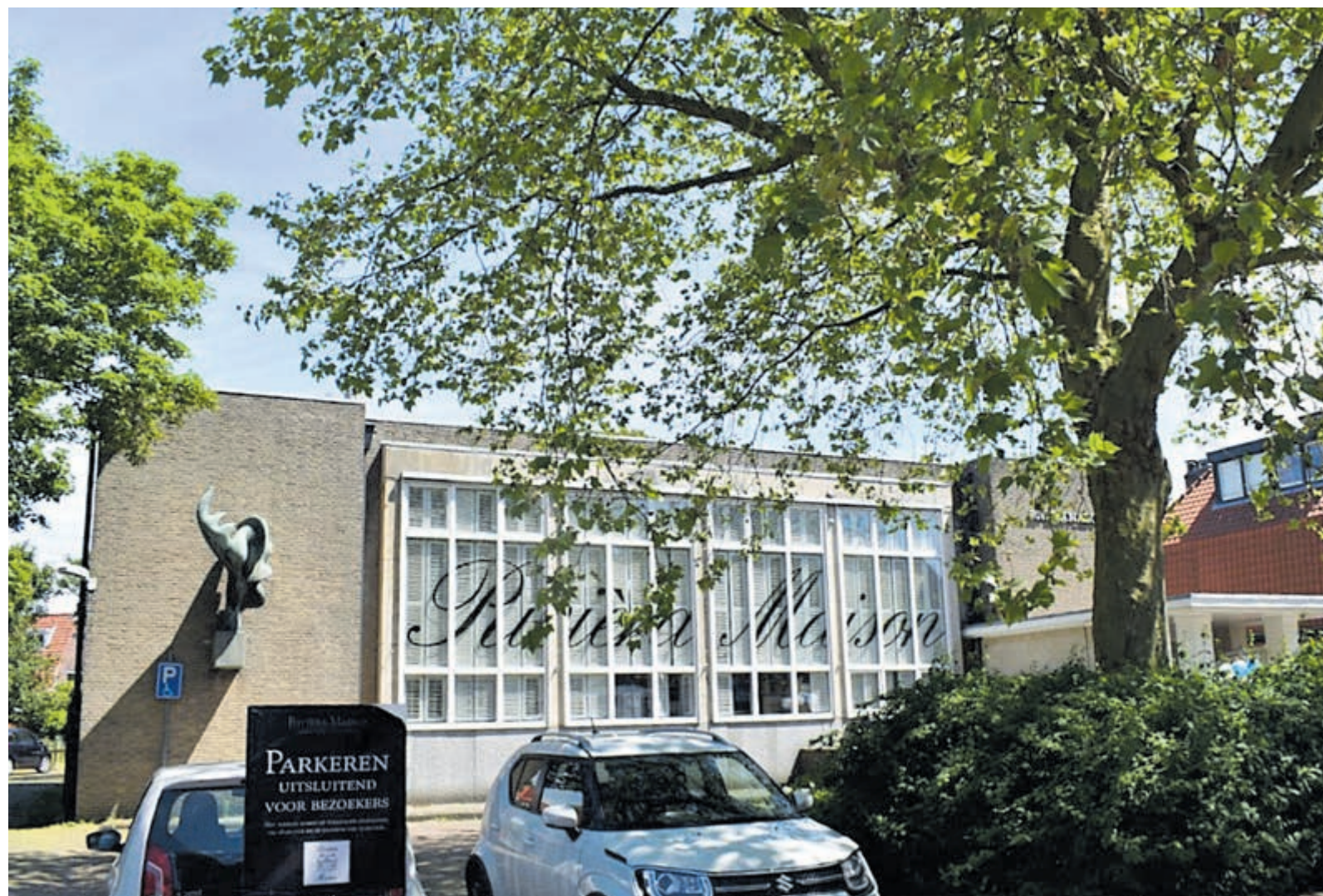
Het voormalig postkantoor.