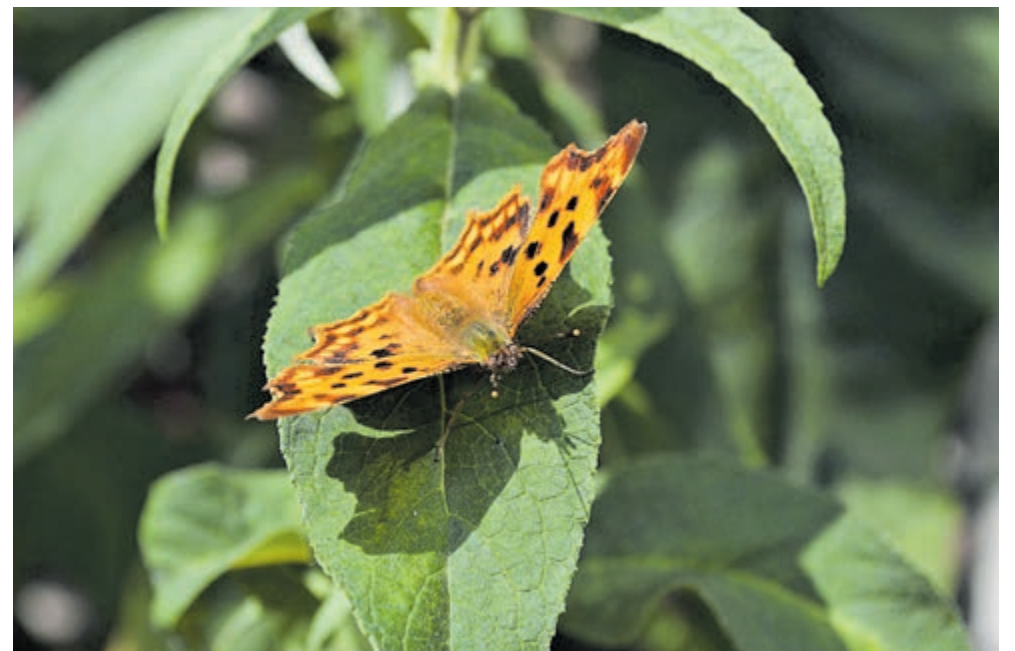
De fraaie gehakkelde aurelia.

De vlinder is een lid van de schoenlappersfamilie, waartoe onder andere ook de atalanta, de kleine vos, de dagpauwoog en de distelvlinder behoren. Het is nu een algemene vlinder die verspreid over het hele land voorkomt. Dit was echter niet altijd zo. Tot de jaren tachtig van de vorige eeuw werd de soort weinig waargenomen in het noorden en westen van het land, maar sinds die tijd heeft de gehakkelde aurelia zich steeds verder uitgebreid vanuit het zuiden. Het mannetje verdedigt zijn territorium en jaagt andere vlinders weg. Overigens is zijn territorium niet groot, ca. 12 m 2 .