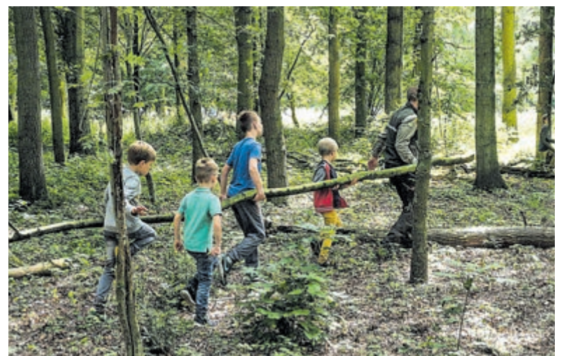
Survivaltocht Leyduin.

Trek kleren aan die tegen een stootje kunnen. Draag beschermende kleding tegen de beestjes en stekels. Vaders en moeders mogen (gratis) meebouwen, maar kunnen ook even langsgaan in het voormalige Juffershuis, nu Gasterij Leyduin. Reserveren is verplicht. Het is helaas niet mogelijk om ter plekke aan te sluiten. Vertrekpunt: Juffershuis / Gasterij Leyduin, Tweede Leyweg 7, Vogelzang. 10 minuten lopen van de parkeerplaats van Buitenplaats Leyduin. Zin om mee te gaan? Aanmelden op www.gaatumee.nl .