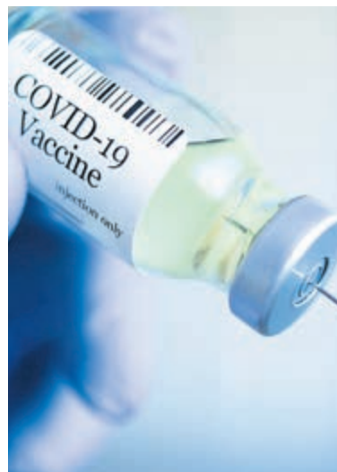
Herhaalvaccinatie coronavirus.