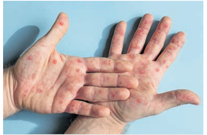
Apenpokken/monkeypox op handen

Iedereen die in aanmerking komt voor een vaccinatie ontvangt een persoonlijke uitnodiging van GGD Kennemerland. De eerste uitnodigingen worden in augustus verzonden. Zonder persoonlijke uitnodiging