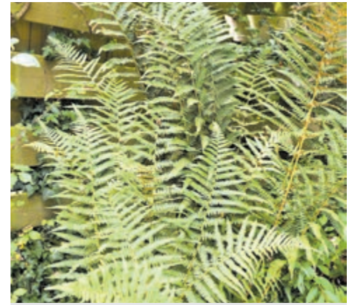
De koningsvaren geniet in Nederland een beschermstatus.

Dit heeft ertoe geleid dat deze soort aanzienlijk in aantal is afgenomen. In onze omgeving komt die nog wel hier en daar voor. De koningsvaren wordt beschouwd als bedreigde soort en is wettelijk beschermd, dus niet weghalen als deze in uw tuin groeit.