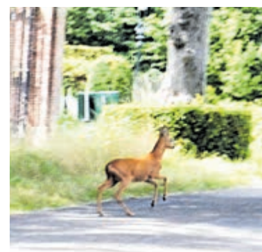
Ree op de Manpadslaan.

Heemstede – Natuur in optima forma afgelopen week op de Manpadslaan. Je zou denken dat de naam ontstaan is vanwege de aanwezigheid van padden, zoals deze overstekende pad, met het kroos nog op zijn rug op de foto. Of het nu echt om een 'man'-pad is of juist een wijfje gaat, is niet bekend. Het gaat in ieder geval hier om de gewone pad (bufo bufo). Padden brengen hun leven voornamelijk door op het land en zijn alleen in hun jeugd en tijdens de paaitijd in het water te vinden. Getuige het kroos op de rug, zou deze pad aan een paring kunnen hebben deelgenomen. Padden kunnen tijdens de paddentrek kilometers afleggen voor een geschikte paaiplaats aan het water, meestal hun geboorteplaats. Veel padden overlijden tijdens de paddentrek bij het oversteken van drukke verkeerswegen. Op sommige plaatsen worden daarom speciale tunneltjes gerealiseerd, zodat de paddentrek zo veilig mogelijk kan plaatsvinden. De volgende verrassing midden op de Manpadslaan was dit ree (capreolus capreolus), dat zich de laatste tijd meer in de bewoonde wereld laat zien. Geweldig mooi om te zien hoe de natuur zo zichtbaar is midden in ons Heemstede.