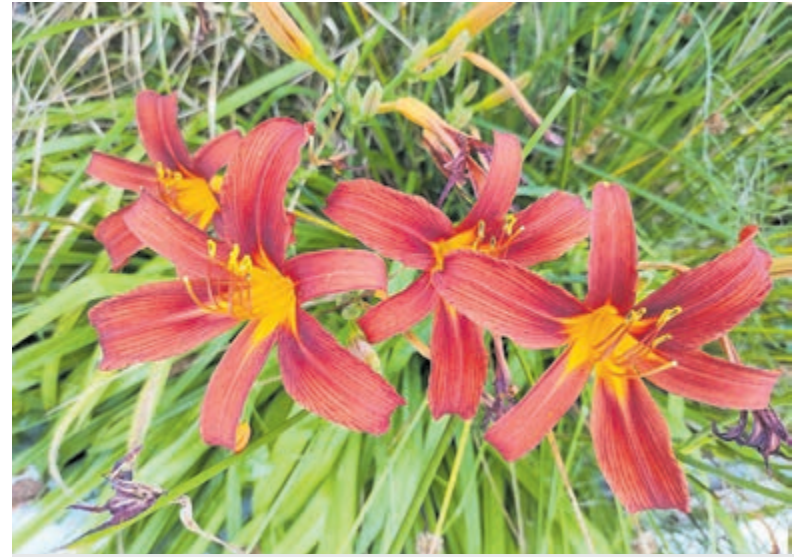
Bruine daglelie ( Hemerocallis fulva ).

Deze prachtige bruine daglelie ( Hemerocallis fulva ), met haar onmiskenbare roodoranje en gele tinten, vindt haar oorsprong in Zuidoost-Azië en werd ooit ingevoerd als stinsenplant. Ze komt hier en daar in Nederland in verwilderde vorm voor (zeldzaam), bijvoorbeeld in oude parken. Zij voelt zich thuis in lichte