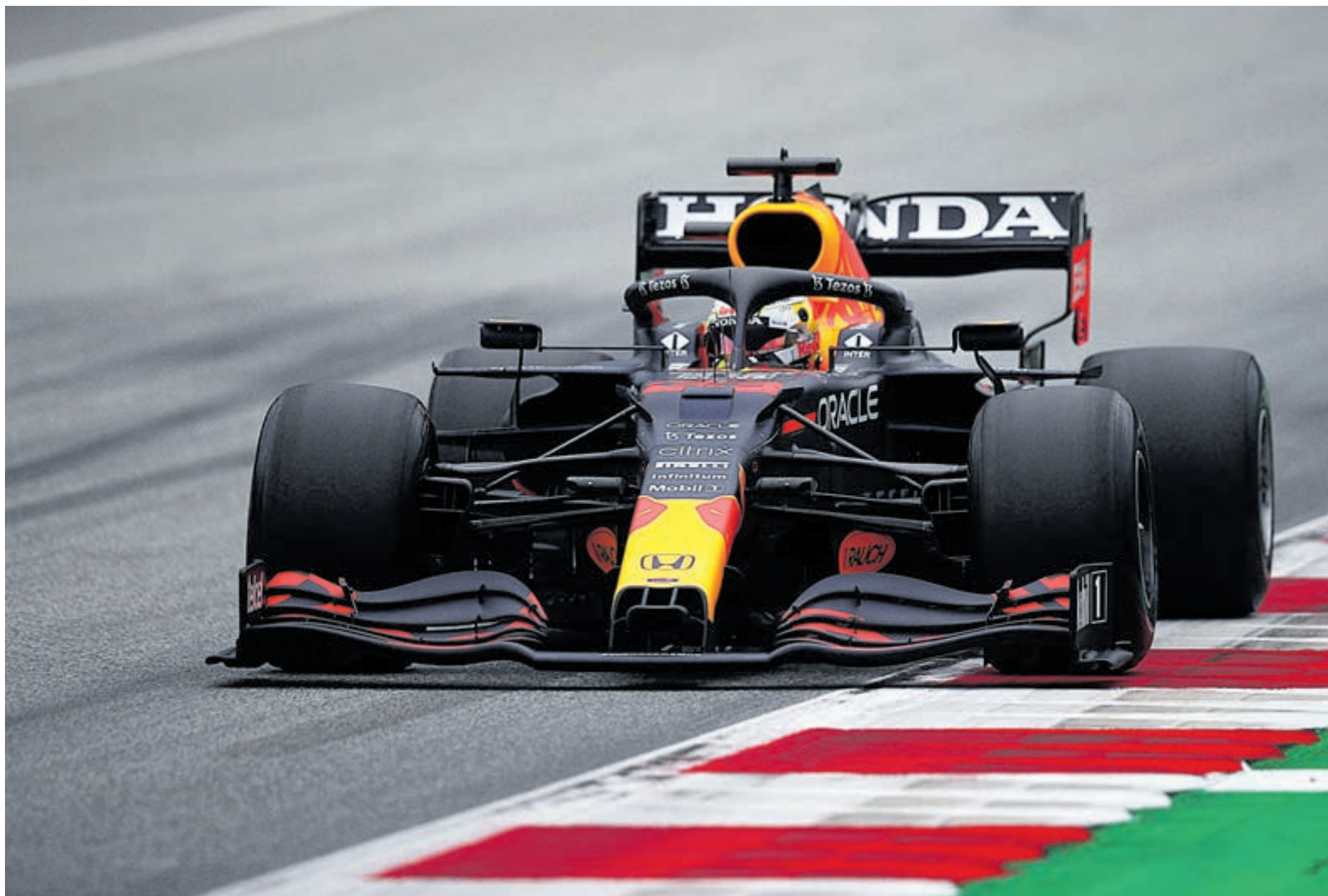
Max Verstappen tijdens de Formule 1 Grand Prix 2021 van Oostenrijk.