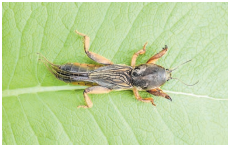
Veenmol ( Gryllotalpa gryllotalpa ).

bossen, op nattige graslanden, maar ook op beek- en rivieroeveren. Toch is deze vaste sierplant niet altijd makkelijk verkrijgbaar bij tuincentra. Ze bloeit van juni tot en met augustus. Deze fraaie lelie kan van 40