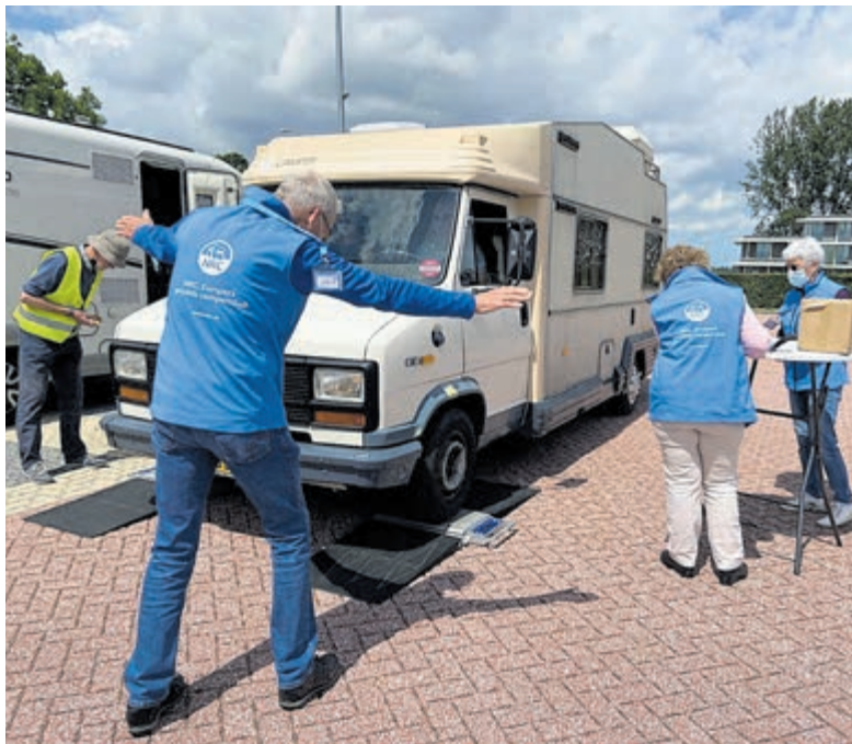
Gewichtscontrole campers.

Een derde van de campers was dus te zwaar. Veel campers waren verrast. Ze verwachtten niet dat hun camper overbeladen zou zijn. Van de campers met overgewicht was 44 procent maximaal 100 kilogram te zwaar. De rest was meer dan 100 kilogram te zwaar, waarvan 28 procent zelfs meer dan 200 kilogram. Van de te zware campers was 73 procent klaar om op vakantie te gaan, dus zij hadden de volledige vakantieuitrusting bij zich. 26