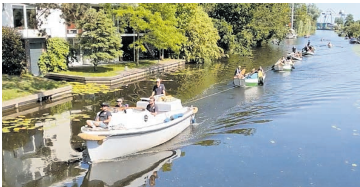
De sleep bij aankomst in Heemstede.