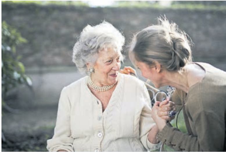
Zorg voor ouderen.

De partijen werken al enkele jaren intensief samen op meerdere vlakken en ervaren, zowel op bestuurders als op medewerkersniveau, een duidelijke meerwaarde door het bundelen van krachten. De twee organisaties zien het als een grote verantwoordelijkheid om elke oudere die zorg en aandacht te kunnen bieden die hij of zij nodig heeft. Door een mogelijke fusie menen Kennemerhart en Zorggroep Reinalda dan ook de kwaliteit en continuïteit van de ouderenzorg nog beter te kunnen garanderen. Gedacht kan hierbij worden aan verdere specialisatie van zorg en