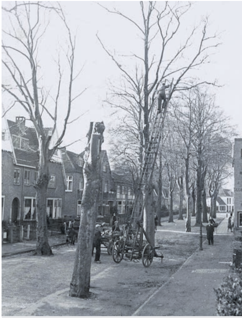
Rooien van beukenbomen in Koediefslaan in 1950.

In 1861 werd het Wees- en Armhuis van Heemstede gesloten. Voor de bewoners moest goed onderdak gezocht worden. Armoede was er zeker ook buiten het armhuis. Het speuren in justitiële archieven levert vele kleurrijke maar ook trieste verhalen op. Zoals een diefstal van twee gulden twintig die werd bestraft met vijftien maanden cel; dat kunnen we ons nu niet meer voorstellen!