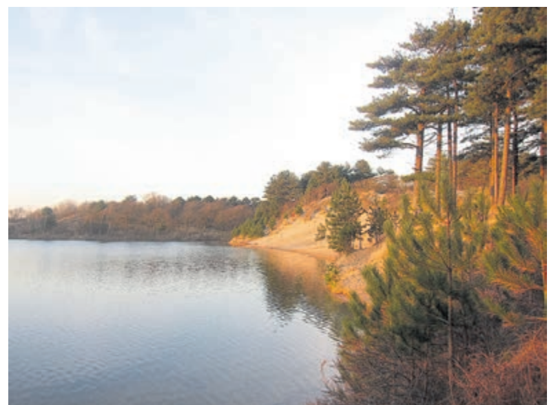
De Oosterplas.

Let op: deze excursie wordt uitgevoerd onder de huidige (Covid-19) voorwaarden: deelnemers en gids(en) zijn klachtenvrij, afstand van tenminste 1,5 meter handhaven, geen handen schudden, hoesten/niezen in de elleboogplooï en geen dingen aan elkaar doorgeven tijdens de excursie.