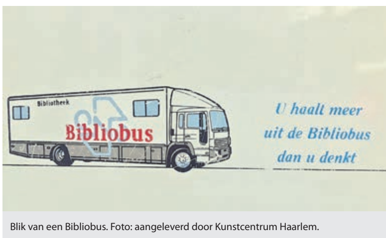
Blik van een Bibliobus.

De eerste aanwinst ontving Hans in 1969 in Ürgüp (Turkije) van de bibliothecaris/wijnfabrikant Mustafa Guzelgöz. Hij runde een ezel-bibliotheek. De boeken werden in kisten vervoerd per ezels in de dorpen van Capadocië. De in 2005 overleden bibliothecaris is met een straatnaam