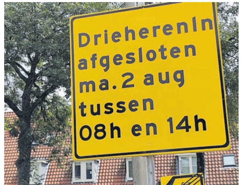
Drieherenlaan even afgesloten.

Heemstede - Op maandag 2 augustus wordt de Drieherenlaan van 8 tot 14 uur even afgesloten voor het verkeer wegens werkzaamheden.