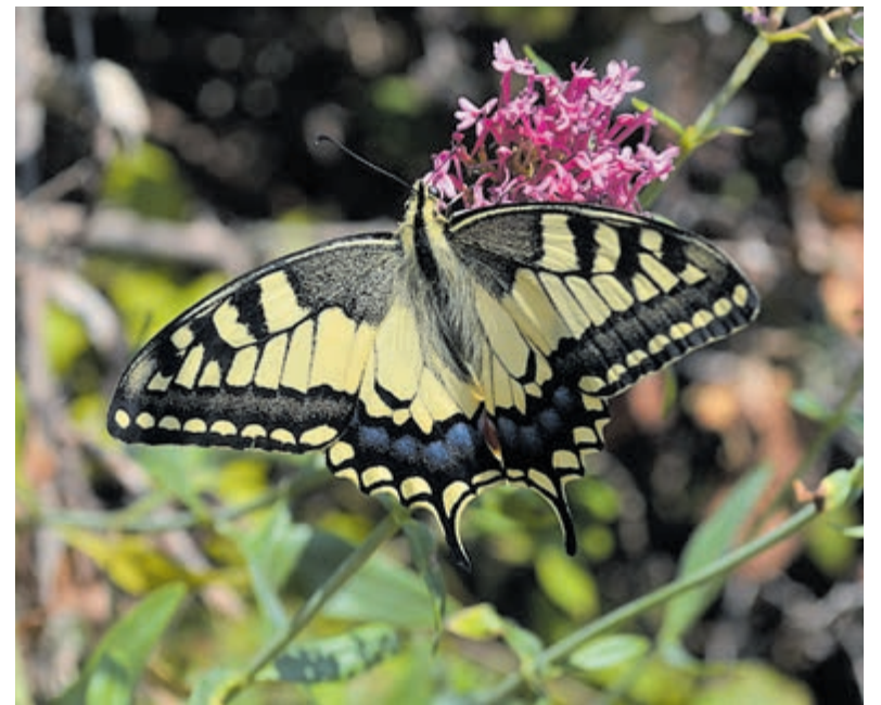
De zeldzame koninginnenpage.

Doe mee met de Groenendaal-wedstrijd voor kids uit de Heemstede van 20 juli op pagina 12 (Ook te zien in de digitale krant via www.heemstede.nl/news_hs/hs29-2021.pdf ) en win een waardebon van € 14,50 voor een heerlijke liter ijs van IJssalon Van Dam. Je inzending moet uiterlijk 24 augustus opgestuurd worden naar: info@wandelbosgroenendaal.nl .