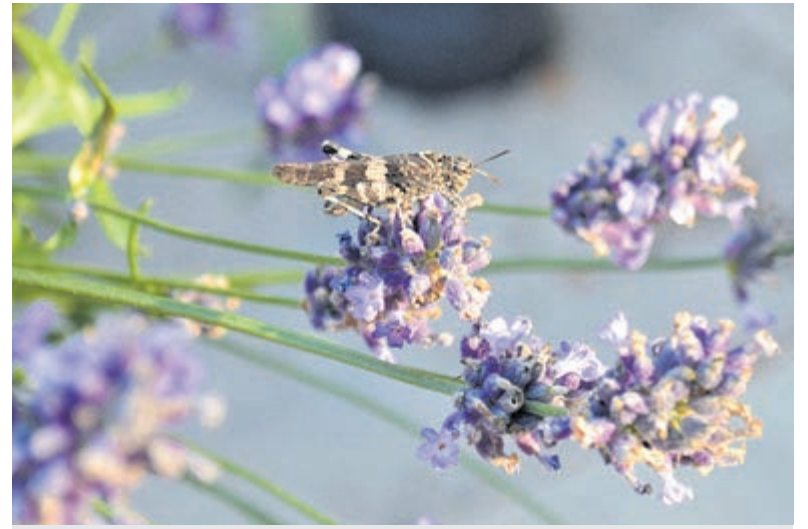
Blauwvleugelsprinkhaan ( Oedipoda caerulea ).