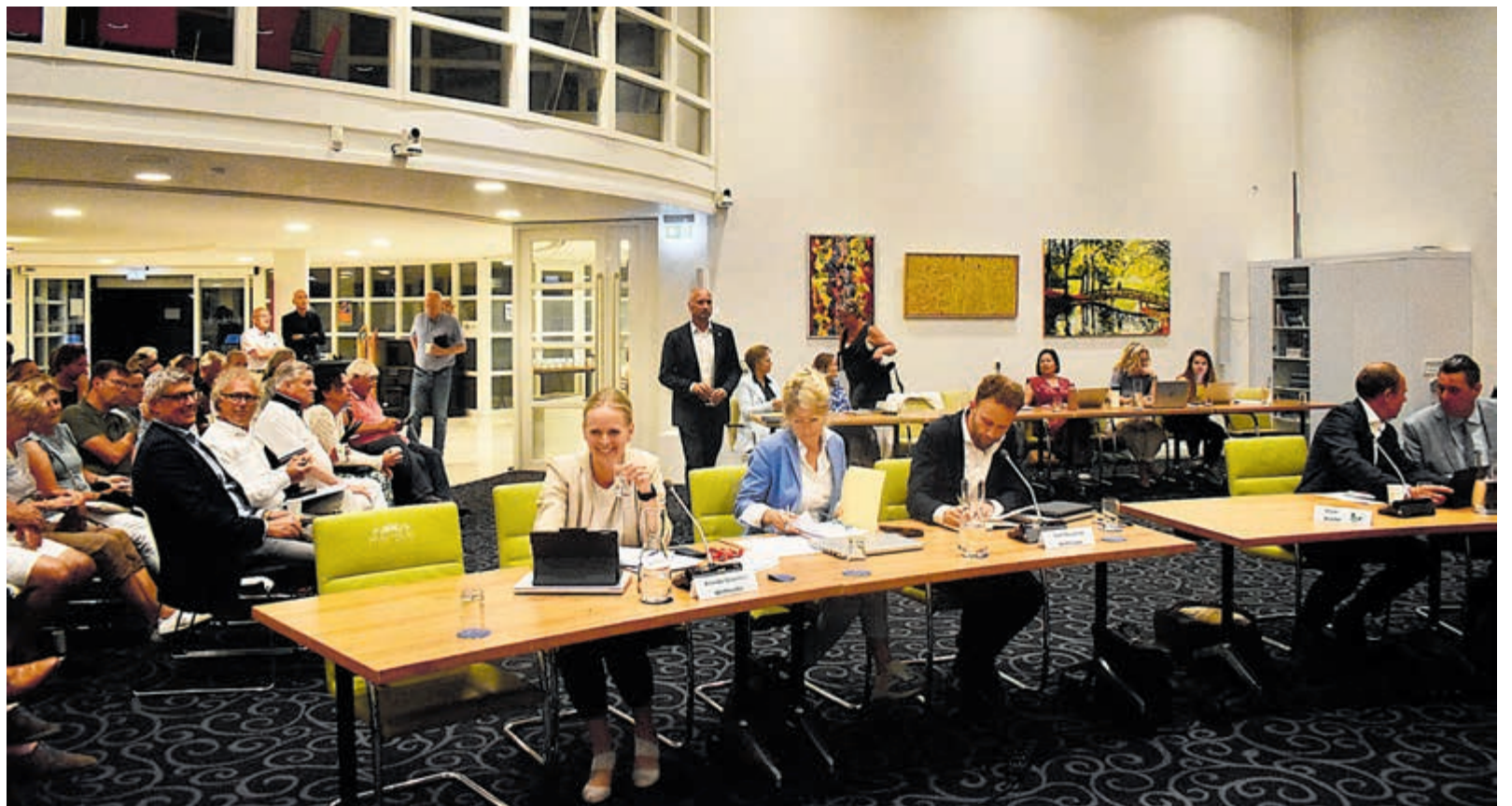
Massale opkomst in gemeentehuis.

Iedere inspreker had wel de een of andere invalshoek. Bij 21 van de insprekers kwamen de betogen neer op afwijzing van het plan. Na iedere inspreker klonk een luid applaus uit de zaal. Naaste buurman Sander Faassen vreesde voor een flinke waardedaling van zijn pand. De planschade is volgens het college nihil. Makelaars zien dat anders en voorzien waarde-daling van de omringende panden. Panden zouden slecht verkoopbaar zijn. Verwacht werd dat de jongeren in de avonduren in de tuin gaan