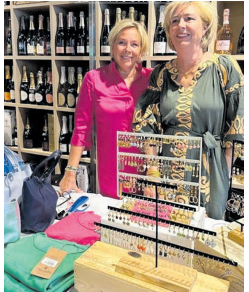
Cogolain Bis bestaat 5 jaar. Foto aangeleverd.