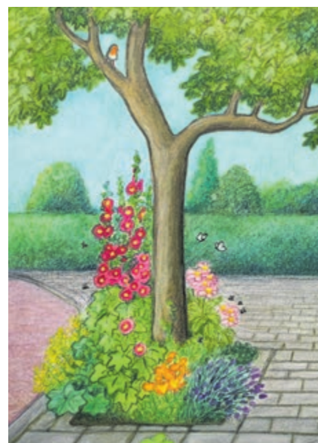
Boomspeigel van kunstenaars Vera de Backker

Ecoloog Karin Albers vertelt inwoners van de Geleerdenwijk op woensdag 5 juli alles over de wonderlijke wereld van planten en dieren. Wilt u meer te weten komen over biodiversiteit en hoe u die kunt vergroten? Kom dan naar één van de volgende bijeenkomsten op 5 juli: • Kindermiddag van 14.00 tot 15.30 uur. Locatie: speellocatie Kohnstammlaan • Informatieavond van 19.30 tot 21.30 uur (inloop vanaf 19.15 uur). Locatie: de Luifel, Herenweg 96 Beide bijeenkomsten zijn kosteloos. De eerste 50 aanmeldingen krijgen een verrassing, dus wees er snel bij. Aanmelden kan via gemeente@heemstede.nl