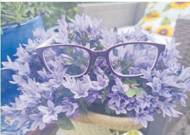
Het dalmatiëklokje nader bekeken.

De plant wordt ongeveer 10 cm hoog en waardeert een plek in de zon of halfschaduw. De nectar van de paarse bloemen is zeer geliefd bij insecten en trekt onder meer hommels, bijen en zweefvliegen aan, die plant op hun beurt weer bestuiven, ofschoon een tweeslachtig exemplaar van de plant dit zelf regelt. De plant kan de vorst redelijk doorstaan en wordt veelal ingezet als bodembedekker. Ook is zij geliefd in rotstuinen of op balkons. De plant kan weelderig gaan woekeren, maar blijft een lust voor het oog met haar fraaie bloemen. Een aanwinst voor uw tuin.