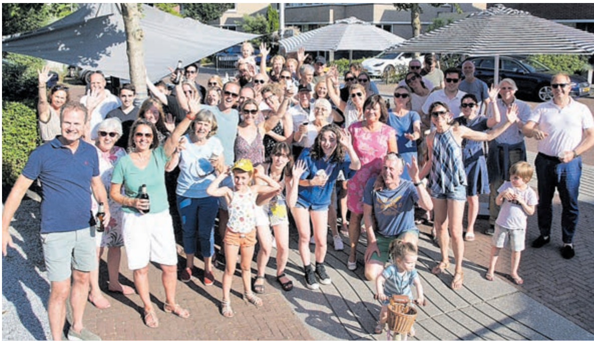
Volop gezelligheid in Vogelwijk.

De zwoele zomerse temperaturen hebben zeker bijgedragen tot het succes van de buurtborrel en als iemand zijn drone op laat stijgen om het geheel vanuit de lucht vast te leggen zijn vooral de kinderen niet meer te houden. Volgend jaar wellicht weer een buurtfeest wat hen betreft.