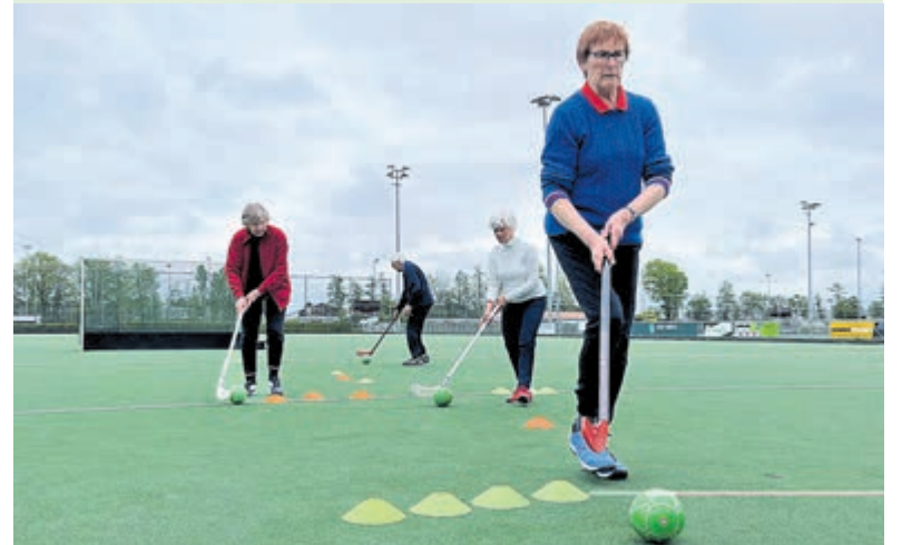
MHC Alliance zoekt versterking voor het gezellige Fithockey.

Fithockey is een teamsport voor senioren (mannen en vrouwen) en wordt gespeeld op het hockeykunstgrasveld. In een team bij Alliance wordt gespeeld met een grote lichte bal en een plastic lichte unistick in plaats van een knots, zoals dat ook wel bij andere verenigingen gebeurt. Hierdoor is het gemakkelijk en veilig spelen en ervaar je wel de hockeybeleving. Het plezier en bewegen staan voorop en hockeyervaring is niet nodig. Het tempo ligt laag en er is begeleiding vanuit Alliance. De leeftijd varieert van 65 tot 85. Kijk voor meer informatie op: www.mhc-alliance.nl , of neem contact op via e-mail: senioren.bestuur@mhc-alliance.nl .