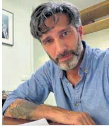
Lex Paleaux.

Zaterdag 1 juli komt Lex Paleaux naar Boekhandel Blokker om zijn meest recente roman 'Als de dood zucht' te signeren. Met 'Als de dood zucht', zijn vierde roman, toont Paleaux zich een verhalenverteller pur sang. Feit en fictie wandelen hand in hand door dit verhaal dat zich afspeelt in een psychiatrische jeugdkliniek in de jaren negentig. Acht bewoners zijn in een groot huis tot elkaar en het leven veroordeeld. Hoe overleef je op een plek waar niets is wat het lijkt en