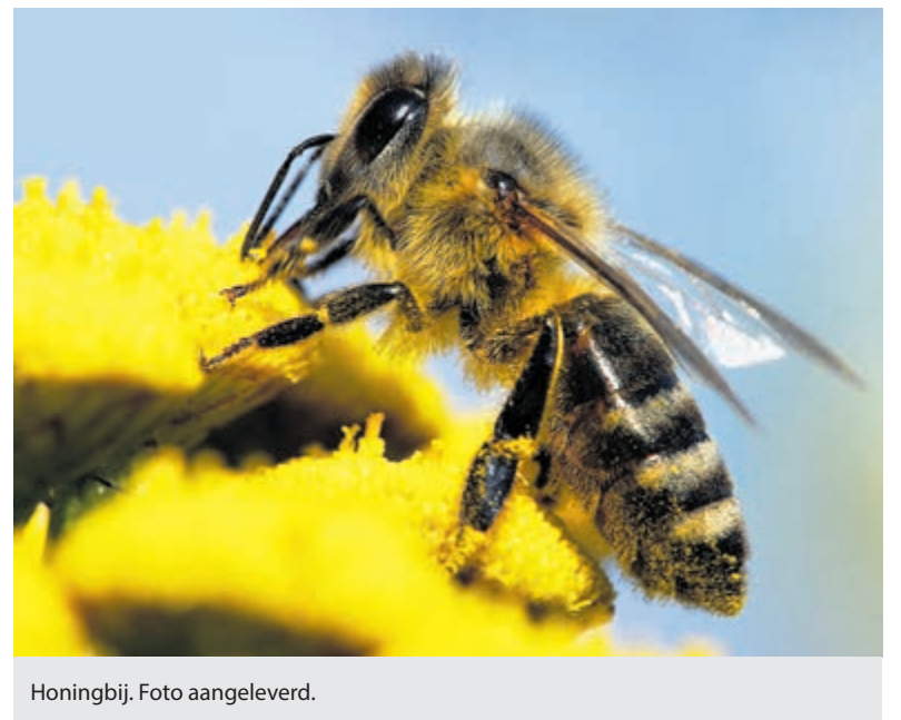
Honingbij. Foto aangeleverd.

De WUR is bezig met het analyseren van de onderzoeksresultaten. Het is daarom nog niet met zekerheid te zeggen welke andere factoren een