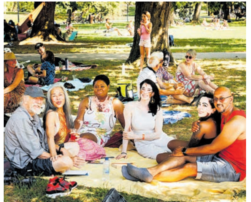
Picknick van vitiligopatiënten, vrienden en familie.