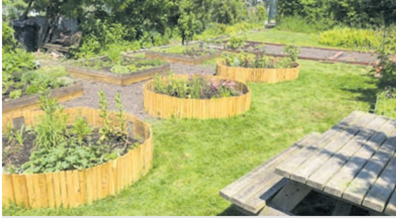
De pluktuin van de Gillestuin. Foto aangeleverd.