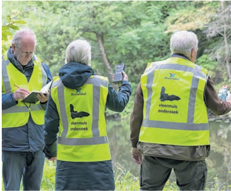
Vleermuizen spotten.

Stuur dan een mailtje met uw naam, telefoonnummer en het aantal personen waarmee u komt naar ivnz.vleermuis@gmail.com .