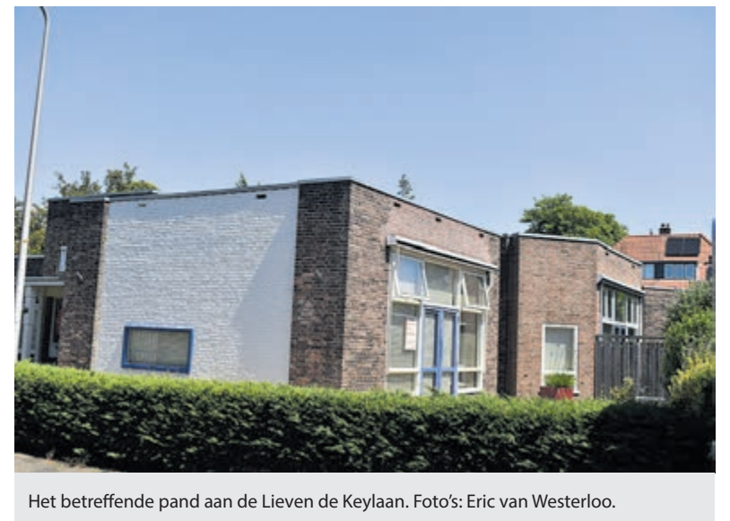
Het betreffende pand aan de Lieven de Keylaan.

Ates (VVD) vroeg waarom er niet eerder een participatie traject is gestart. GroenLinks wilde een quickscan, de PvdA wil versnellen, HBB vindt de eventuele rol van Elan onduidelijk en wil pas een discussie als er een plan ligt. Er zijn nog twee panden waar hetzelfde speelt. Glipperweg 55-57 en de Kerklaan 61. Daar wonen nu vooral Oekraïense vluchtelingen. Ook voor de toekomst van deze panden worden plannen voorbereid om deze, indien noodzakelijk, op termijn ook als flex-panden in te zetten. Het wachten is op verdere gemeentelijke plannen.