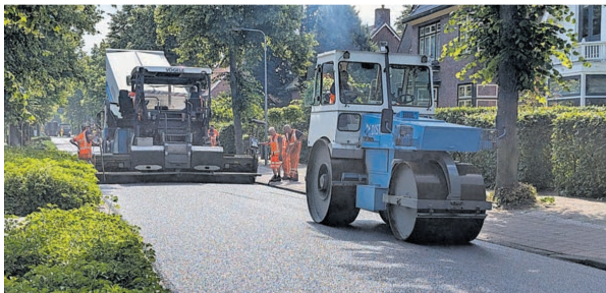
De Kerklaan krijgt een nieuwe asfaltlaag.