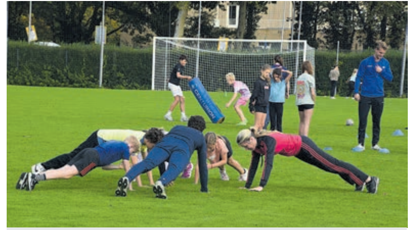
Lekker bewegen tijdens het Sport- en Bewegefestival Heemstede.

Aan de 5 tot 14-jarigen de keuze wat ze willen doen om eens een andere sport te leren kennen. Zo kan men aan basketbal doen, maar ook turnen, schaken, judo, rugby en skateboarden behoren tot de mogelijkheden. En wat te denken van circus? De clinics worden gegeven op het Johan Neeskens Sportpark, maar ook de sporthal wordt gebruikt. Lekker centraal. Ben je tussen de 5 en