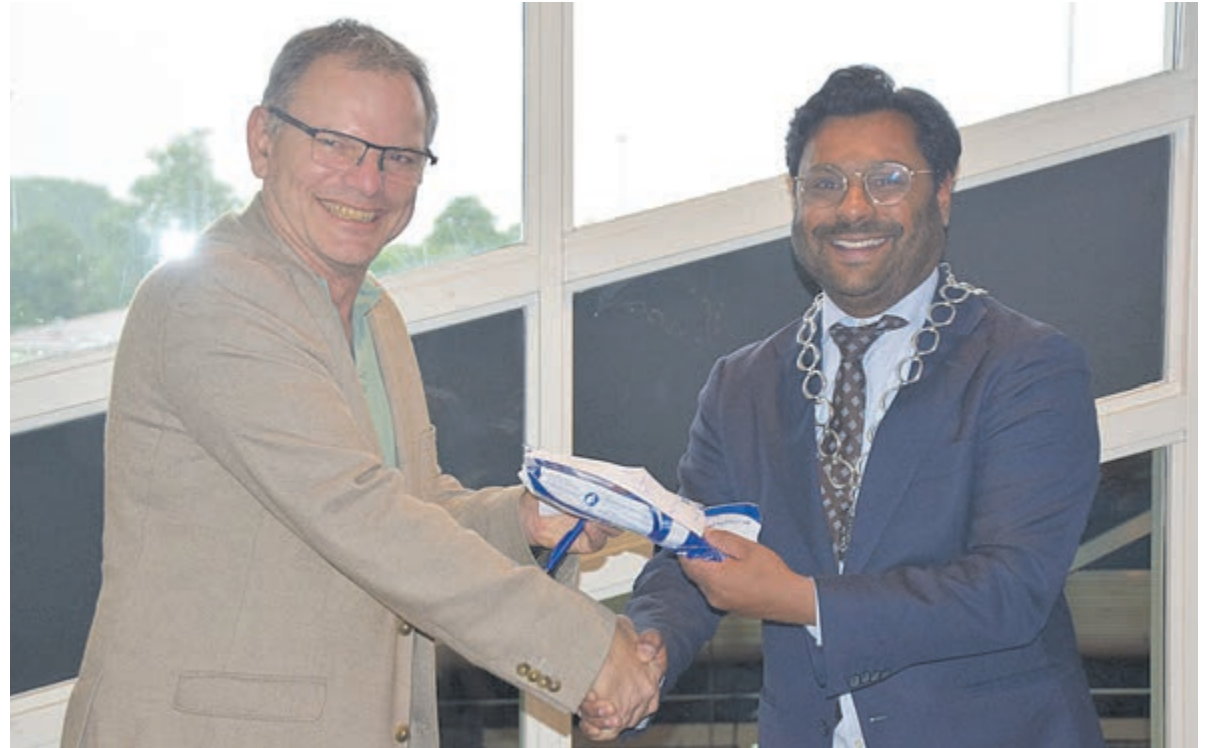
Ton van het BuurtComité ontvangt van de burgemeester een waterfilter.

Bij noodsituaties is belangrijk dat men minimaal 72 uur kan overleven, dat is ook een beetje de tijd die verschillende instanties nodig hebben om adequaat te kunnen reageren, steunpunten in te richten. Het boekje van de overheid 'Bereid je voor op een noodsituatie' werd hier en daar lacherig ontvangen. Zal het ons overkomen? Hebben de aanwezigen iets met de info gedaan als beschreven in het boekje? Het overgrote deel antwoordt ontkennend. Misschien extra water in huis, iemand had een