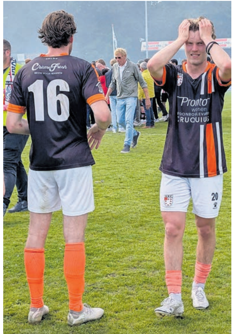
Teleurstelling na afloop bij HBC na de verloren wedstrijd tegen Hollandia.

Racing Club Heemstede speelde in dezelfde klasse als VEW, waardoor er twee mooie derby's te zien waren. De eerste wedstrijd tussen de beide kemphanen werd 5-5, de tweede ontmoeting werd door VEW met 3-1 gewonnen. Ook RCH had een goed seizoen achter de rug. Met een vierde plaats in de eindrangschikking mag men tevreden zijn. In het komende seizoen spelen beide clubs weer in de vijfde klasse. Met de fraaie accommodatie zou RCH één of meer treetjes hoger zeker niet misstaan.