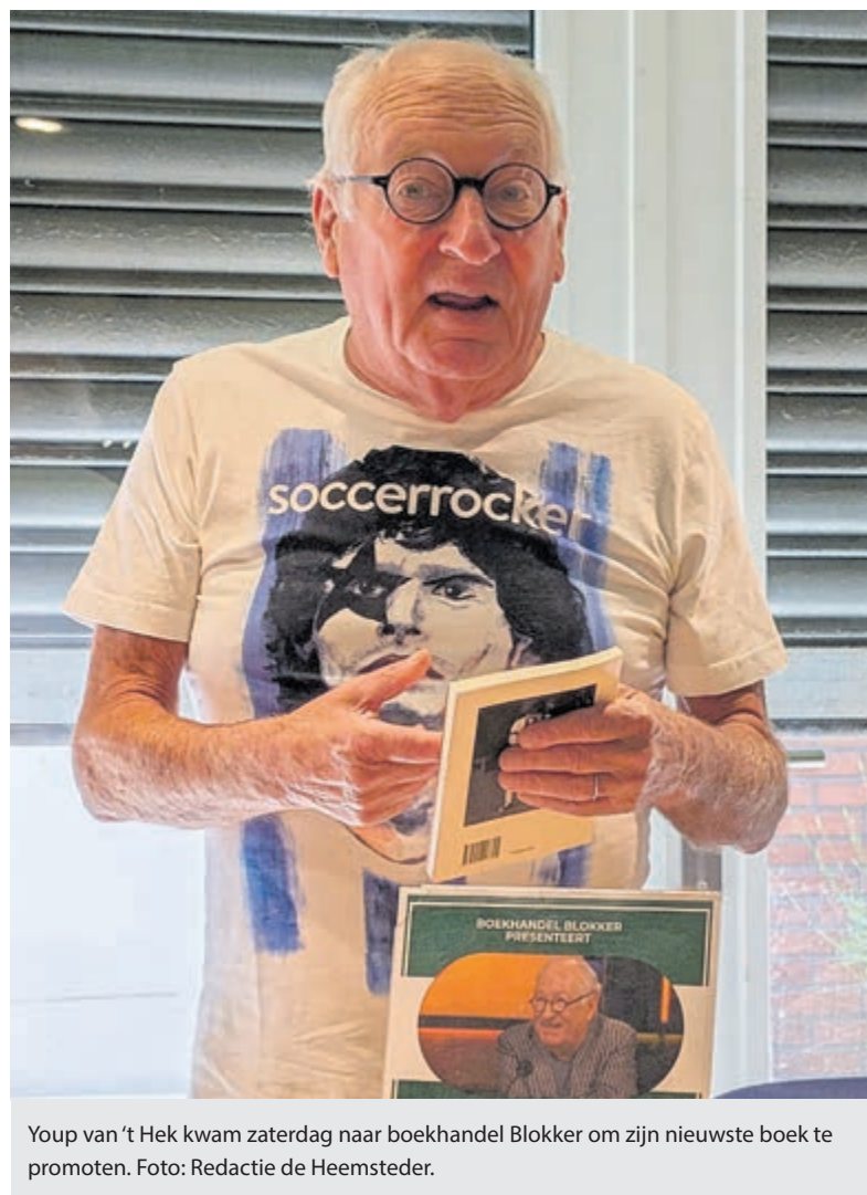
Youp van 't Hek kwam zaterdag naar boekhandel Blokker om zijn nieuwste boek te promoten.