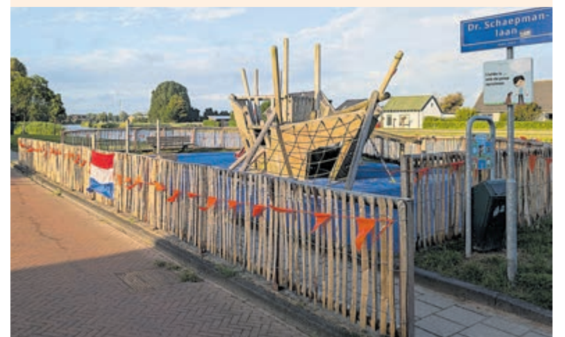
Oranjekoorts aan de Dr. Schaepmanstraat.

Heemstede - De oranjekoorts stijgt langzaam maar zeker in Heemstede. Zo krijgt op steeds meer plekken in de gemeente de kleur oranje de overhand. Ook de bewoners aan de Dr. Schaepmanstraat toverden de speelplaats voor kinderen in een oranjerfort om. Zaterdag 20 juni (aanvang 19.00 uur) speelt Nederland zijn tweede groepswedstrijd in poule F. Tegenstander is dan Zweden. Ook een leuke foto? Stuur die naar redactie@heemsteder.nl .