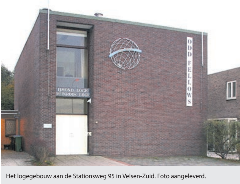
Het logegebouw aan de Stationsweg 95 in Velsen-Zuid.