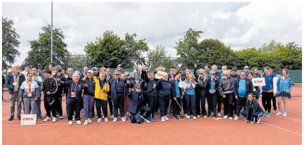
Leden en begeleiders van G-Tennisvereniging TV Smash kijken terug op een fantastisch weekeinde.

het bevorderen van een zinvolle tijdsbesteding, gelegenheid om nieuwe mensen te ontmoeten en verbinding te maken. Het stimuleren van een goede gezondheid, het ontdekken en ontwikkelen van talenten. Veel jeugd rijdt nu al op elektrische fietsen en fatbikes, weinig beweging en conditioneel al helemaal niet toereikend. Hoe leuk is het dus om de 27ste juni geheel gratis een sportclinic te volgen. Een plattegrond van waar welke clinic wordt gegeven, is op de dag zelf te krijgen.