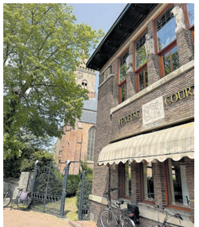
Mooie oude pandjes in Den Burg.