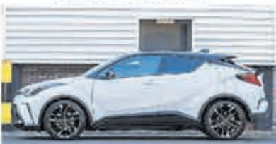
Toyota C-HR 2.0 Hybrid Bns GR S € 32.700,-