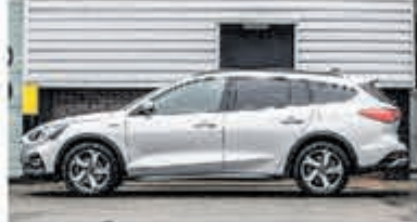
Ford Focus Wagon 1.0 EcoB. Tit. Bns € 24.900,-