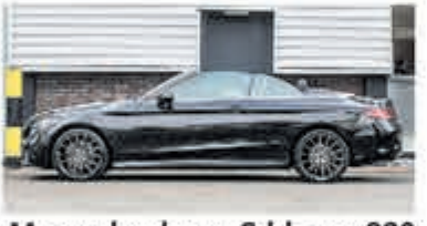
Mercedes-benz C-klasse 220 d Cabrio Premium Pack € 41.900,-