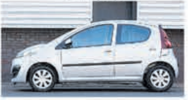
Peugeot 107 1.0 Active € 5.900,-