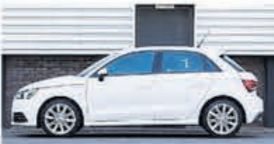
Audi A1 Sportback 1.0 TFSI Adrenalin € 14.900,-