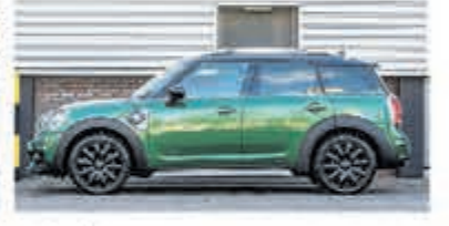
Mini Countryman 1.5 Co.S E ALL4 Chill € 35.700,-