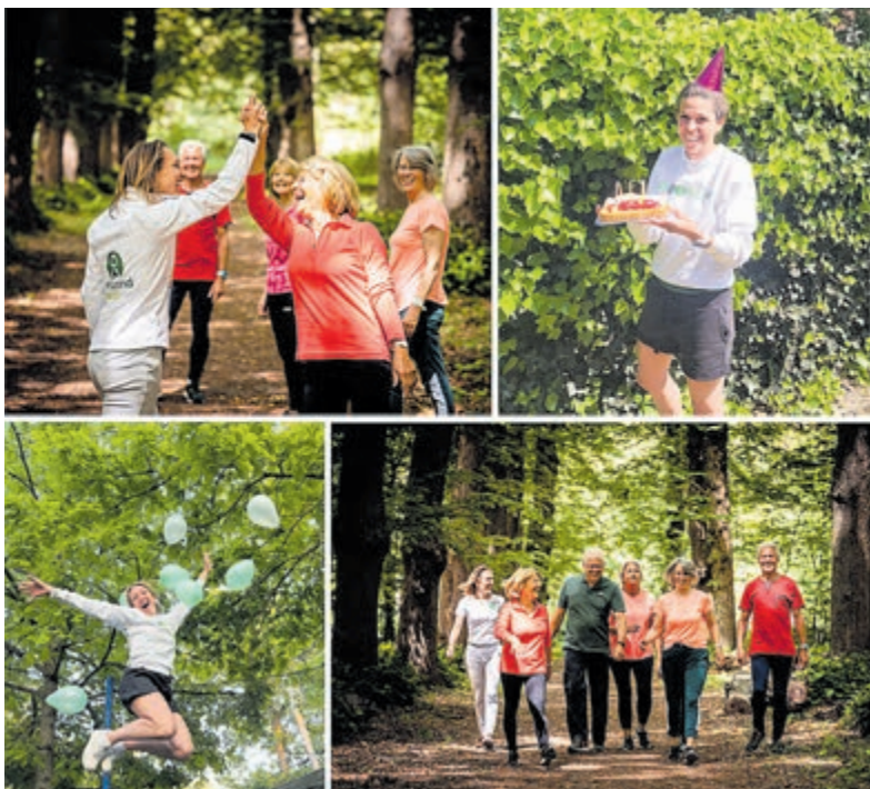
Vijf jaar GezondOud.