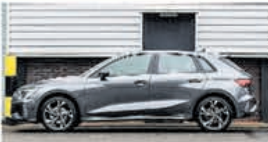
Audi A3 Sportback S Line edition € 42.950,-