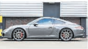
Porsche 911 3.8 Carrera S € 84.900,-