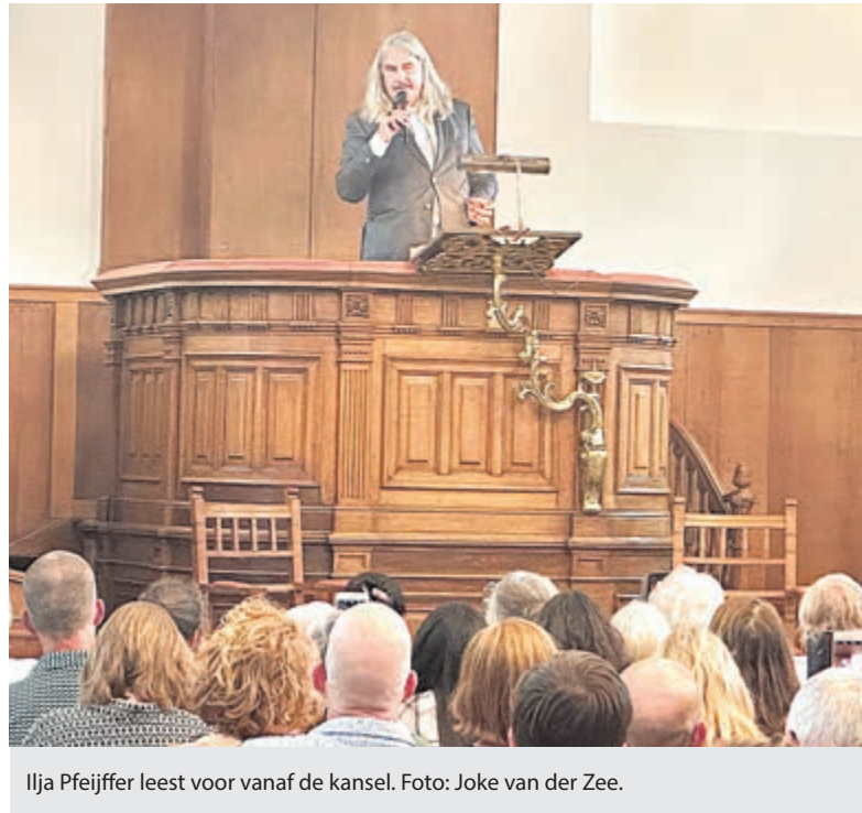
Ilja Pfeijffer leest voor vanaf de kansel.

aandacht van de lezer. In het geval van Alkibiades zal één aspect daar nog een schep bovenop doen: de gelijkheid met de tijd van nu. De kwetsbare positie van een democratie, die door één persoon aan het wankelen kan worden gebracht. Misschien wel door een flamboyante verschijning met fantastische praat, die daarmee veel volgelingen aan zich weet te binden. Dat het blindelings volgen uiteindelijk ook tot een desastreuze val kan leiden, brengt Pfeijffer in zijn roman subtiel over als waarschuwing: “Kijk in de spiegel van de geschiedenis.”