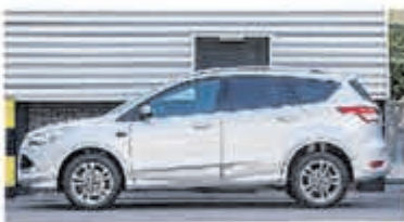
Ford Kuga 1.6 Titanium Pl. 4WD € 17.900,-