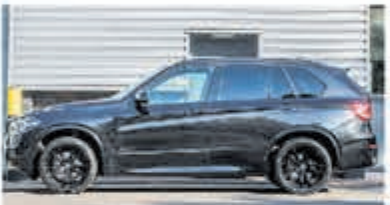
BMW X5 xDrive40e M Sp. Ed. € 54.900,-