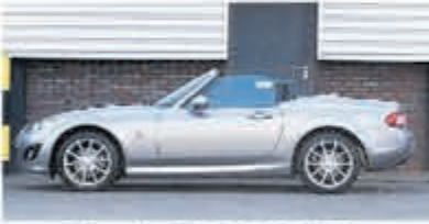
Mazda MX-5 2.0 S-VT Executive € 17.950,-