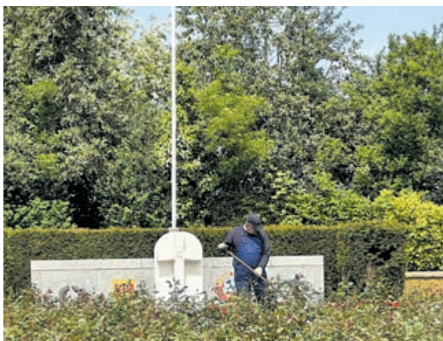
Het groen op de begraafplaats van Georgische soldaten wordt netjes bijgehouden.