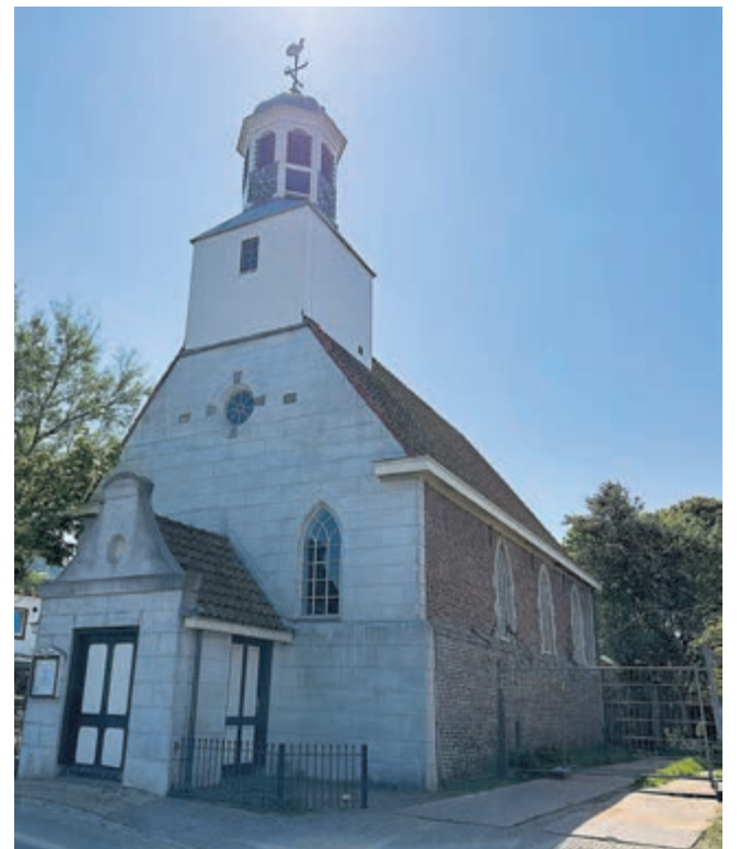
Lieflijk kerkje aan het pleintje midden in de levendige plaats De Koog.