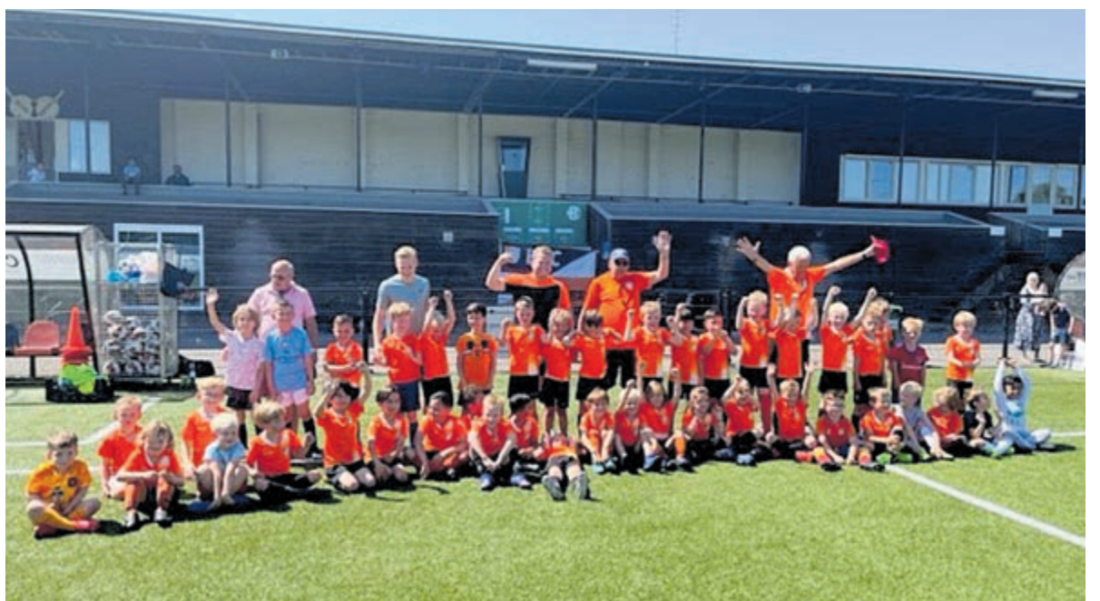
De HBC mini's.

Als verrassing kregen alle kinderen een bal, aangeboden door Sport 2000. Zo werd een leuk seizoen schitterend afgesloten.