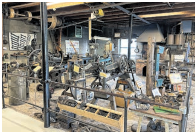
Een blik op de oude smederij in het cultuur-historisch museum, aanrader.