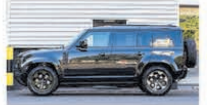
Land rover Defender 2.0 P400e 110X SE € 115.000,-