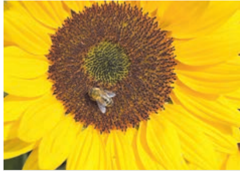
Bij op zonnebloem.

Nederlandse Bijenvereniging Nederland telt ongeveer 11.000 imkers