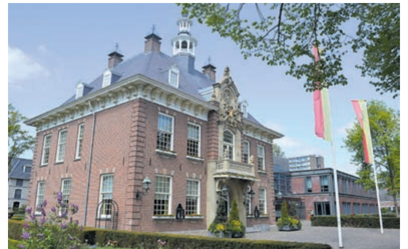
Raadhuis Heemstede.

Op donderdag 22 juni aanstaande is er een informatiebijeenkomst voor