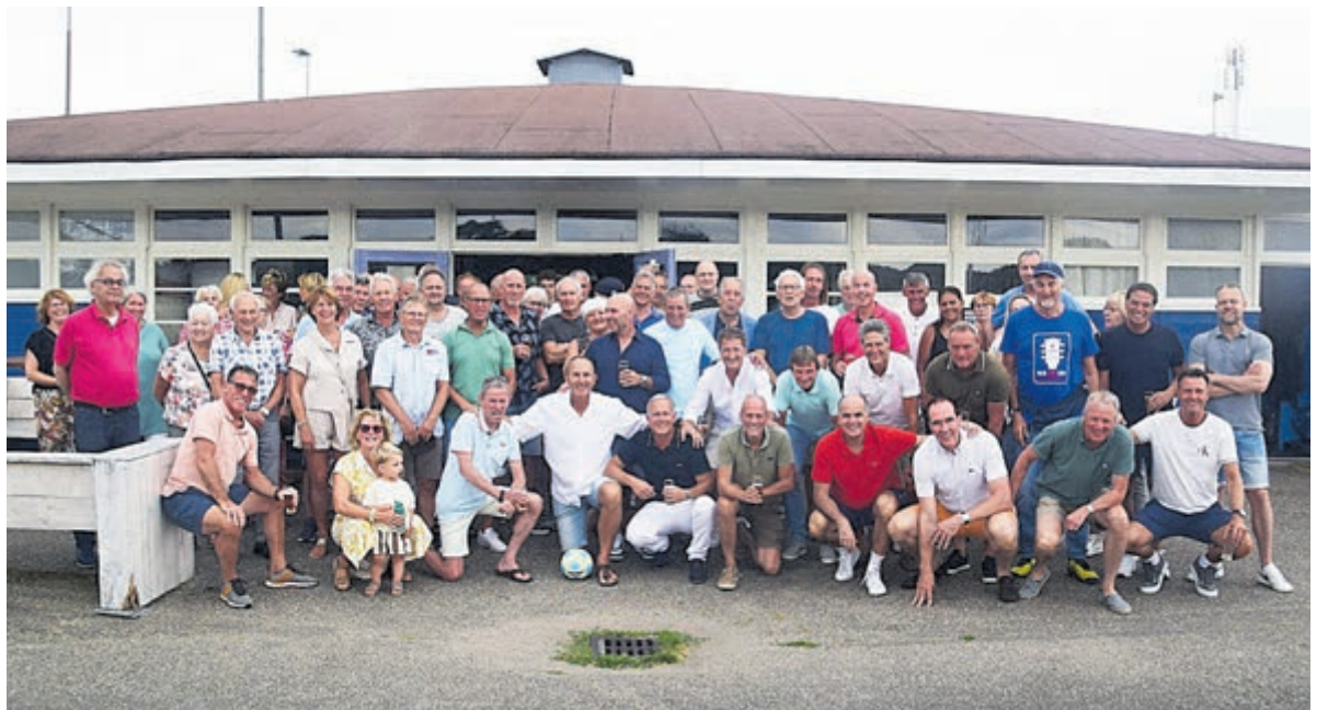
Vele hoofdklassers bij elkaar.