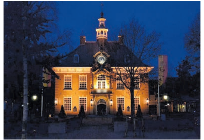
Raadhuis Heemstede.

Inwoners gaan meer betalen Om het verwachte begrotingsgat te dichten wil het college een miljoen