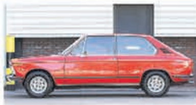
BMW 02-serie 1802 Touring € 14.950,-