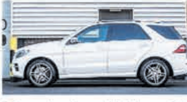
Mercedes-benz M-klasse 350 € 34.950,-