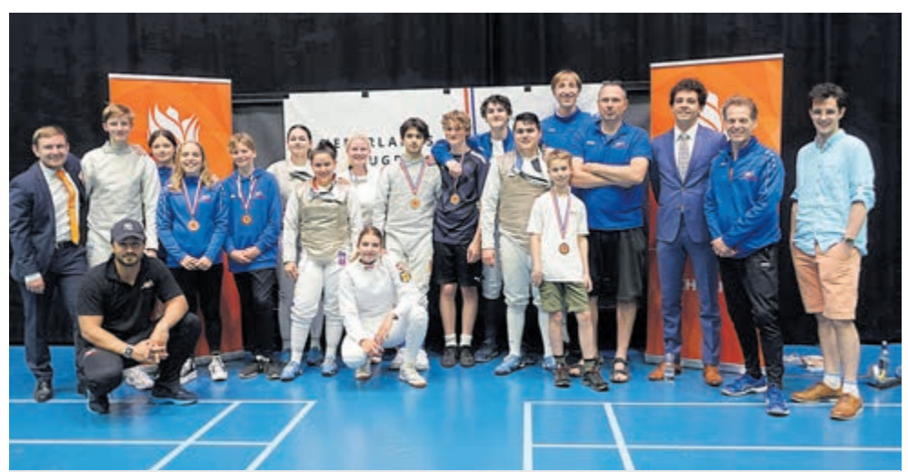
Groep HollandSchermen op NJK 2023.