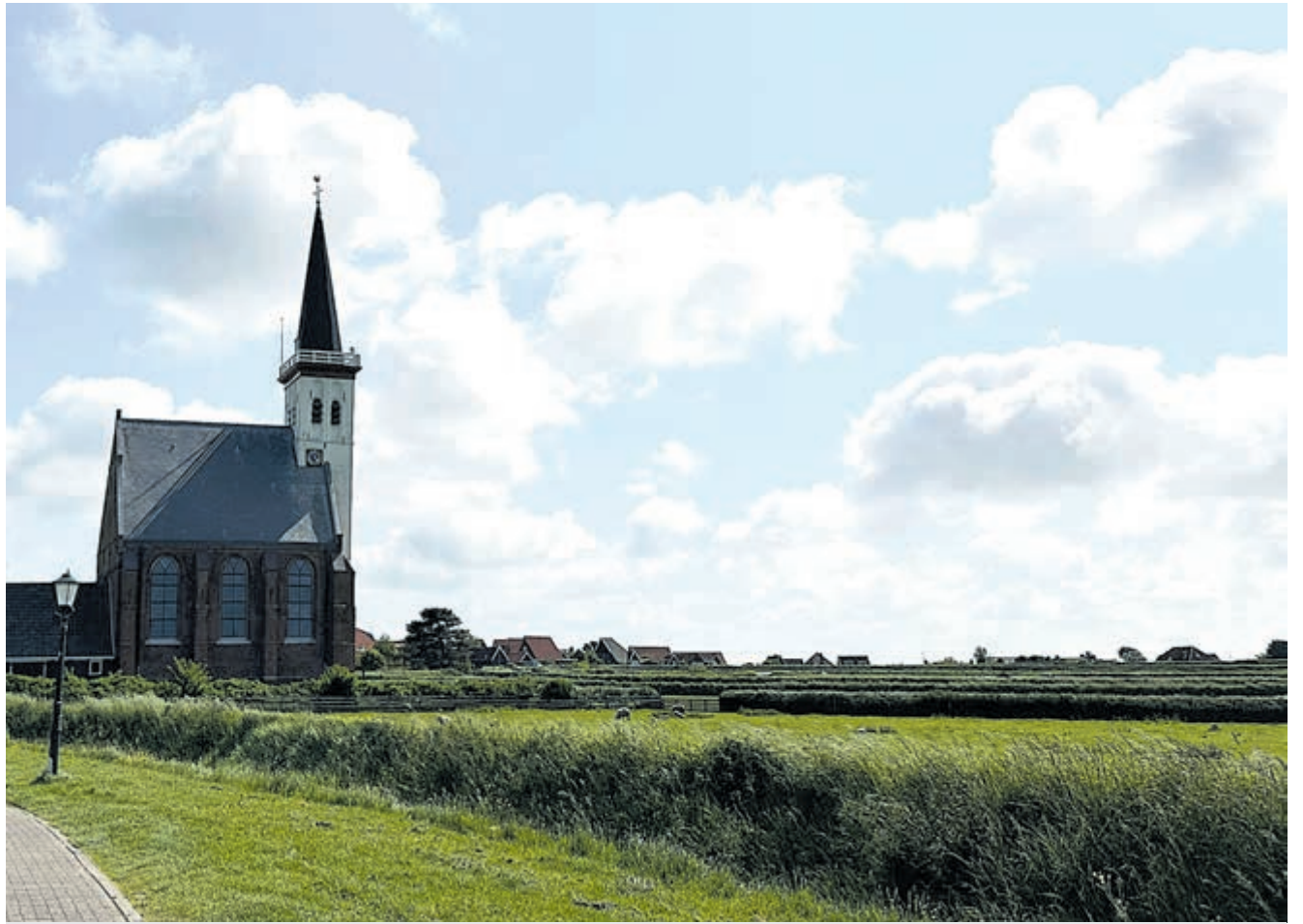
Kerkje van het pittoreske Den Hoorn.

De weinige dorpen van het eiland hebben een eigen identiteit. Cocksdoorp helemaal bovenin – alleen de vuurtoren staat nog noordelijker – is een mooi doel voor een fietstocht. Lekker een visje eten en daarna de Francisca Romanakerk bekijken. De Koog westelijk op Texel heeft veel restaurantjes, hotels en een mooi strand. In het speldenprikje De Waal staat het cultuurhistorisch museum dat echt de moeite waard is. Een ander tot de verbeelding sprekende geschiedenis is de plaats waar honderden Georgiërs zijn begraven; zij vonden de dood tijdens de Tweede Wereldoorlog toen zij op Texel verbleven, als krijgsgevangenen uit Rusland. Ze hadden zich voor meer overlevingskansen opgegeven om voor de Duitsers te vechten maar tijdens een opstand sneuvelden honderden van hen, ook zeker 100 Texelaars trouwens. Nabij Den Burg is een kerkhof ingericht.