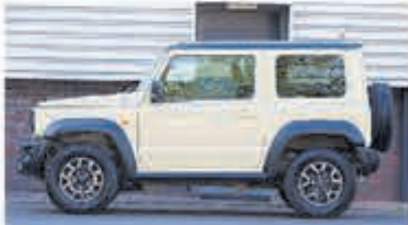
Suzuki Jimny 1.5 Stijl € 35.750,-