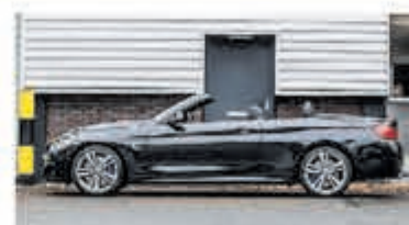
BMW 4-serie Cabrio 440i Cent Hi Exec € 41.950,-