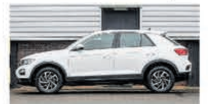
Volkswagen T-Roc 1.0 TSI € 20.950,-

ZATERDAGHULP GEVRAAGD VOOR HET WASSEN VAN AUTO'S