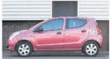
Suzuki Alto 1.0 Comfort € 4.700,-