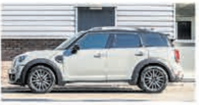
Mini Countryman 2.0 Cooper D € 16.950,-