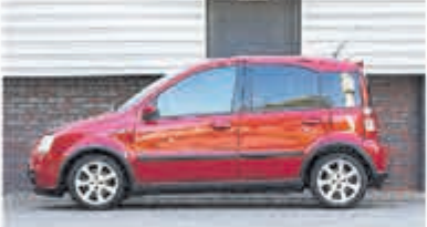
Fiat Panda 1.4 16V Sport € 4.950,-