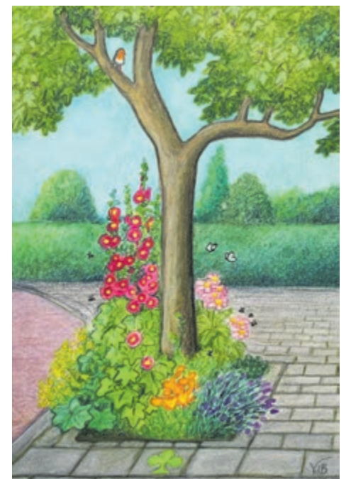
Boomspeigel van kunstenaress Vera de Backker