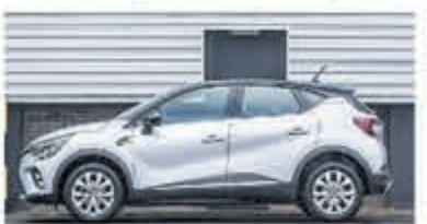
Renault Captur 1.6 Hybrid Intens € 28.950,-