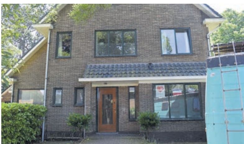
Het pand aan de Heemsteedse Dreef 156.

geïnformeerd en hebben daar nog niet in het openbaar gereageerd. Voor het college is het de eerste stap in het oplossen van de problemen bij het opvangen van statushouders en asielzoekers. De gemeenteraad moet de investering nog goedkeuren, verwacht wordt dat dit deze maand nog zal gebeuren. Het pand zal of overgedragen of verhuurd worden aan het COA. Waar de praktijk van de huisarts naar toe gaat verhuizen is niet bekend.