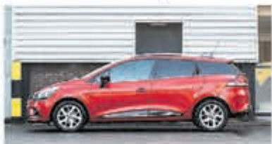
Renault Clio Estate 1.2 TCE Zen. € 15.950,-