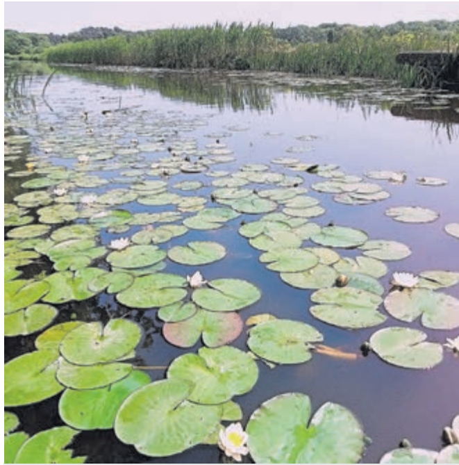
Een zijslot van de Leidsvaartweg richting het Manpadsveld.

Monet schilderde de tuinen rond zijn huis en concentreerde zich vervolgens op de watertuinen die hij tussen 1897 en zijn dood in 1926 herhaaldelijk schilderde. Deze waterlandschappen en reflecties zijn een obsessie geworden. Een tuinman verzorgde de lelies zo, dat ze geschikt waren voor Monets schilderijen.