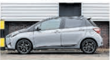
Toyota Yaris 1.5 Hyb Bi-Tone Plus € 17.950,-