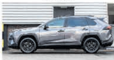
Toyota RAV4 2.5 Hybrid Dynamic € 36.900,-