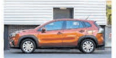
Suzuki S-Cross 1.4 B.jet Comfort SH € 28.950,-