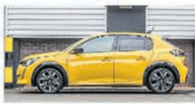
Peugeot 208 1.2 PureTech GT-Line € 25.950,-