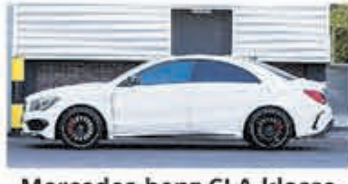
Mercedes-benz CLA-klasse 45 AMG 4MATIC Ed. 1 € 28.900,-