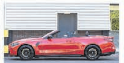
BMW 4-serie Cabrio M4 xDrive Competit € 159.000,-