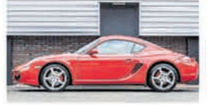
Porsche Cayman S Tiptronic Uniek 80.000 km € 29.950,-