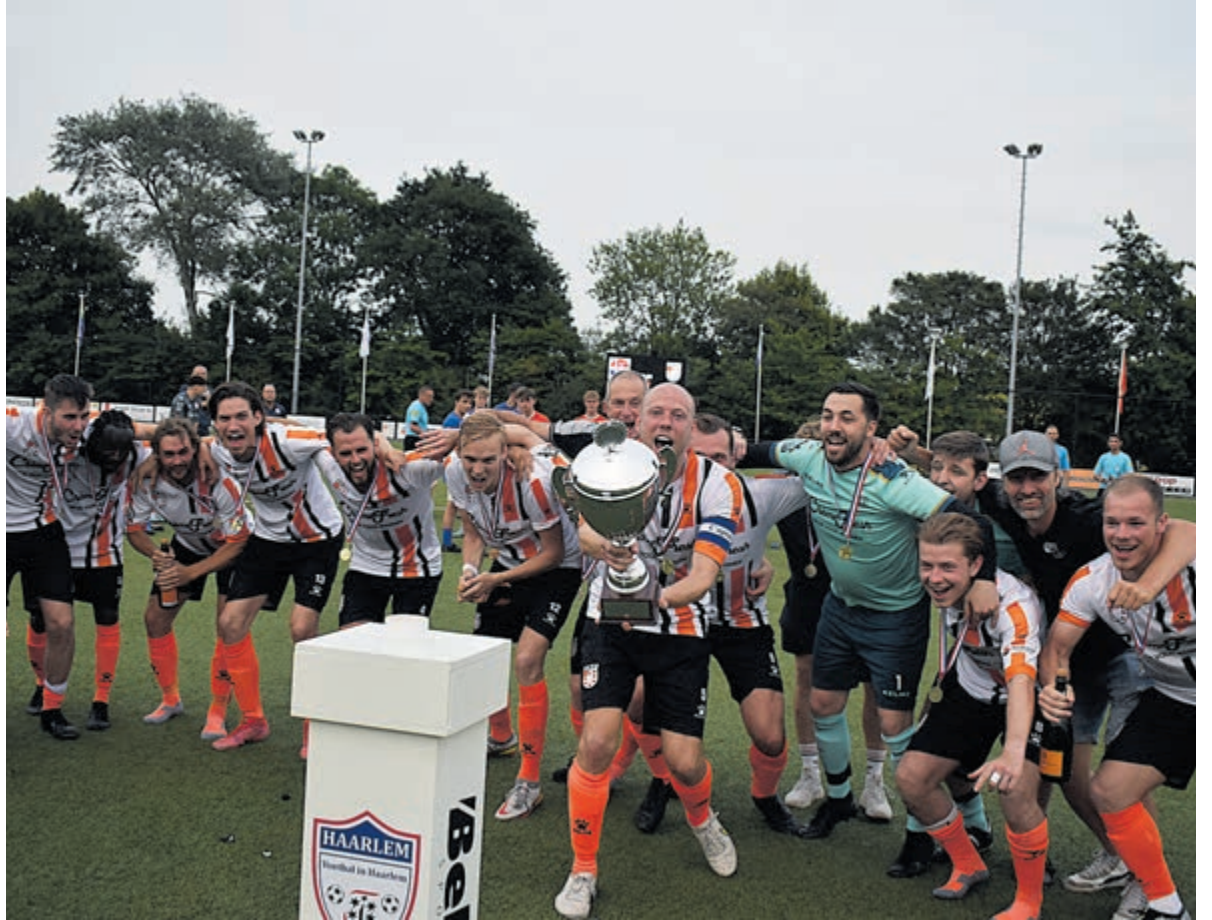
HBC wint Midwest Cup.

De strijd ging aanvankelijk redelijke gelijk op, waar HBC toch al snel op een 2-0 voorsprong kwam. Arno Dijkstra en Brian Wilderom tekenden voor de eerste twee doelpunten. Na de pauze gooide HBC de wedstrijd op slot met een doelpunt van Arno Dijkstra, hiermee leek de overwinning nabij. Hoofddorp weigerde het hoofd in de schoot te leggen en bouwde aan een overwicht. Via de boomlange spits die twee keer scoorde kwamen ze terug in de wedstrijd. De HBC moest een paar keer handelend optreden. De gelijkmaker hing in de lucht toen HBC orde op zaken stelde. Arno Dijkstra scoorde zijn derde van de middag en vergrootte de marge met Hoofddorp. Ver in blessuretijd kende de arbiter nog een penalty toe aan HBC. Ook hier zat de leidsman er naast, maar niemand die er verder om maalde. Neil van Hooff mocht in zijn allerlaatste wedstrijd voor HBC de trekker overhalen en de eindstand bepalen op 5-2. De vakantie kan nu echt beginnen.