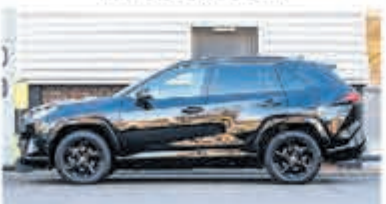
Toyota RAV4 2.5 Hybrid AWD Enrg+ € 38.950,-