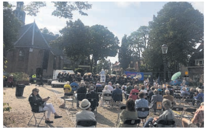
Het concert in 2021.

Het belooft ook dit jaar weer een fantastische middag te worden.