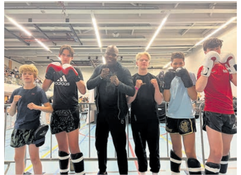
Fantastische resultaten voor team Boks Heemstede. Foto aangeleverd.

Boks Heemstede is gevestigd aan de Handellaan 174a in Heemstede. Meer informatie op: www.boksheemstede.nl .