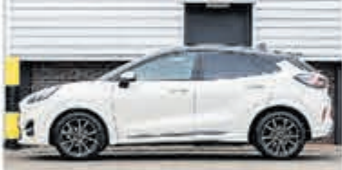
Ford Puma 1.0 EB Hyb ST-Line X € 25.750,-