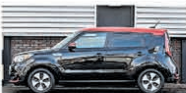
Kia E-Soul ExecutiveLine 30kWh € 19.950,-