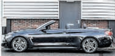
BMW 4 Serie 430i Cabrio € 49.950,-