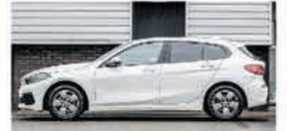
BMW 1-serie 118i € 26.900,-