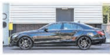
Mercedes-benz CLS-klasse 350 € 22.750,-