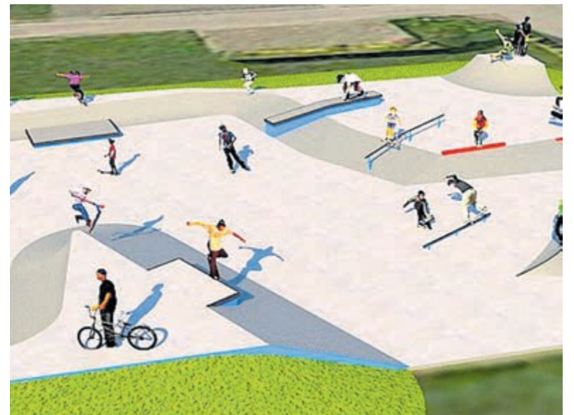
Tekening van de nieuwe skatebaan.

Iedereen is natuurlijk van harte welkom om op zaterdag 25 juni deze opening bij te wonen en/of de skatebaan uit te proberen.