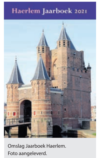
Omslag Jaarboek Haarlem.