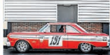
Ford Usa Falcon FUTURA SPRINT € 79.000,-