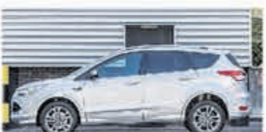
Ford Kuga 1.6 Titanium Pl. 4WD € 18.450,-