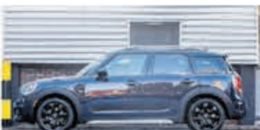
Mini Countryman 1.5 Cooper Salt € 24.950,-