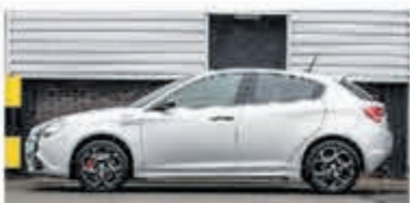
Alfa Romeo Giulietta 1.4 T Distinctive € 14.950,-