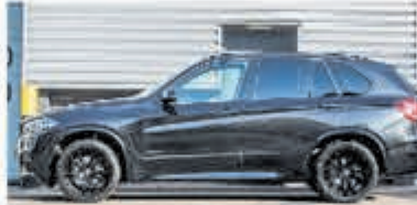
BMW X5 xDrive40e M Sp. Ed. € 59.900,-