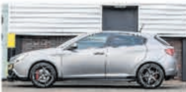
Alfa Romeo Giulietta 1.7 TBI Quad. V. € 23.950,-