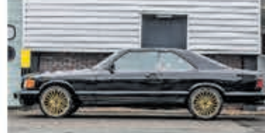
Mercedes-benz S-klasse 380 SEC € 10.950,-