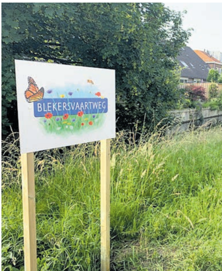
Het bloeiende straatnaambord aan de Blekersvaartweg

De gemeente Heemstede stimuleert biodiversiteit met de aanleg van bloemenweides. De Blekersvaartweg is de zesde bloemenweide waar op dit moment de klaprozen uitbundig bloeien.