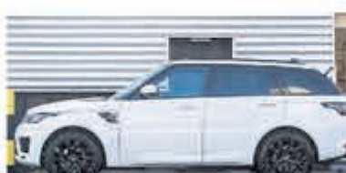
Land Rover Range Rover Sport P400e HSE € 102.950,-