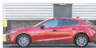
Mazda 3 2.0 S.A. 120 TS € 22.900,-