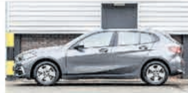
BMW 1-serie 116d Sp.Line Edition € 29.900,-