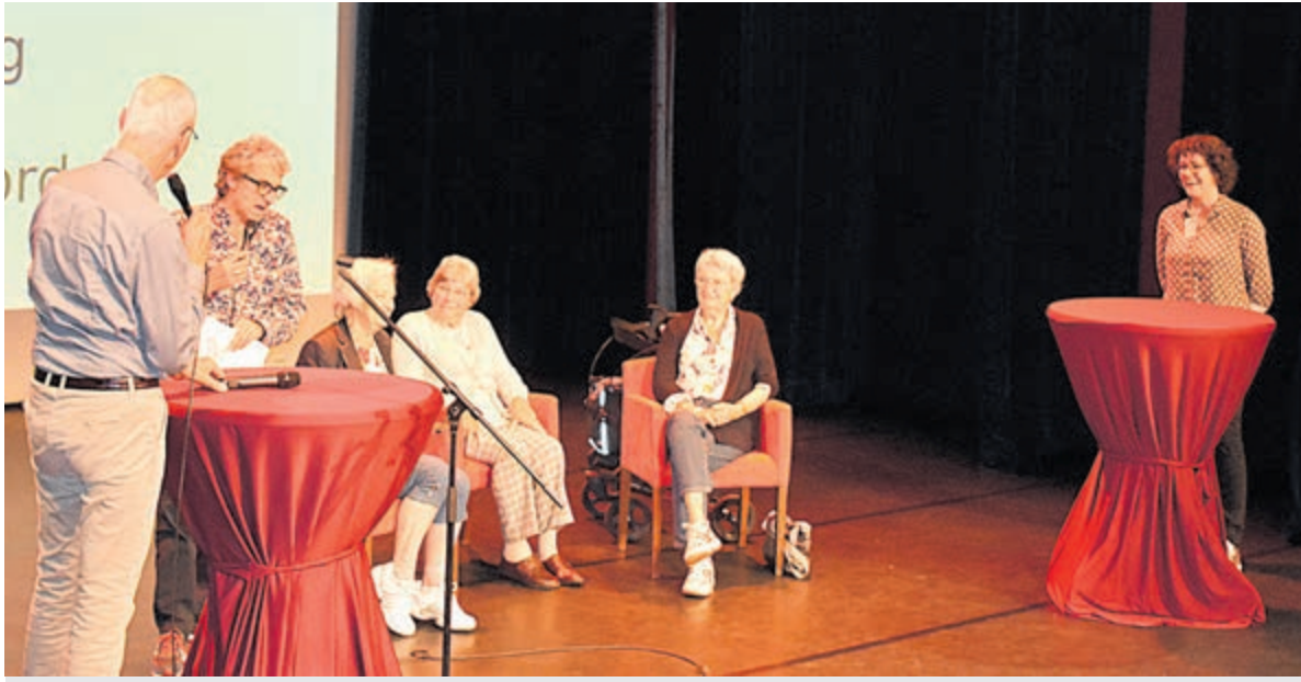
Eenzaamheid bespreekbaar maken.