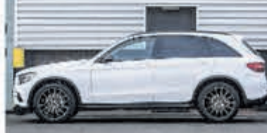
Mercedes-Benz GLC-klasse 250 d 4MATIC Luchtvering € 48.900,-