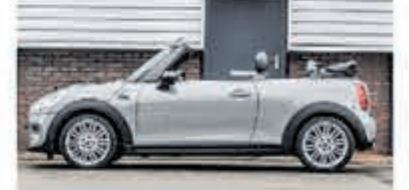
Mini Cooper Cabrio 1.5 C. Chili S. Bns € 25.950,-