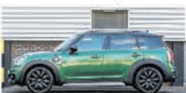
Mini Countryman 1.5 Co.S E ALL4 Chil € 38.900,-