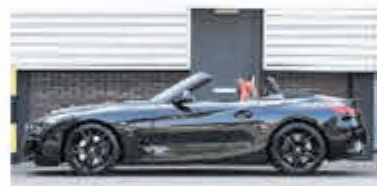
BMW Z4 Roadster sDrive30i Hi. Ex. Ed € 54.950,-