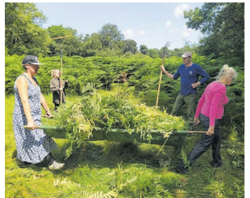
Werkdag op Leyduin.

Tot ziens op 3 juli aan de Zandlaan, ingang 250 meter voorbij nummer 36 in Bennebroek.