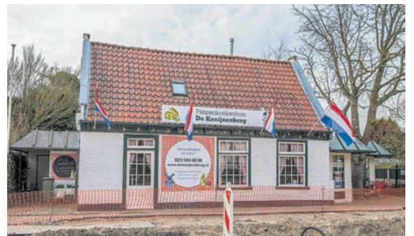
Pannenkoekenrestaurant de Konijnenberg. Foto aangeleverd.

Aan de rand van dit bos, langs de Vrijheidsdreef ligt het overblijfsel van de eerste Floriade, in het bos wordt een nieuwe Belvédère gebouwd. Na de wandeling drinken we een kop koffie in pannenkoekenhuis 'de Konijnenberg'. Een ervaren gids van de Historische Vereniging Heemstede Bennebroek, begeleidt de wandeling. Kosten: €3,- Aanmelden via www.wijheemstede.nl , info@wijheemstede.nl of 023 - 5483828.