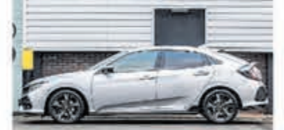
Honda Civic 1.5 i-VTEC Sport + € 24.950,-