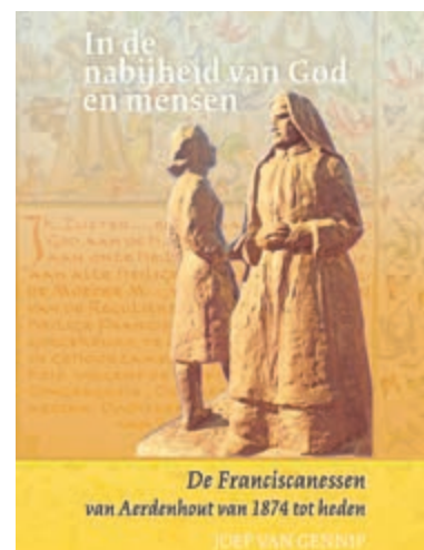
Omslag van het boek. Foto aangeleverd.

In de nabijheid van God en mensen. De Franciscanessen van Aerdenhout van 1874-heden. ISBN 9 789087 049935.