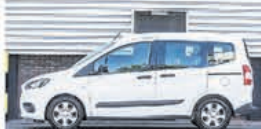
Ford Tourneo Courier 1.0 Titanium € 14.950,-