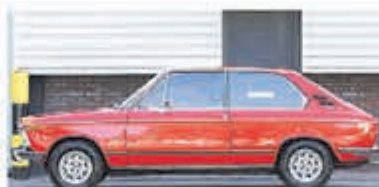
BMW 02-serie 1802 Touring € 14.950,-