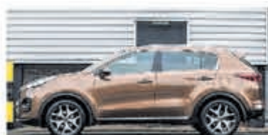
Kia Sportage 1.6 T-GDI 4WD GT-L. € 25.750,-