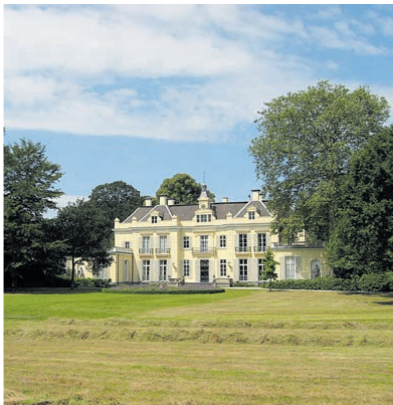
De Hartekamp.

De wandeling op zondag 10 juli start langs de oranjerie naar het hoofdge-