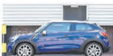
Mini Paceman 1.6 Cpr S ALL4 Chili € 12.950,-