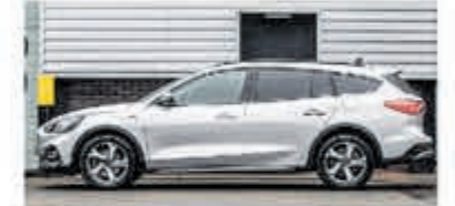
Ford Focus Wagon 1.0 EcoB. Tit. Bns € 27.900,-