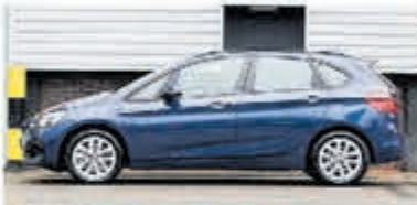
BMW 2-serie Active Tourer 225xe iP eDr. Ed. € 32.950,-