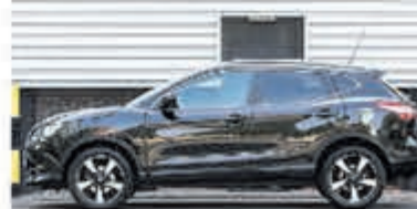
Nissan Qashqai 1.2 Tekna € 17.400,-