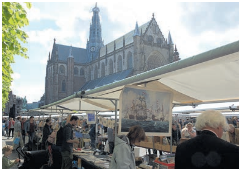
De grote boekenmarkt op de Grote Markt in Haarlem.

Het beste is de auto te parkeren in garage De Appelaar, Stationsplein, Raaks of De Kamp. Alle parkeergarages liggen op loopafstand van de markt.