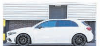
Mercedes-benz A-klasse 180 Premium Plus € 42.950,-