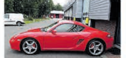
Porsche Cayman S Tiptronic Uniek 76.000 km € 29.950,-

Turenhout de occasiondealer van Heemstede en al meer dan 40 jaar uw vertrouwde onderhoudsadres.