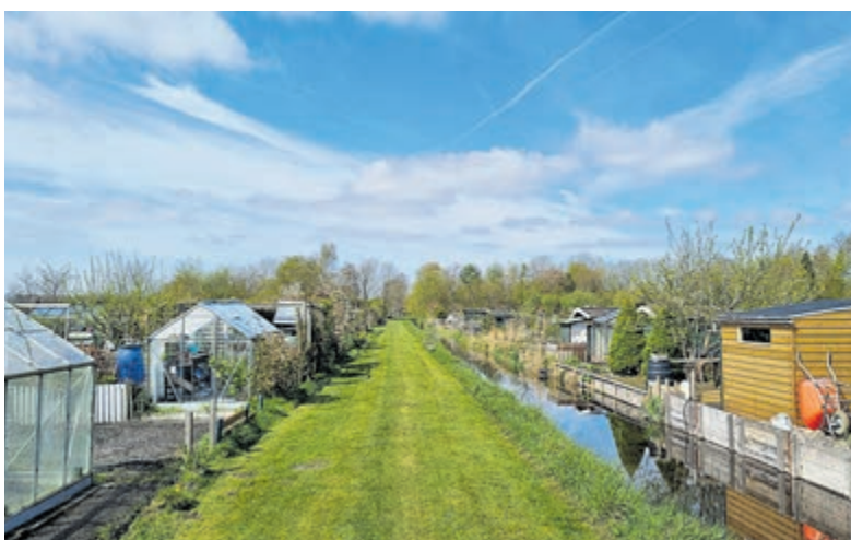
De tuinen van BATV.

Bennebroek - Op zondag 3 juli vindt vanaf 10.00 tot 14.00 uur de jaarlijkse open dag van amateur tuindersvereniging BATV plaats. Er is een moestuinmarkt met verkoop van groenten, aardbeienplanten, stekjes, honing en inmaakproducten. Er zijn rondleidingen en tegen een kleine vergoeding zijn er pannenkoeken en is er koffie, thee en limonade verkrijgbaar. Makkelijk te bereiken per fiets of auto, er is ruime gratis parkeergelegenheid.