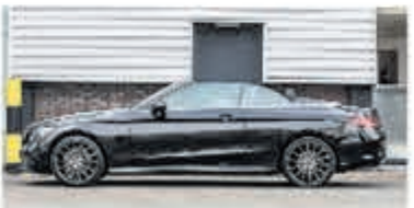
Mercedes-Benz C-klasse 220 d Cabrio Premium Pack € 48.900,-